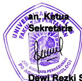
Dewi Rezki SP. MP

Atas perhatian, kesediaan dan kehadiran Bapak/Ibu/Saudara tepat pada waktunya, kami ucapkan terima kasih