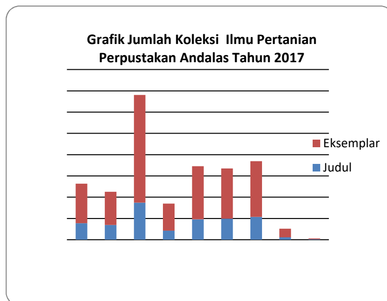
Gambar 2. Grafik Jumlah Koleksi Bidang Ilmu Pertanian

Dari 9 sub bidang ilmu pertanian yang disajikan pada tabel di atas, koleksi Teknik Khusus dalam Pertanian memiliki judul paling banyak, yaitu 349 judul, begitu juga dengan total jumlah koleksi dengan 1.012 eksemplar. Untuk melihat perbedaan jumlah koleksi per sub bidang ilmu secara lebih jelas, bisa dilihat pada Gambar 2.