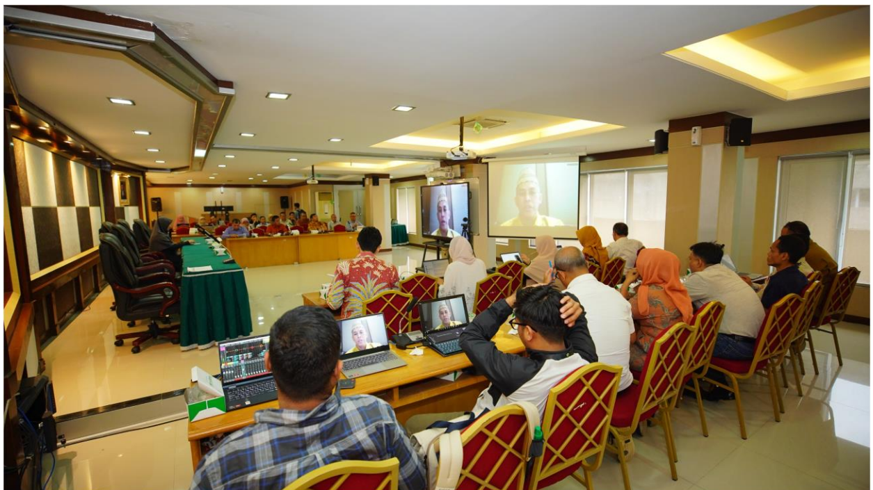
Gambar 2 : Komisioner Komisi Informasi bidang Penyelesaian Sengketa Bapak Syawaludin memberikan arahan terkait dalam Penyusunan Daftar Informasi Publik dan Daftar Informasi Dikecualikan di PTN pada