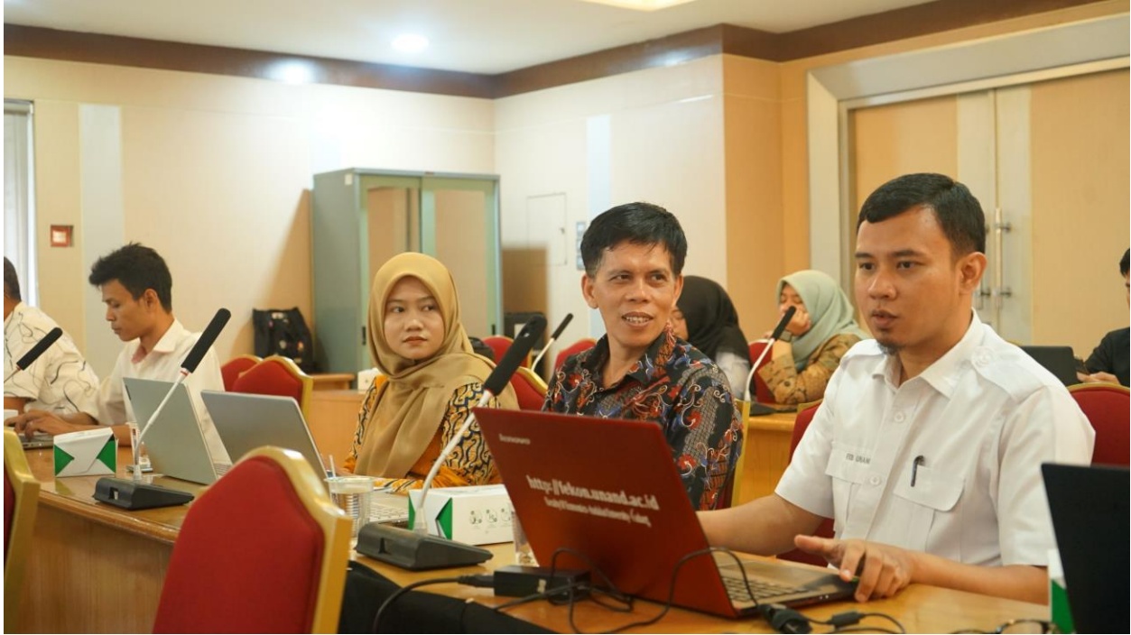
Gambar 3 dan 4 : Antusias pengelola website fakultas mengikuti bimbingan teknis dalam mengikuti acara Pengintegrasian Data Informasi Publik pada Website PPID Pelaksana di Lingkungan Universitas Andalas