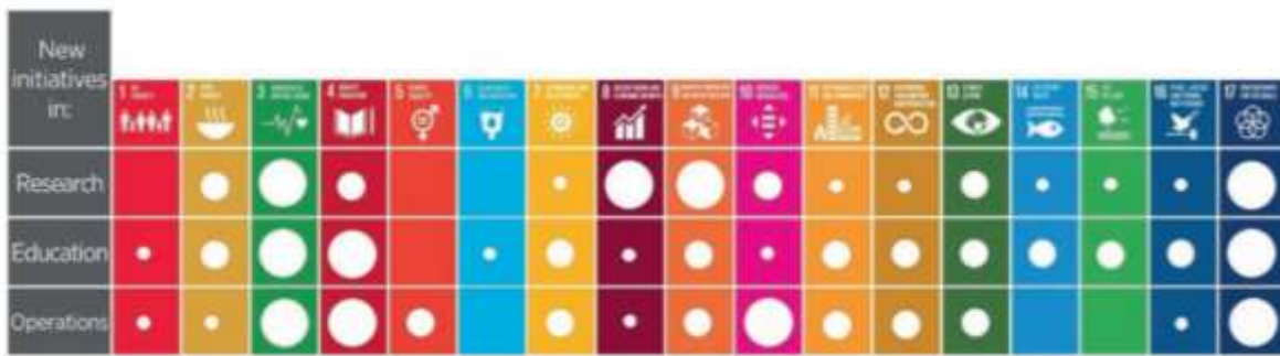
Gambar 2. SDG Mapping of the Selected University Initiatives

Sementara itu SDGs juga sudah menjadi acuan dalam menentukan Ranking Universitas yang dilakukan oleh THE Impact Ranking seperti Gambar 3.