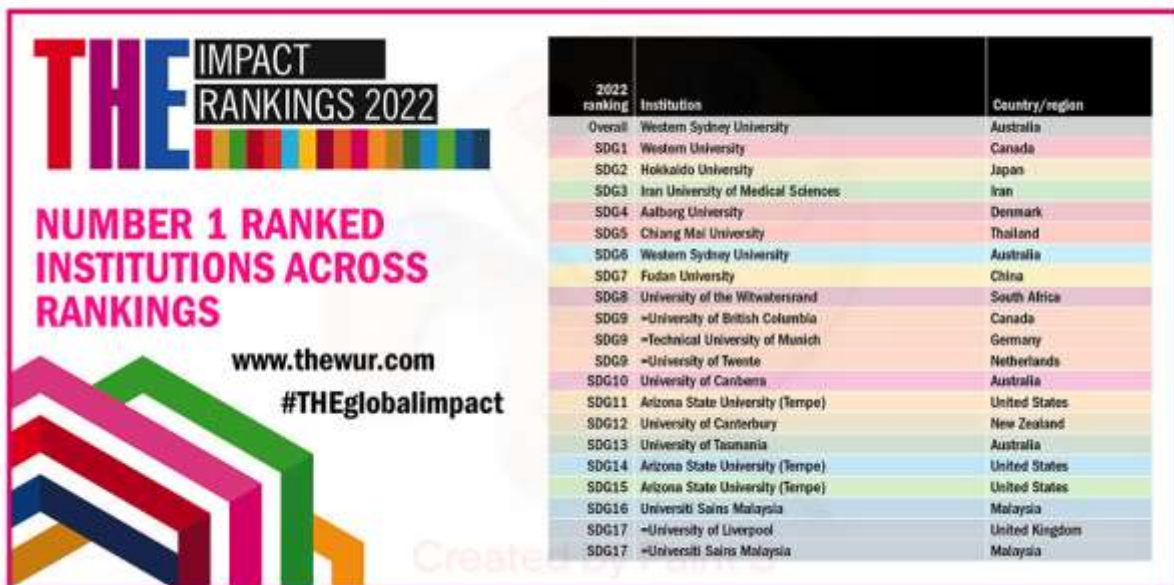
Gambar 3. THE Impact Ranking berdasarkan SDGS

Sementara itu SDGs juga sudah menjadi acuan dalam menentukan Ranking Universitas yang dilakukan oleh THE Impact Ranking seperti Gambar 3.