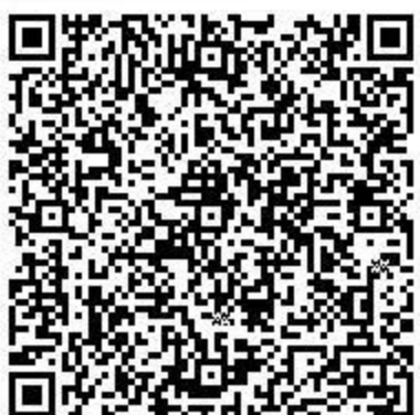
mengetahui Dr. H. Syahrul Yasin Limpo, S.H., M.Si., M.H. Menteri Pertanian

Telah mengikuti Bimbingan Teknis dan Sosialisasi Tanaman Pangan ‘Series Pertanian Back to Nature: Kupas Tuntas Porang by Jimmy Hantu Foundation ( Episode 505 )’ Tanggal 24 Juni 2022