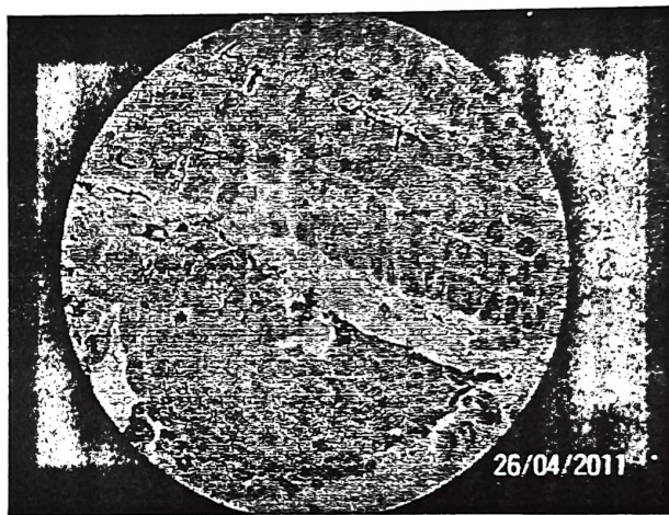
Gambar 4. Pembelahan mitosis genotipe Mundam pulau

Allelokimia dapat mempengaruhi pertumbuhan atau fungsi metabolisme tertentu pada spesies tanaman yang menjadi target allelopati. Pengaruh-pengaruh tersebut bisa termanifestasikan melalui aktivitas metabolisme yang berbeda-beda, termasuk pembelahan dan pemanjangan sel (Rice, 1984). Hasil yang diperoleh pada percobaan ini juga sesuai dengan beberapa hasil penelitian lainnya yang mengamati pengaruh senyawa allelokimia terhadap penghambatan pertumbuhan melalui penekanan aktivitas pembelahan sel seperti pada selada ( Lactuca sativa L.) (Levizou et al. , 2002) dan kedelai (Chaniago, 2004).