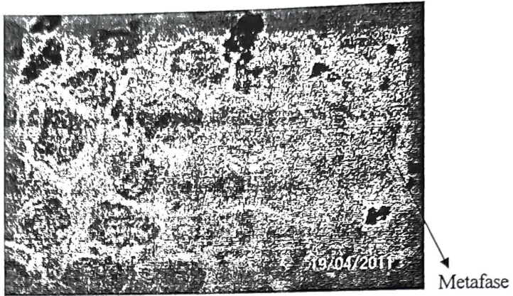
Gambar 3. Pembelahan mitosis genotipe Batang piaman