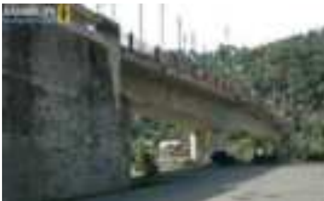
Gambar 7.8. Jembatan Siti Nurbaya