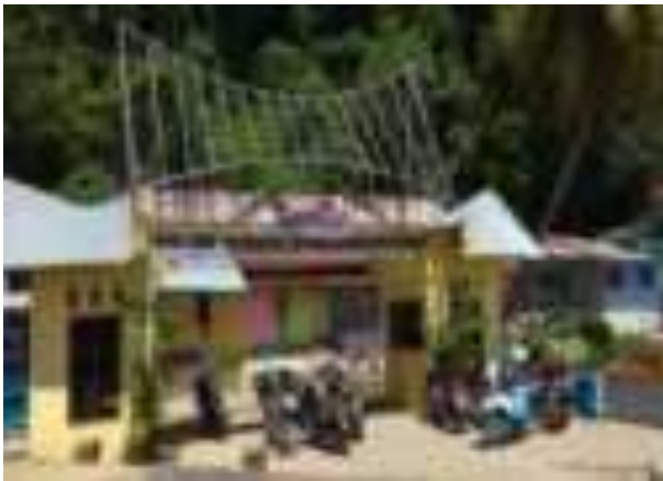
Gambar 4.2. Gerbang Masuk Objek Wisata Gunung Padang

Gunung Padang menurut novel Sitti Nurbaya , merupakan bukit di tepi pantai dimana Sitti Nurbaya memadu cinta dengan kekasihnya Samsulbahri dan disitu jugalah mereka dikuburkan. Di gerbang menuju lokasi wisata Kuburan dan Taman Siti Nurbaya, pengunjung belum mendapatkan informasi yang jelas dan berhubungan dengan novel Sitti Nurbaya , seperti tanda penunjuk tempat, tanda penunjuk tentang informasi sastra pada lokasi tersebut, tanda penunjuk fasilitas lokasi wisata, dan tanda penunjuk destinasi wisata sastra Siti Nurbaya berikutnya.