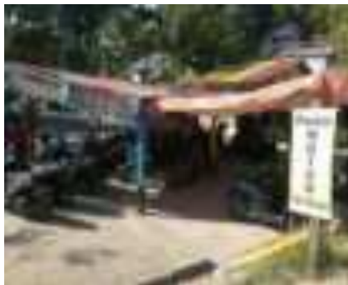
Gambar 5.2. Tempat Parkir