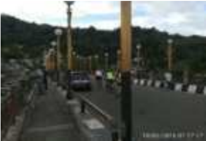
Gambar 4.1. Jembatan Siti Nurbaya

wisata Siti Nurbaya, namun tidak terdapat penunjuk arah yang akan mengarahkan pengunjung ke Kuburan dan Taman Siti Nurbaya sebagai tujuan berikutnya. Sejumlah pengunjung juga mengungkapkan bahwa mereka tidak mengetahui tentang fasilitas serta sarana dan prasarana yang ada di lokasi wisata sastra Siti Nurbaya. Mereka menyarankan pengembangan dengan memberikan tanda penunjuk arah.