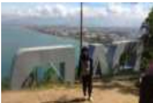
Gambar 8.9. Pemandangan kota Padang dari Gunung Padang

untuk mendatangi objek wisata Gunung Padang bukan lagi karena legenda Sitti Nurbaya tapi hanya karena pemandangan yang disajikan sangat indah dan tempat yang pas untuk berolahraga dan juga menjadi tempat tujuan untuk berfoto.