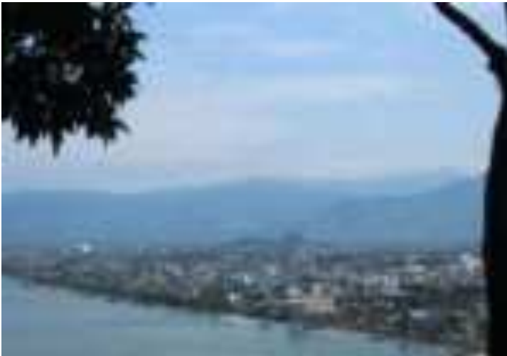
Gambar 9.6. Kota Padang