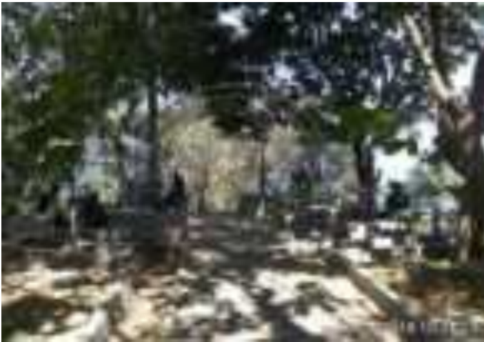
Gambar 4.9. Gerbang Taman Siti Nurbaya

mendaki melalui jalur-jalur tangga yang telah tersedia sejauh 1 km. Para pengunjung tidak perlu khawatir akan panas yang menyengat karena di sisi-sisi bukit ini masih banyak ditumbuhi oleh pohon-pohon rindang. Sehingga, akan membuat perjalanan ke atas bukit menjadi nyaman. Kemudian, di puncak Gunung Padang, ada tanah lapang, yang disulap menjadi taman bermain, seolah tempat Siti Nurbaya sempat memadu kasih dengan Samsulbahri.