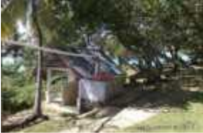
Gambar 12. Toilet di Taman Siti Nurbaya

Kini wisata sastra Siti Nurbaya menjadi salah satu tujuan di Kota Padang. Begitu juga dengan jembatan, Kuburan dan Taman Siti Nurbaya, yang kerap dikunjungi wisatawan yang ingin memahami cerita fiksi yang melegenda tersebut secara langsung pada latarnya. Dengan animo yang besar ini, masih banyak pekerjaan rumah bagi pengelola terhadap destinasi wisata ini seperti fasilitas umum, fasilitas penunjang, sarana dan prasarana, keamanan, dan tentunya tanda penunjukan arah dan informasi.