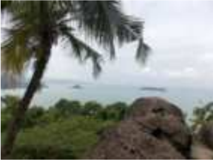
Gambar 8.8. Pemandangan dari Gunung Padang

Menurut sejumlah pengunjung, pemandangan gunung yang bisa dinikmati pengunjung saat sampai dipuncaknya menjadi alasan nomor satu. Tanggapan wisatawan menunjukkan bahwa representasi Sitti Nurbaya di Gunung Padang mulai pudar. Hal ini terjadi barangkali karena berubahnya alasan orang-orang untuk berkunjung. Sitti Nurbaya di Gunung Padang terkesan hanya sebatas legenda yang dikenal, bahkan pengunjung datang kesini juga bermotif untuk berolahraga karena banyak akses untuk menuju puncak cukup mudah dituju. Banyak keluarga dan muda-mudi menjadikan tempat ini sebagai tujuan berakhir pekan atau sore hari dengan menggunakan pakaian olah raga. Juga, kebanyakan pengunjung yang datang belum pernah membaca cerita Sitti Nurbaya karya Marah Roesli, apalagi muda-mudi saat ini. Motif