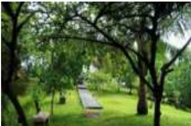
Gambar 7.4. Taman Siti Nurbaya