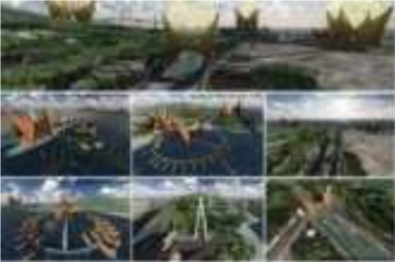
Gambar 3. Konsep Pengembangan Kawasan Wisata Terpadu (KWT) Gunung Padang