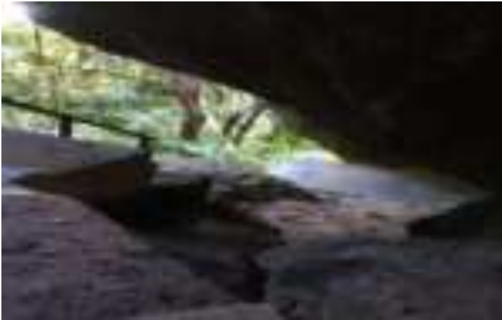
Gambar 11.1. Tangga Menuju Kuburan Siti Nurbaya

besar yang menyerupai goa kecil. Untuk memasuki ke areal tersebut, wisatawan hendaknya menuruni anak tangga dengan hati-hati karena areal tersebut sangat curam yang hanya bisa dilalui oleh satu orang saja.