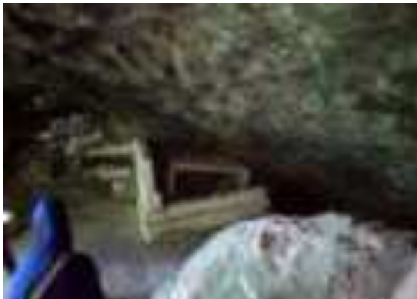
Gambar 4.8. Kuburan Siti Nurbaya

Kuburan yang disebut sebagai Kuburan Siti Nurbaya, berupa batu nisan yang ukurannya sedikit lebih panjang dari kuburan kebanyakan. Batu kuburan berwarna putih. Suasana di dalam remang-remang karena minim cahaya matahari yang masuk dari celah batu. Beberapa coretan di dinding kuburan, bertuliskan, dilarang untuk memotret di dalam kuburan. Anehnya, di kuburan tersebut, tak ada batu nisan yang bertuliskan nama, tanggal lahir dan tanggal wafat seperti layaknya kuburan yang lain. Menjelang sampai ke puncak Gunung Padang, pengunjung bisa melihat Kuburan Siti Nurbaya. Kondisi kuburan itu sedikit memprihatinkan dengan adanya coretan pada kiri kanan dindingnya.