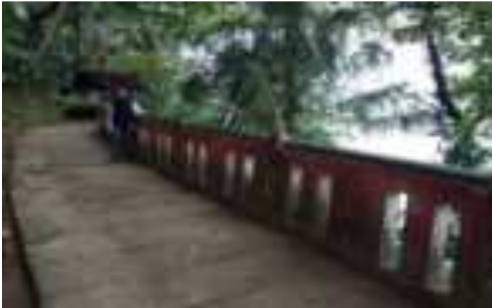
Gambar 7.2. Jalan menuju Taman Siti Nurbaya

Aksesibilitas merupakan faktor-faktor yang mendukung dan mempermudah wisatawan untuk menuju ke objek wisata yang terdiri dari: