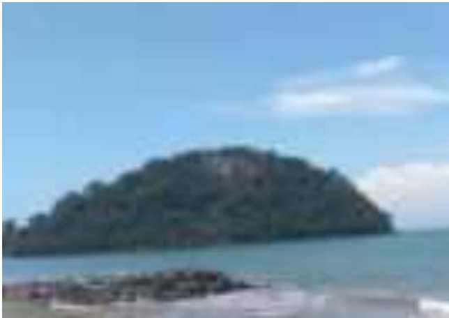
Gambar 5.5. Gunung Padang