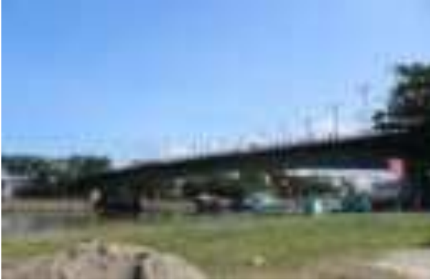
Gambar 9.1. Jembatan Siti Nurbaya