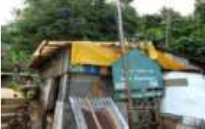
Gambar 4.3. Tanda Petunjuk Tentang Kuburan Siti Nurbaya

Hal ini menunjukkan bahwa Gunung Padang difungsikan sebagai destinasi wisata alam dimana pengunjung bisa mendaki bukit ini untuk berolahraga dan menikmati pemandangan dari atas serta bergembira ria disana. Pengelolaan destinasi ini belum mengindikasikan bahwa disamping wisata alam, tempat ini juga memiliki potensi wisata sastra. Pengunjung yang sudah membaca cerita Sitti Nurbaya belum bisa memenuhi keingintahuan mereka dengan latar cerita tersebut di Gunung Padang secara informatif.