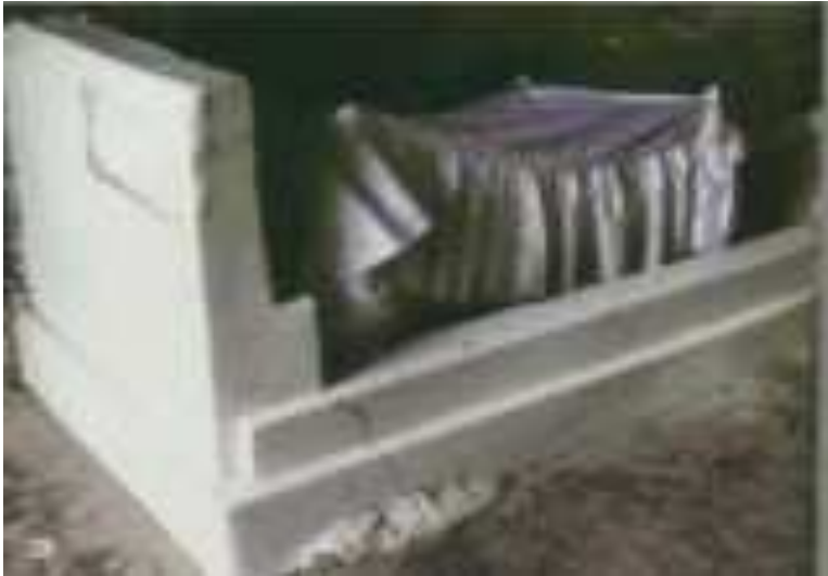
Gambar 6.3. Makam Sitti Nurbaya

makam. Perjalanan tidak terlalu menyulitkan karena anak tangga untuk menuju ke lokasi telah dibangun dengan baik dan mengutamakan keamanan para wisatawan. Bukit tempat disemayamkannya Sitti Nurbaya ini memiliki nama yang sama dengan Jembatan Siti Nurbaya, yaitu “Bukit Siti Nurbaya.”