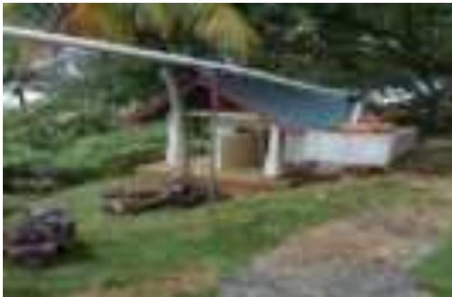
Gambar 7.9. Toilet di Taman Siti Nurbaya

Taman Siti Nurbaya sudah dilengkapi dengan toilet / kamar kecil yang disediakan di puncak Gunung Padang. Walaupun sarana vital ini sudah ada, keberadaannya masih belum memadai baik dari segi kebersihan ataupun kecukupan air.