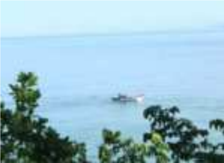
Gambar 9.5. Samudra Indonesia