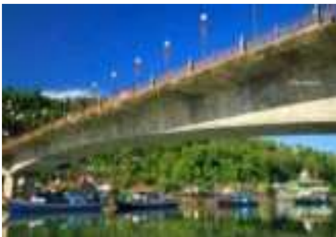
Gambar 6.1. Jembatan Siti Nurbaya

kawasan Kota Tua Padang di Berok Nipah dengan kaki Gunung Padang di seberangnya. Gunung Padang sendiri menurut novel Sitti Nurbaya , merupakan bukit di tepi pantai dimana Sitti Nurbaya pertama kali bertemu dengan kekasihnya Samsulbahri, disitu juga mereka dimakamkan.