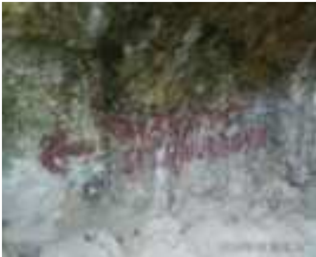
Gambar 4.7. Tanda Petunjuk pada Wisata Sastra Siti Nurbaya

ini hanyalah sebuah gundukan batu biasa menuju Taman Siti Nurbaya. Beberapa orang pengunjung mengatakan mereka tidak mengetahui lokasi Kuburan Siti Nurbaya. Sebenarnya, tanda penunjuk lokasi telah diberikan, mungkin oleh warga setempat atau pengunjung, namun tulisan tidak dibuat dengan menggunakan papan sebagai media tulis atau memberikan warna yang cerah sehingga mudah terlihat oleh para pengunjung.