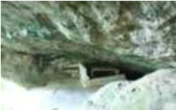
Gambar 9.3. Kuburan Siti Nurbaya

Para wisatawan mengunjungi Gunung Padang dengan beberapa alasan, ada diantara mereka yang ingin maraton, menikmati pemandangan. Namun yang lebih banyak dari pengunjung itu ingin menyaksikan Kuburan Siti Nurbaya. 4