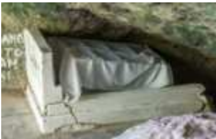
Gambar 7.5. Kuburan Siti Nurbaya

Sitti Nurbaya dipercayai bermakam di Gunung Padang dan banyak wisatawan berkunjung ke makam tersebut. Suasana di lokasi makam ini sedikit agak gelap karena kurangnya cahaya matahari yang masuk. Disamping makam ini, ada lagi cerita yang berkembang di masyarakat yaitu adanya makam lain yang di beri nama kuburan keramat kecil. Siapa yang di kuburkan disana masih anonim, ada yang mengatakan kuburan Syekh tetapi masyarakat meyakini makam tersebut memiliki kisah mistis. Tetapi hal tersebut tidak mempengaruhi para wisatawan, yang pasti mereka kesana untuk menikmati wisatanya. Kuburan ini terletak dekat