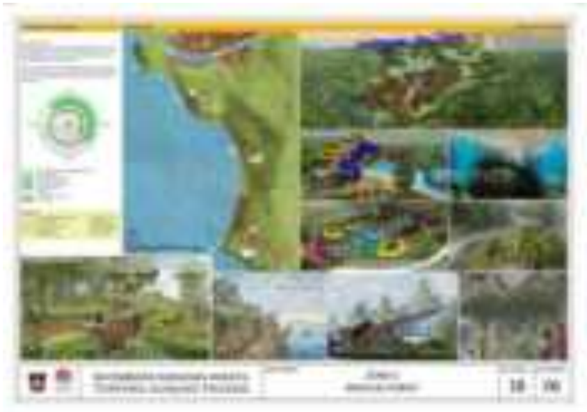
Gambar 7.10. Konsep Kawasan Wisata Terpadu Gunung Padang (Sumber: Foto Dokumentasi dari Dinas Pariwisata dan Kebudayaan Kotamadya Padang -Peta Konsep Perencanaan Pengembangan Kawasan Wisata Terpadu Gunung Padang).

bala; dan 7. Festival kuliner, ekonomi kreatif, seni budaya. Dana untuk pengembangan konsep wisata ini meliputi hotel, resort, dan sarana pendukung kegiatan pariwisata. Ditambahkan lagi bahwa potensi investasi di Kawasan Wisata Terpadu Gunung Padang, kemudian pengembangan wisata di 19 pulau kecil, pembangunan jalan Teluk Kabung, Padang-Mandeh, dan pengembangan pelabuhan Bungus dan Bukit Putus.