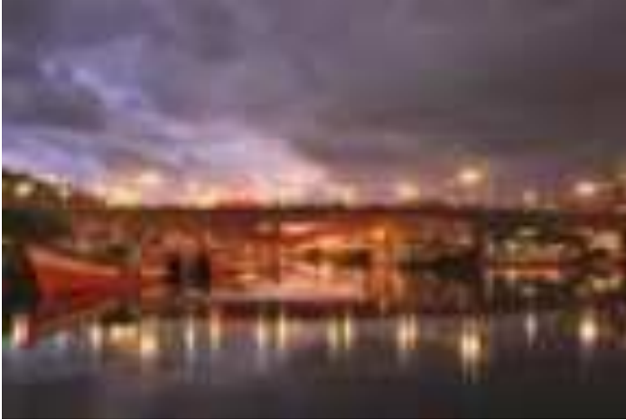
Gambar 6.4 Jembatan Siti Nurbaya

Oleh karena itu pemerintahan Kota Padang pada dahulunya membangun jembatan dengan nama Jembatan Siti Nurbaya. dan jembatan itu langsung terkenal dimana diseborang jembatan merupakan areal perbukittan dan banyak yang membangun rumah dan warung di areal ini. Jembatan Siti Nurbaya ini merupakan pengingat akan cerita Sitti Nurbaya yang melegenda. Jembatan Siti Nurbaya ini terlihat sangat indah terutama ketika melihat pemandangan matahari terbenam. Saat dimana para pedagang kaki lima biasanya akan memenuhi area tersebut dengan barang dagangannya sampai malam hari. Pesona lampu-lampu yang indah terlihat dijembatan ini dan begitu juga Kota Padang yang kelap-kelip. Area di sekitar jembatan akan dipenuhi oleh para penjual makanan yang menawarkan kuliner khas Padang dengan harga yang cukup bersahabat. Pengunjung dapat mencicipi sate Padang, pisang bakar, jagung bakar dan berbagai minuman khas sesuai selera.