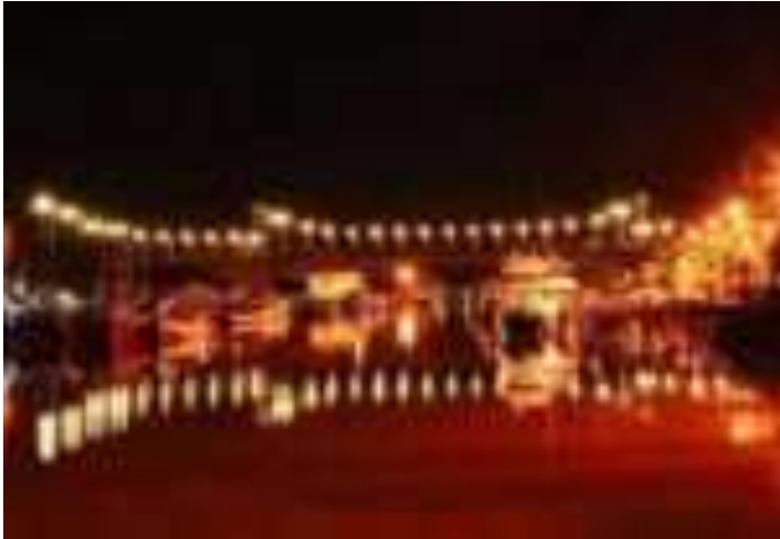
Gambar 2.2. Jembatan Siti Nurbaya pada Malam Hari