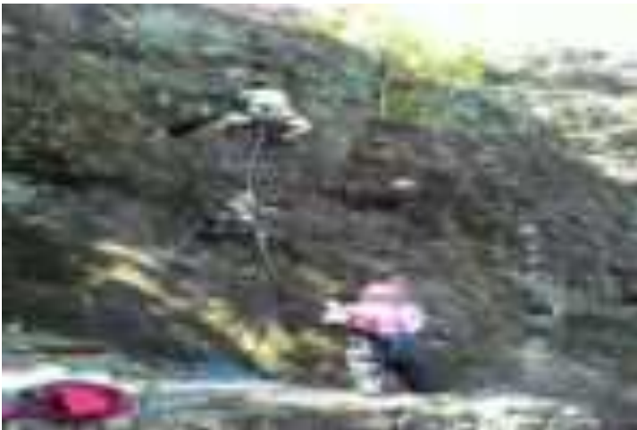
Gambar 3.3. Panjat Tebing di Gunung Padang

Tepat di atas batu yang menaungi Kuburan Siti Nurbaya kita juga bisa melakukan kegiatan seperti Rock Climbing . Ini tentu hanya dimanfaatkan bagi orang-orang yang menyukai tantangan saja. Sebab cukup berbahaya jika dilakukan oleh orang-orang awam yang tidak punya pengalaman. Salah-salah kita akan terjun bebas ke jurang.