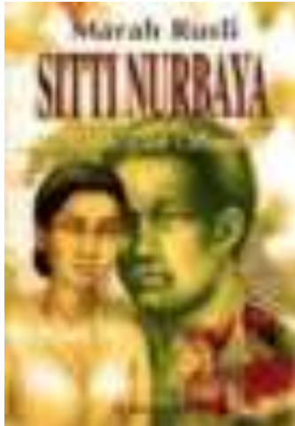
Gambar 1.1. Novel Sitti Nurbaya karya Marah Rusli

Sampai setidaknya tahun 1930, Sitti Nurbaya merupakan salah satu karya yang diterbitkan oleh Balai Pustaka yang paling populer dan sering dipinjam dari perpustakaan. Setelah kemerdekaan Indonesia , Sitti Nurbaya diajarkan sebagai salah satu karya sastra Indonesia klasik. Novel yang disambut baik pada saat penerbitan pertamanya ini sampai sekarang masih dipelajari di sekolah-senantiasa. Sampai tahun 2008, buku ini sudah dicetak ulang 44 kali. Sitti Nurbaya sering dianggap salah satu karya sastra Indonesia yang paling penting, dengan cerita cintanya dibandingkan dengan Romeo and Juliet karya William Shakespeare dan legenda Cina Sampek Engtay . Meskipun begitu, keluarga Marah Rusli tidak menerima novel Sitti Nurbaya dengan baik. Dalam sepucuk surat, ayahnya telah mengutuk Marah Rusli, sehingga dia tidak pernah kembali ke Padang (Foulcher, 2002).