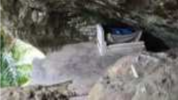
Gambar 4. Makam Siti Nurbaya

Ketiga atraksi ini sudah ada namun belum memperlihatkan perkembangan yang membanggakan. Sayangnya, destinasi ini belum berhasil menarik perhatian turis dalam jumlah besar baik domestik apalagi mancanegara.