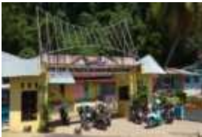
Gambar 3.2. Gerbang Masuk Taman Siti Nurbaya

Berbeda dengan jembatan, Gunung Padang yang memang terdapat dalam novel Sitti Nurbaya , tempat dimana Sitti Nurbaya dan Samsulbahri serta kedua temannya pernah berekreasi ke tempat itu menawarkan keasrian serta keindahan yang berbeda. Menuju ke sana kita tak perlu mengeluarkan kocek yang banyak. Cukup dengan membeli tiket seharga lima ribu perorang di gerbang, lalu berjalan sekitar dua puluh lima menit hingga ke taman di atasnya.