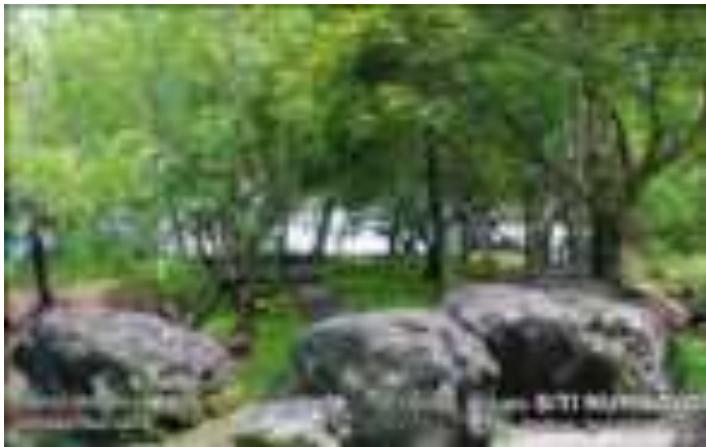
Gambar 3. Taman Siti Nurbaya