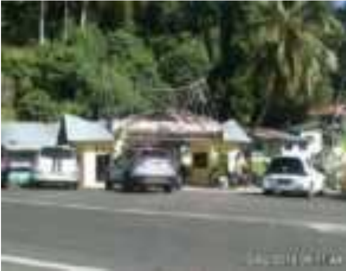
Gambar 10. Gerbang Objek Taman Siti Nurbaya