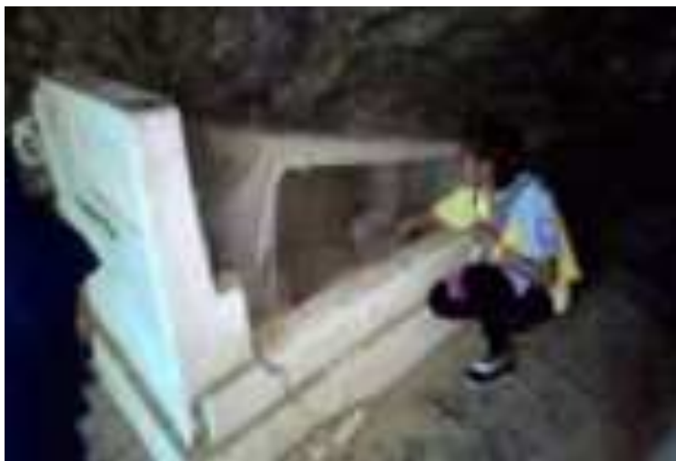
Gambar 2. Kuburan Siti Nurbaya

kering dan berbongkah-bongkah. Pada bagian dalam kuburan terdapat 2 atau 3 kain putih berukuran kecil yang tidak diketahui apa fungsi dari kain tersebut.