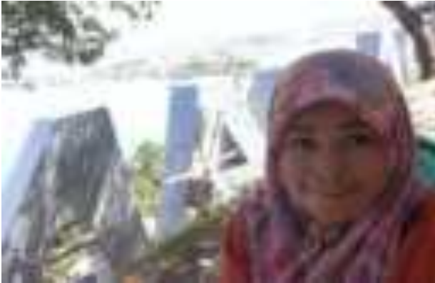
Gambar 5.4. Nama Kota Padang dari Taman Siti Nurbaya