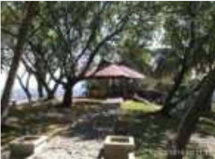
Gambar11. Warung dan Spot Selfie di Taman Siti Nurbaya

Tempat ini merupakan lokasi wisata sastra yang sangat bagus sebagai destinasi di Kota Padang. Perhatian pemerintah dan pengelola terhadap objek pariwisata ini, terutama pada tanda penunjuk informasi dan lokasi masih diharapkan.