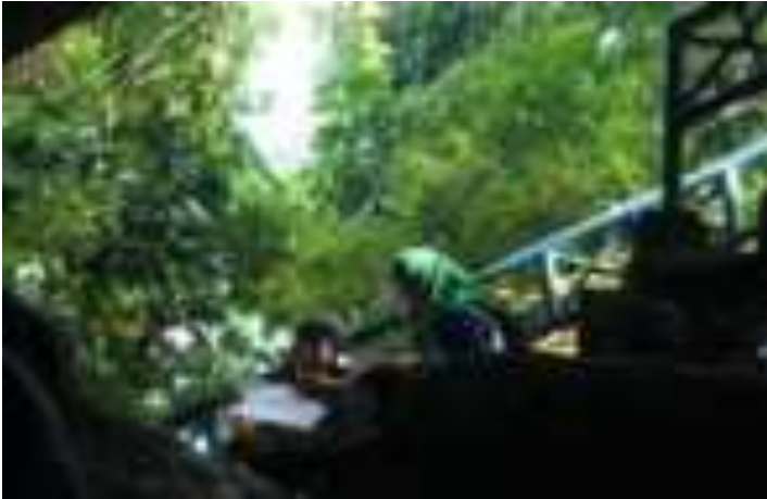
Gambar 9.4. Tangga ke Taman

Kuburan Siti Nurbaya terletak di sebuah gua kecil dan diapit antara dua batu. Jika memasuki area itu akan terasa sedikit menegangkan karena jalannya yang sempit dan terjal. Kawasan kuburan ini juga agak sedikit gelap. Suasana seperti itulah yang memicu adrenalin pengunjung setelah mendaki jenjang sejauh lebih kurang satu kilo meter. Suasana itu juga kemudian yang menarik kembali bagi pengunjung untuk datang lagi. Selain pemandangan di panoramanya yang indah. Seperti terlihat pada foto di bawah ini.