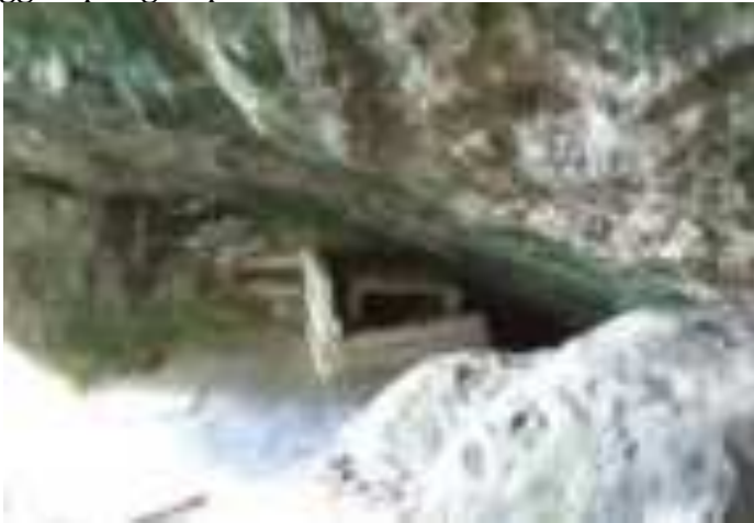
Gambar 3.1. Kuburan Siti Nurbaya

Perbedaan lain yang sangat berbeda dan mencolok adalah fakta mengenai Kuburan Siti Nurbaya. Kuburan Siti Nurbaya terletak di puncak Gunung Padang. Kuburan itu terdapat di dalam gua batu yang diberi tanda di pintu guanya. Tanda tersebut bertuliskan “Makam Siti Nurbaya” lalu diberi tanda panah. Setelah masuk melalui mulut gua dan menuruni beberapa anak tangga yang cukup terjal kita akan melihat kuburan yang diselimuti kain putih dan tanah yang sudah menggumpal-gumpal di atas kuburan tersebut.