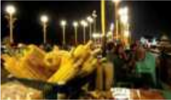
Gambar 8.2. Kuliner dan Pengunjung di Jembatan Siti Nurbaya