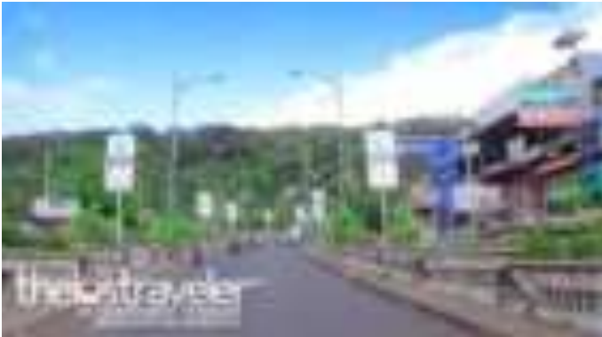
Gambar 8.4. Suasana Jembatan di Pagi Hari

Berubahnya tujuan pengunjung untuk datang ke Jembatan Siti Nurbaya menjadi salah satu faktor mulai tergerusnya Sitti Nurbaya di zaman modern saat ini. Masyarakat kebanyakan mendatangi jembatan ini untuk menikmati suasana malam hari disana, bukan semata-mata tertarik terhadap kisah yang melegenda ini. Sitti Nurbaya yang memiliki pamor yang luar biasa karena ditulis pengarang Balai Pustaka menjadi daya tarik yang tidak terelakan dari lokasi wisata ini. Sitti Nurbaya bagi jembatan ini hanya terkesan sebagai alat untuk menciptakan ikon wisata kota Padang. Penggaungan kisah roman Sitti Nurbaya dengan jembatan ini sepertinya tidak memiliki kekuatan lagi. Sitti Nurbaya tetap di ceritakan sesuai legenda yang melegenda, tapi sayangnya Sitti Nurbaya hanya menjadi nama di jembatan ini dimana pengunjung tidak tahu bagaimana kisah Sitti Nurbaya secara utuh. Sitti Nurbaya zaman modern ini tinggal nama tergerus oleh zaman, pudar oleh waktu sehingga Sitti Nurbaya hanya tinggal kisah yang melegenda.