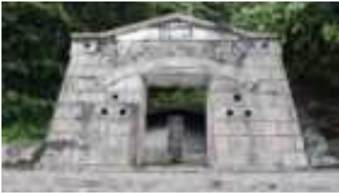
Gambar 7.6. Benteng di Gunung Padang