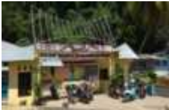
Gambar 8.5. Gerbang Objek Wisata Gunung Padang

Letaknya berada di seberang selatan dari muara Sungai Batang Arau dan termasuk dalam wilayah Kecamatan Padang Selatan. Sebuah bukit kecil dengan ketinggian puncak sekitar 80 meter di atas permukaan laut. Masyarakat Kota Padang menamainya Gunung Padang karena bukit ini bisa dikatakan tempat tertinggi di sekitar pusat kota yang terkenal dengan kuliner rendang sebagai andalannya ini. Gunung Padang menyimpan kombinasi antara panorama yang indah, legenda cinta, dan sepenggal sejarah masa pendudukan Jepang.