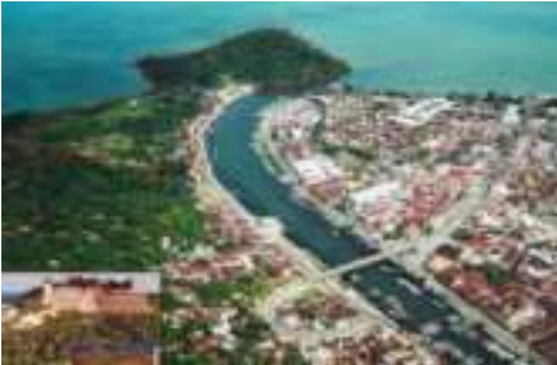
Gambar 2.1. Jembatan Siti Nurbaya dari Udara

Berdasarkan cerita Sitti Nurbaya , Padang mempunyai warisan yang bisa ditawarkan kepada penikmat cerita ini dalam bentuk atraksi yang kalau dikembangkan akan bisa menjadi ikon kota ini. Setidaknya Padang bisa menawarkan beberapa atraksi: Jembatan Siti Nurbaya (gambar 1 dan 2), Taman Siti Nurbaya (gambar 3) and Makam Siti Nurbaya (gambar 4).