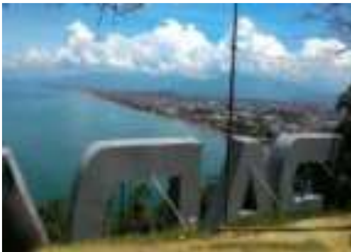
Gambar 3.4. Ikon Kota Padang dari Gunung Padang