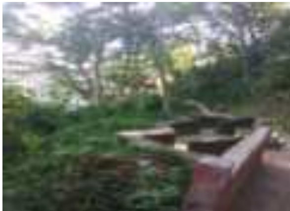
Gambar 5.9. Tempat Duduk Sebelum Taman Siti Nurbaya