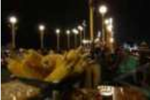
Gambar 6.5. Kuliner Jagung di Malam Hari

Selain Jembatan Siti Nurbaya, pesona kota Padang yang lainnya adalah bangunan-bangunan tua zaman Belanda di sekitar jembatan. Mulai dari jalan Pondok, Niaga, Kelenteng hingga jalan Batang Arau di dekat jembatan merupakan kawasan kota tua Padang. Kaum pendatang seperti Tionghoa, Nias, Mentawai dan Batak banyak bermukim disini.