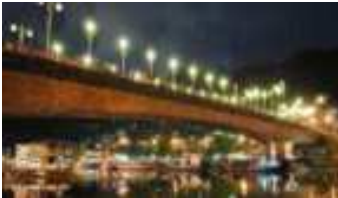
Gambar 7.1. Jembatan Siti Nurbaya di Malam Hari

identitas arsitektur Minangkabau. Dulu sebelum adanya jembatan ini, masyarakat menggunakan sampan sebagai alat transportasi untuk menyeberang menuju pusat kota. Setelah dibangunnya jembatan ini segalanya jauh lebih mudah. Dengan tujuan untuk meningkatkan sarana dan prasarana transportasi regional melalui Kota Padang kearah Teluk Bayur serta pembangunan Kawasan Wisata Gunung Padang. Jembatan Siti Nurbaya di rancang dan di bangun dengan kontruksi modern menggunakan sistem Beton Pratekan Tipe Gelagar Box. Tidak ada bentuk kekakuan dalam gaya bangunannya, karena di kerjakan dengan sistem sabuk geser atau yang biasa di kenal dengan paraweb (Devy dan Soemanto, 2017).