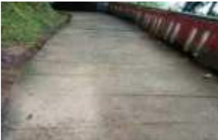
Gambar 7.3. Jalan Menuju Taman Siti Nurbaya