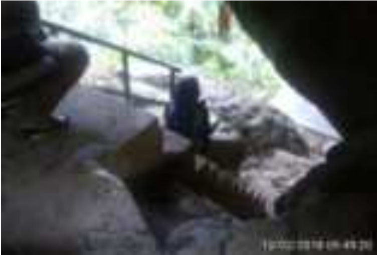
Gambar 5.7. Tangga Menuju Kuburan Siti Nurbaya