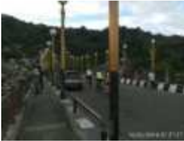
Gambar 5.8. Jembatan Siti Nurbaya

mereka melanjutkan perjalanan menuju Taman Siti Nurbaya. Disamping itu, pedagang yang berjualan di jembatan ini, menurut pengunjung, perlu menawarkan kuliner khas Padang.