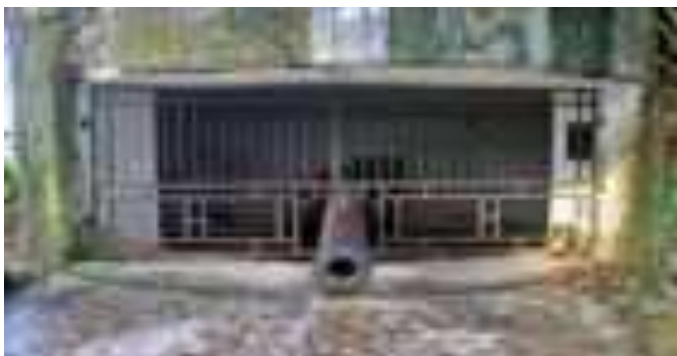
Gambar 7.7. Meriam di Gunung Padang