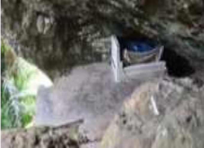
Gambar 8.7. Makam Siti Nurbaya

Diakhir perjalanan di puncak Gunung Padang, kita akan menemukan pemandangan kota Padang yang dihiasi pohon-pohon rindang sehingga meski cuaca panas sekalipun bisa membuat pengunjung untuk bersantai dan menikmati pemandangan kota padang yang indah. Di sebelah utara dan timur, terhampar pemandangan Kota Padang dan Jembatan Siti Nurbaya dari kejauhan. Bergerak sedikit ke selatan, kita akan melihat hamparan Pantai Air Manis beserta Pulau Pisang Kecil dan Pulau Pisang Besar. Sementara, di sisi barat, terhampar bentangan luas dan birunya Samudera Hindia yang akan terlihat indah ketika hari menjelang senja.