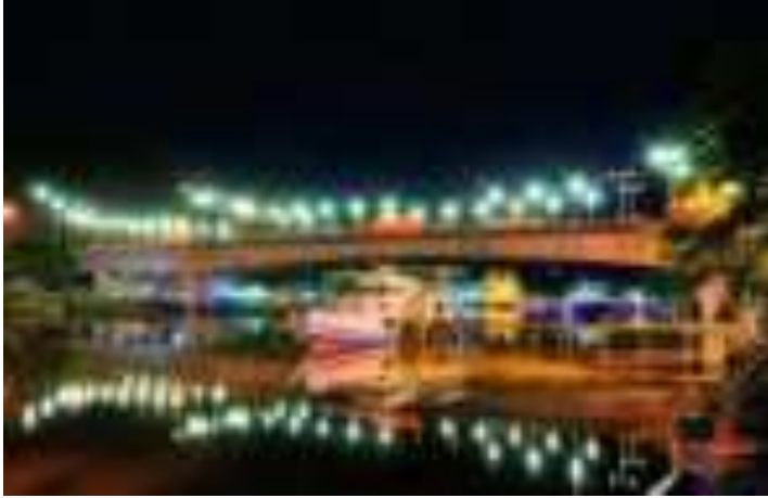
Gambar 8.1. Jembatan Siti Nurbaya Malam Hari

Jembatan ini berfungsi sebagai penghubung menuju Taman Siti Nurbaya. Jembatan ini dilengkapi lampu-lampu yang indah di malam hari, sehingga memiliki pemandangan yang cantik dan dijadikan salah satu tempat kuliner yang menjajakan jagung bakar dan sering didatangi muda-muda dan keluarga untuk sekedar duduk-duduk bersantai menikmati waktu. Data dari kuisioner yang diberikan kepada pengunjung memperlihatkan bahwa pengunjung yang datang disana tidak semuanya tahu bagaimana cerita lengkap Sitti Nurbaya , yang mereka tahu hanyalah cerita dari mulut ke mulut yang beredar dan banyak yang tidak membaca langsung karya sastra nya Sitti Nurbaya oleh Marah Rusli.