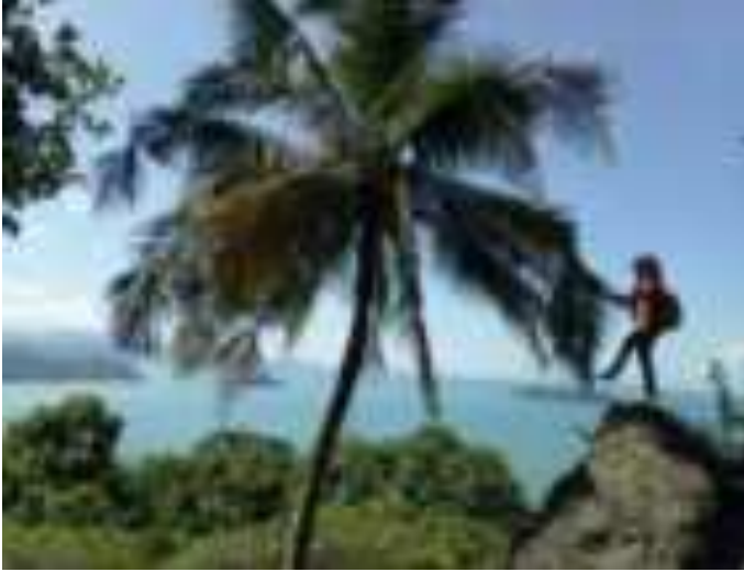
Gambar 5.6: Di Puncak Gunung Padang