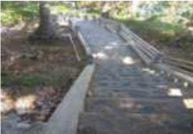
Gambar 5.3. Tangga Menuju Taman Siti Nurbaya

Taman ini sepertinya memerlukan penentuan visi misi yang jelas supaya bisa dikembangkan dengan tepat. Kalau taman ini ditujukan untuk menjadi taman buatan, pengelola perlu penataan lebih jauh disamping keberadaan alamnya. Untuk hal ini, taman ini membutuhkan penataan struktur taman termasuk penyediaan bunga. Walaupun sejuk dan pengunjung bisa memandang ke arah pantai Padang dan pantai Air Manis, taman ini memerlukan nuansa yang asri dan indah bagi para pengunjung untuk bisa selfi moment .