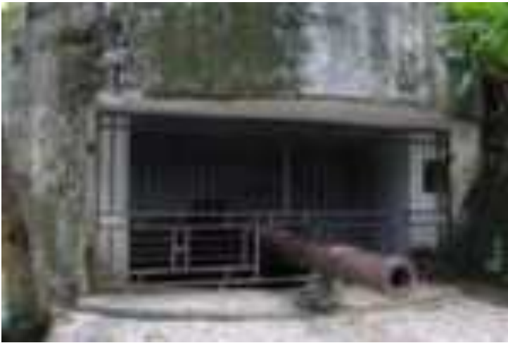
Gambar 8.6. Meriam di Gunung Padang

Dari gerbang, kita akan menyusuri jalan setapak menanjak hingga ke puncak, kurang lebih bisa memakan waktu 15-30 menit perjalanan. Disepanjang jalan sebelah kiri, kita bisa menemukan bunker-bunker dan meriam sisa-sisa peninggalan masa pendudukan Jepang. Sebelum menuju puncak, kita akan menemukan disebelah kanan sebuah lorong dan terdapat makam yang dipercayai itu adalah Makam Siti Nurbaya.