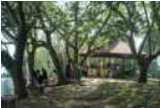
Gambar 9.2. Taman Siti Nurbaya

Jembatan Siti Nurbaya membentang dari Padang Kota Tua ke kawasan Muaro. Menghubungkan dua kawasan, sekaligus memperlancar arus lalu-lintas masyarakat lereng Gunung Padang dan masyarakat Kota Padang khususnya, terutama masyarakat Padang Kota Tua. Jembatan ini juga mempermudah para wisatawan menuju Gunung Padang.