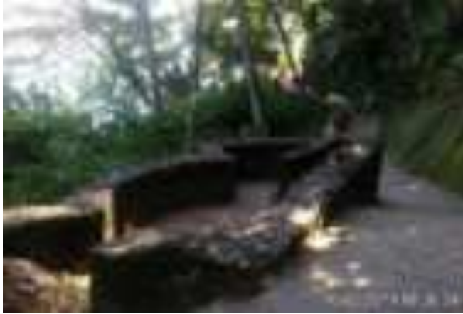
Gambar 4. Tempat Sitti Nurbaya dan Samsulbahri Bertemu

Dalam novel Sitti Nurbaya yang menggunakan pantun dalam beberapa penceritaan, terdapat pantun yang menceritakan media tentang perasaan Sitti Nurbaya dan Samsulbahri, seperti di bawah ini: