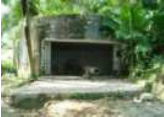
Gambar 4.5. Meriam Pertahanan Perang

Bukit atau Gunung Padang ini merupakan basis pertahanan tentara Jepang yang mengawasi datangnya musuh dari arah Barat. Meriam serta bunker khas tentara Jepang dapat ditemukan di sini.