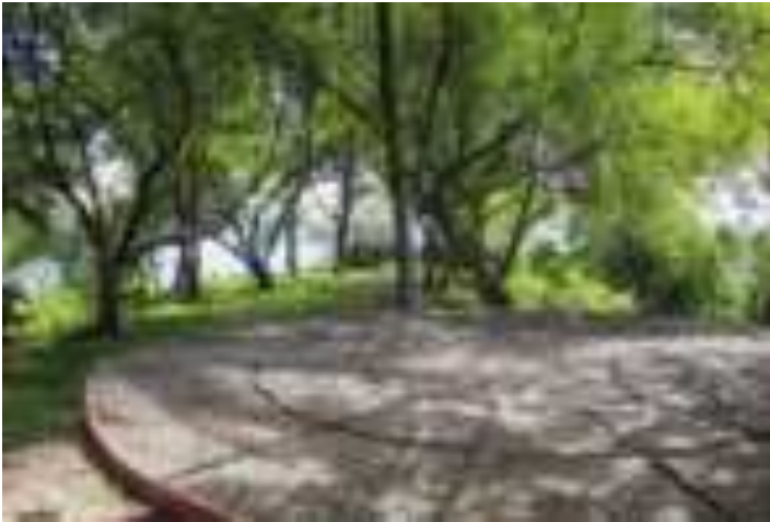
Gambar 4.10. Pentas Terbuka Taman Siti Nurbaya

Marah Rusli. Sama halnya dengan objek sebelumnya, ditempat ini juga tidak terdapat tanda penunjuk arah dan informasi tentang taman tersebut.