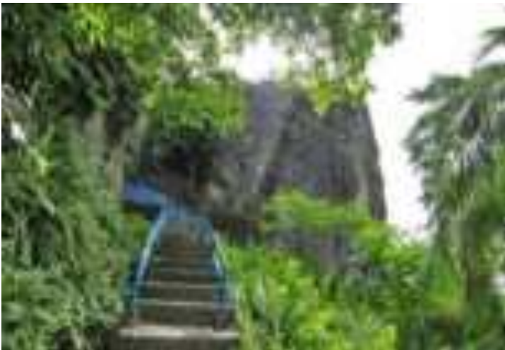
Gambar 6.2. Jalan Menuju Makam Siti Nurbaya

Sebelum sampai ke Taman dan Makam Siti Nurbaya, wisatawan dapat melewati Jembatan Siti Nurbaya yang mempesona mata pegunjung selain bersejarah tentunya. Pemerintah membangun jembatan yang menghubungkan Gunung Padang dan kota Padang kemudian menamainya sesuai judul roman yang legendaris itu, yaitu Jembatan Siti Nurbaya, sebagai bentuk penghargaan kepada penulisnya. Jembatan Siti Nurbaya ini banyak dikunjungi wisatawan. Jika berkunjung ke Padang rasanya tidak lengkap jika tidak menikmati keindahan kota Padang tanpa mengunjungi Jembatan Siti Nurbaya