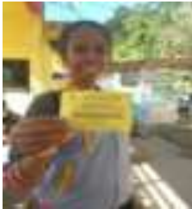
Gambar 5.1. Karcis Masuk ke Gunung Padang

tidak dikelola dengan baik. Pengunjung membayar biaya parkir ketika akan meninggalkan lokasi. Pada akhir pekan, khususnya pagi hari, pengunjung seringkali susah mendapatkan tempat untuk parkir karena terbatasnya lahan dan tidak adanya petugas yang benar-benar mengatur perparkiran.