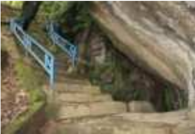
Gambar 4.6. Tempat Masuk Kuburan Siti Nurbaya

Cerita Sitti Nurbaya merupakan kisah yang sangat dikenal oleh warga Padang. Saking fenomenalnya cerita roman itu, hingga hari ini masyarakat sekitar Gunung Padang, Kota Padang, Sumatera Barat, mempercayai kisah fiktif atau rekaan itu sungguh-sungguh terjadi dan nyata. Konon, di Gunung Padang itu diyakini ada kuburan tokoh malang Sitti Nurbaya, yang tewas diracun oleh orang suruhan Datuk Meringgih, berada di puncak bukit itu. Sama seperti objek wisata sastra Siti Nurbaya sebelumnya, tidak terdapat tanda petunjuk di lokasi ini.