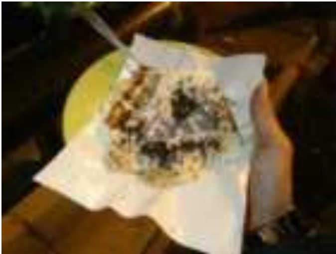
Gambar 10.3. Kuliner Pisang Bakar

Banyak yang menjadikan tempat ini sebagai tempat lari pagi karena lalu lintas yang cukup sepi dan memungkinkan untuk beraktifitas yang berhubungan dengan olahraga.