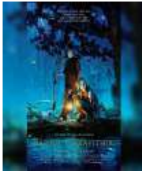
Photo: Theatrical Poster

Film Bridge to Terabithia merupakan film yang diadaptasi dari sebuah novel dengan judul serupa yang ditulis oleh Katherine Paterson yang telah diterbitkan pada tahun 1977. Bridge to Terabithia ini merupakan film bergenre fiksi dan fantasi yang disutradarai oleh Gabor Csupo yang resmi dirilis pada tahun 2007, menceritakan tentang petualangan dan persahabatan antara Jess Aarons yang diperankan oleh Josh Hutcherson dan Leslie Burke yang diperankan oleh Anna Sophia Robb.