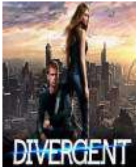
Poster Film Divergent

Divergent merupakan sebuah novel yang ditulis oleh Veronica Roth. Novel ini terbit pada tahun 2011 dan bertempat di Chicago. Tema umum novel ini berkaitan dengan anak remaja, seperti otoritas orang dewasa dan transisi (perpindahan) dari masa anak-anak ke masa dewasa, serta motif yang lebih luas seperti tempat kekerasan dan struktur sosial dalam masyarakat. Novel ini bercerita tentang orang-orang yang dibagi menjadi lima faksi, diantaranya Abnegation (yang tidak mementingkan diri sendiri), Amity (yang damai), Candor