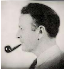
Foto Raymond Thornton Chandler

Raymond Thornton Chandler atau yang biasa dikenal sebagai Raymond Chandler adalah seorang penulis dan screenwriter British-Amerika, yang sangat terkenal dengan karangannya yang bergenre “Detective Fiction.” Raymond Chandler adalah ayah dari novel detektif yang menceritakan tentang Private Detective yang bernama Philip Marlowe yang ia gambarkan sebagai penagak cita-cita orang miskin yang jujur dalam masyarakat. Chandler membuat tujuh novel yang pemeran utamanya adalah Philip Marlowe, jadi bisa dikatakan Chandler membuat cerita Detektif ini