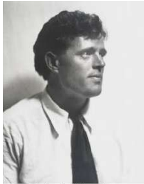
Foto Jack London

Jack London merupakan salah satu penulis Amerika yang banyak mengangkat karakter utamanya dari hewan. Hewan liar maupun hewan jinak kerap kali diangkat menjadi sebuah cerita yang mengagumkan. Kalau cerita “Si Kancil” di Indonesia, mengajarkan kita tentang kecerdikan, salah satu karya terbaik Jack London yaitu The Call of the Wild mengajarkan kita untuk pantang menyerah dan berjuang untuk hidup. Walaupun diperankan oleh binatang, banyak pesan moral dan nilai-nilai yang bisa kita maknai dalam kehidupan kita.