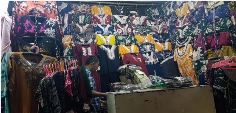
Daster Pak Makmur

SEJAK terjadinya pandemi Covid-19, perekonomian masyarakat mengalami penurunan salah satunya menurunnya pendapatan dan minat daya beli, beberapa pengusaha terpaksa gulung tikar karena tidak cukupnya modal untuk membangun usahanya kembali.