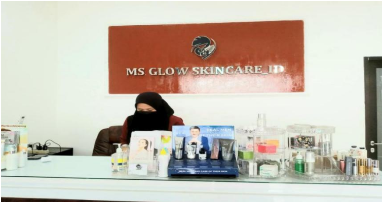
MS Glow Skincare, Depok

Produk skincare sudah menjadi kebutuhan kaum hawa, tak terkecuali di Indonesia dengan penduduk lebih dari 250 juta jiwa. Berbagai merek beredar di pasaran untuk memenuhi kebutuhan tersebut. Produk lokal dan produk impor bersaing. Strategi pemasaran masing-masing perusahaan juga beraneka ragam untuk