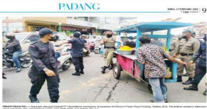
PERHENTIAN PKL — Sejumlah pedagang Satpol PP menahan pedagang di kawasan Air Mancur Pasar Raya Padang, Sabtu (16/1). Perhentian tersebut dilakukan untuk koordinasi dan pengendalian sosial agar tidak terjadi dua hal di satu lokasi.

PADANG, HALIAN — Badut-badut Polio, Palang, orang-orang lain yang hadir dalam acara vaksinasi massal Covid-19 yang akan dilaksanakan di Taman Al-Salam, Padang, dan Taman Sejahtera, Kecamatan Padang Utara pada Sabtu (17/1/2022). Badut-badut Polio, Palang, dan orang-orang lain yang hadir dalam acara vaksinasi massal Covid-19 yang akan dilaksanakan di Taman Al-Salam, Padang, dan Taman Sejahtera, Kecamatan Padang Utara pada Sabtu (17/1/2022).