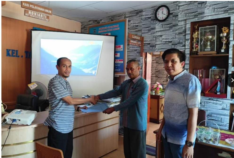
Foto 7. Penyerahan Website secara simbolis