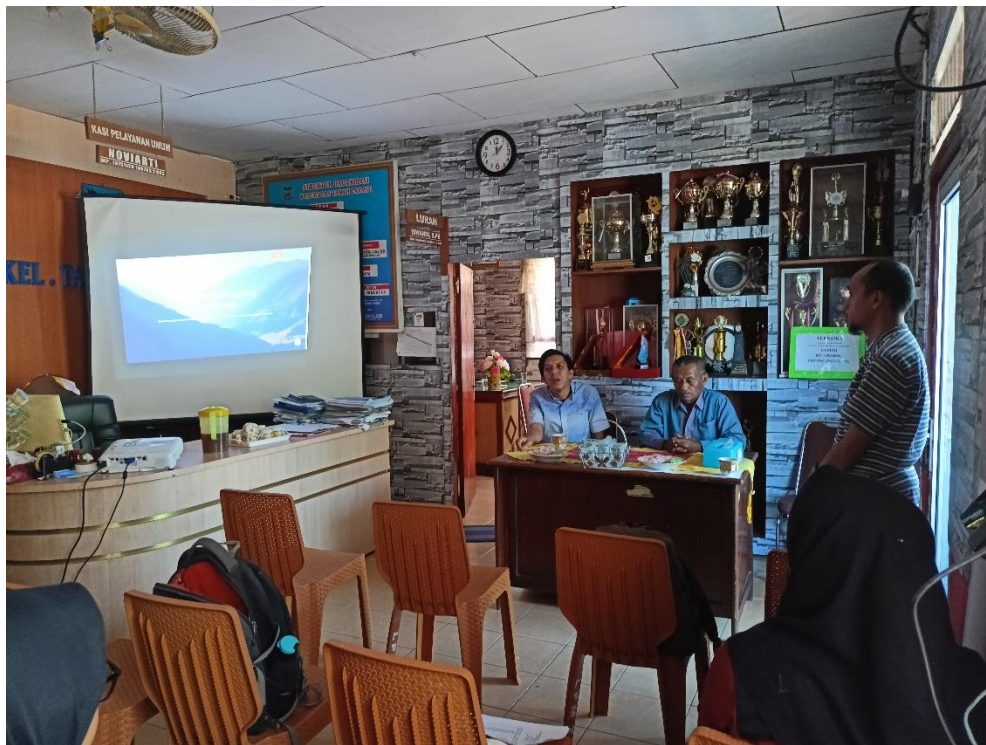
Foto 6. Kata Sambutan dari Kaprodi Sistem Informasi