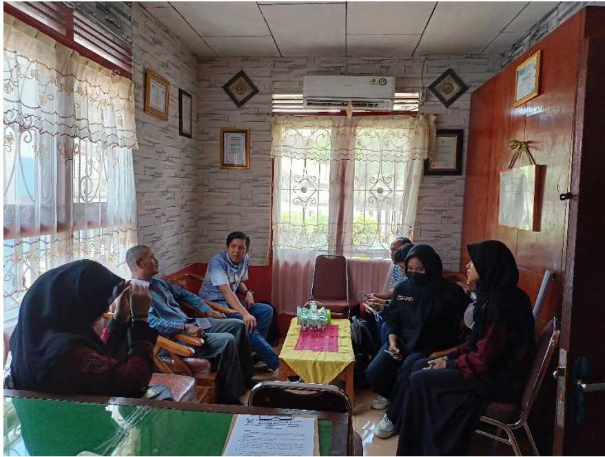
Foto 3. Perbincangan antara tim pengabdian dengan pihak kelurahan terkait persiapan sosialisasi website