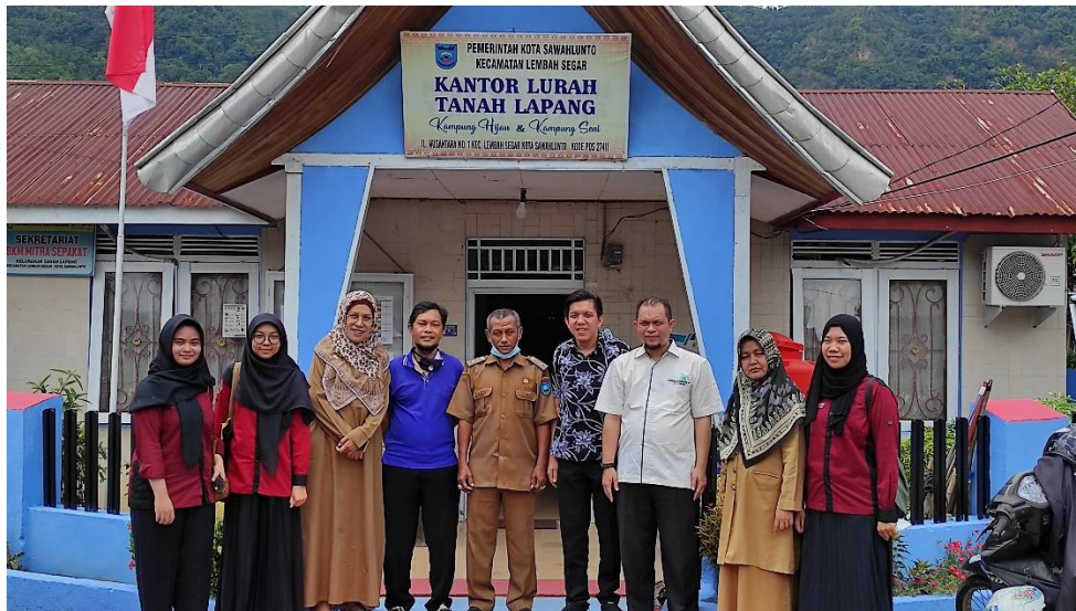
Foto 2. Foto bersama di depan kantor lurah Tanah lapang