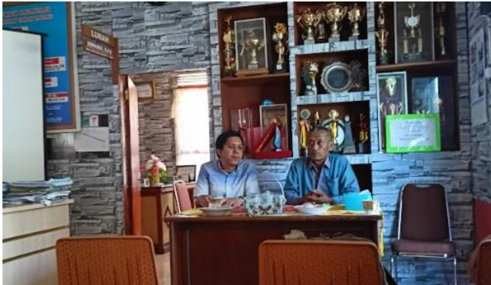
Foto 5. Kata sambutan dari Pak Lurah