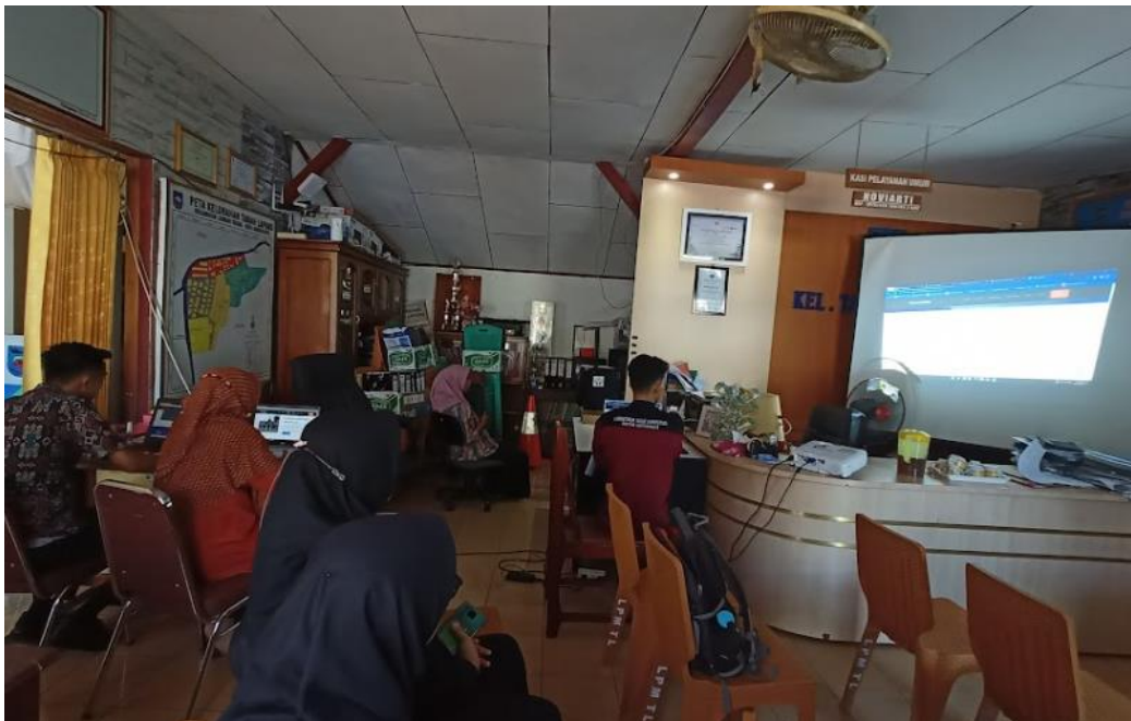
Foto 8. Suasana Sosialisasi