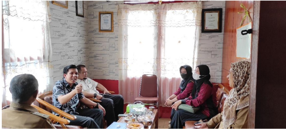
Foto 1. Perbincangan antara tim pengabdian kepada masyarakat dengan pihak kelurahan