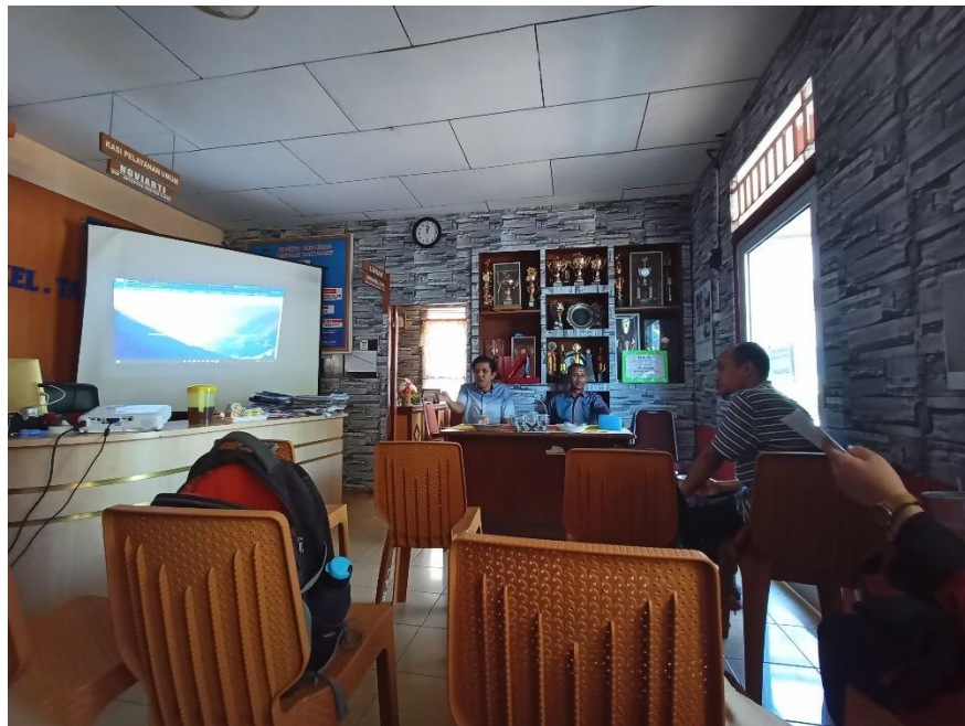
Foto 4. Pembukaan Acara Sosialisasi oleh Ketua Pelaksana Pengabdian Kepada Masyarakat