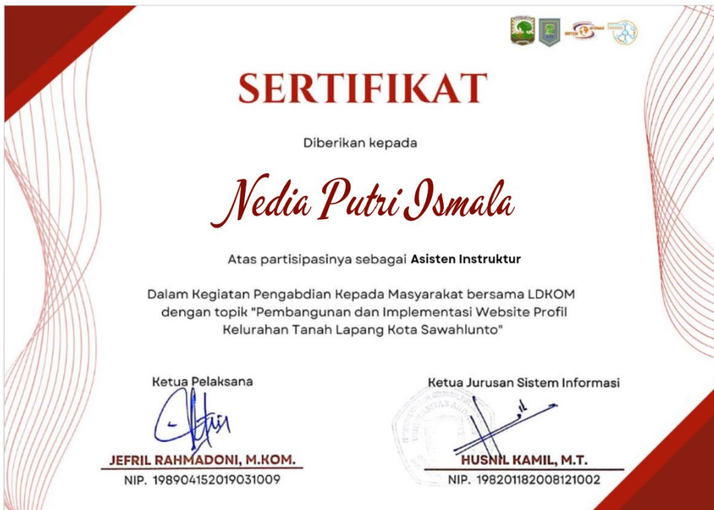
Foto 10. Sertifikat untuk Assistant Instruktur