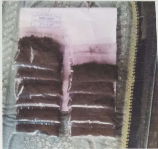
b. Bubuk Kopi Hasil Produksi