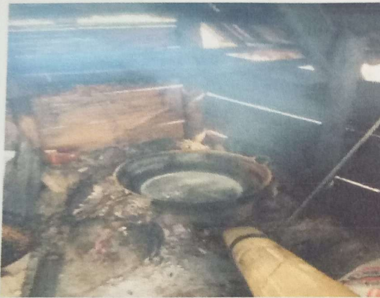
c. Proses Pengolahan Gula Aren