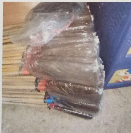
e. Kerajinan Sapu Ijuk