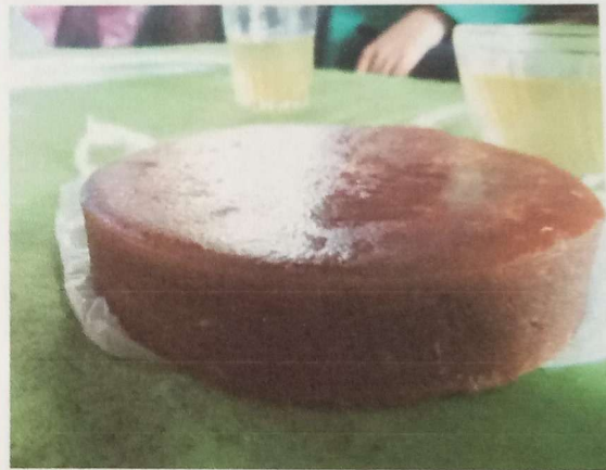
d. Gula Aren Asli Nagari Sinuruik