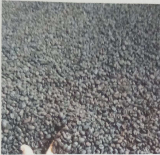
a. Biji kopi setelah di sangrai