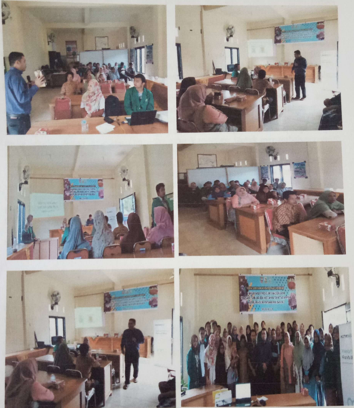
Gambar 2. Foto Bersama dengan Kelompok UMKM Nagari Sinuruik

Berikut kegiatan pelatihan dan workshop dari tim pengabdian masyarakat ke pelaku UMKM di Nagari Sinuruik.