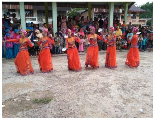
Tradisi anak Nagari Kambang Utara