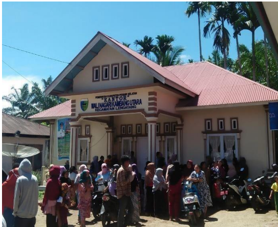
Kantor Wali Nagari Kambang Utara