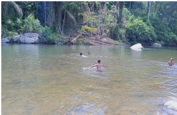
Sungai di Nagari Kambang Utara