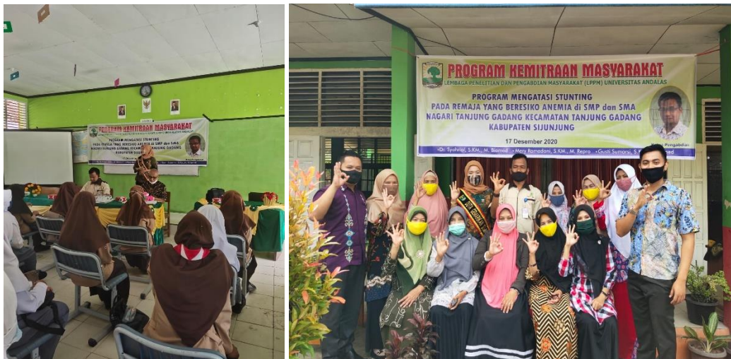
Gambar 5. Penyuluhan tambahan dari Duta Gemarikan Provinsi Sumatera Barat