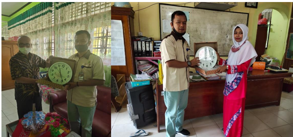
Gambar 9. Penyerahan Cindramata Kepada Kepala Sekolah SMPN 5 Sijunjung dan SMAN 3 Sijunjung.