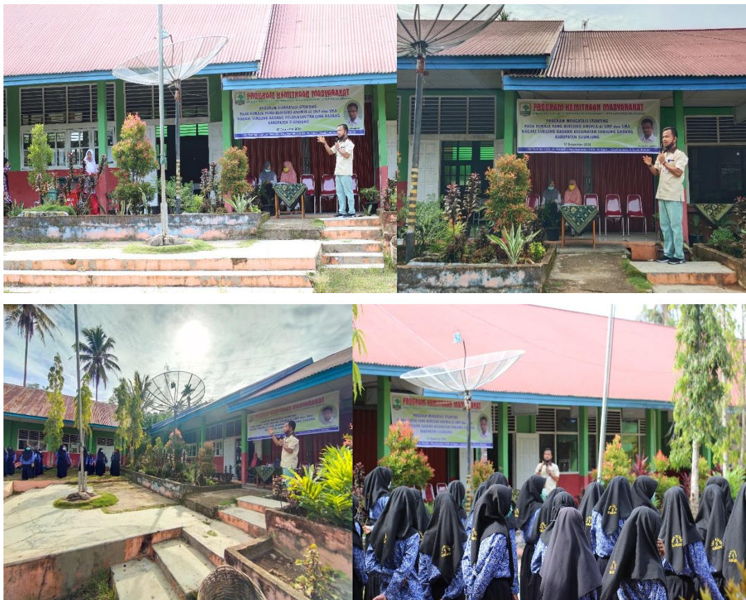
Gambar 3. Proses Penyuluhan di SMPN 5 Sijunjung Nagari Tanjung Gadang