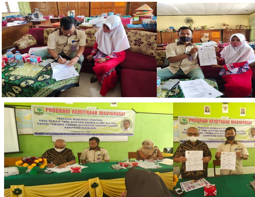
Gambar 7. Penandatanganan Kontrak Kerjasama dengan SMPN 5 dan SMAN 3 Sijunjung