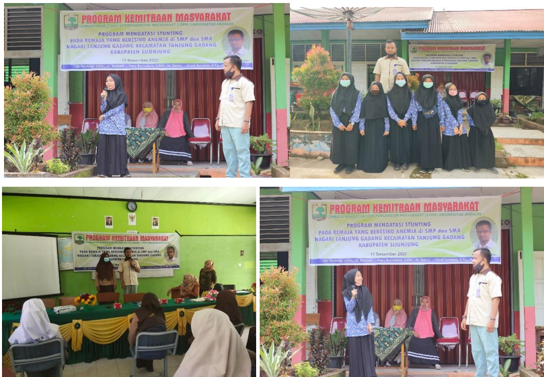
Gambar 6. Sesi Tanya Jawab dengan Peserta Penyuluhan Stunting dan Anemia