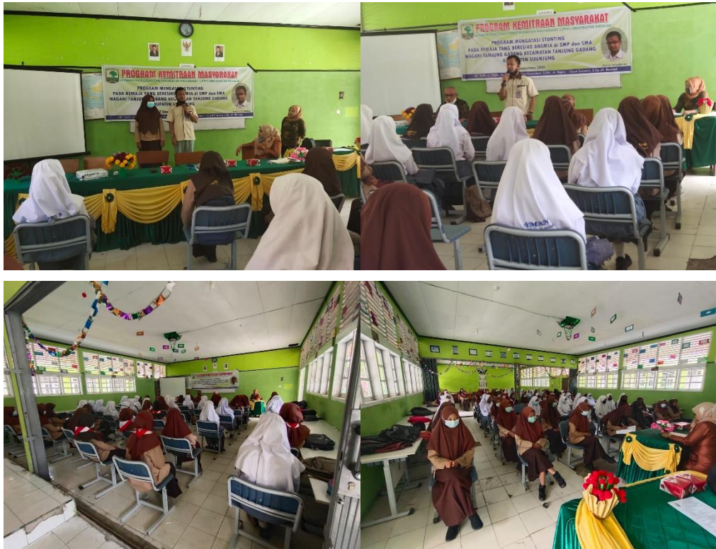
Gambar 4. Proses Penyuluhan di SMAN 3 Sijunjung Nagari Tanjung Gadang