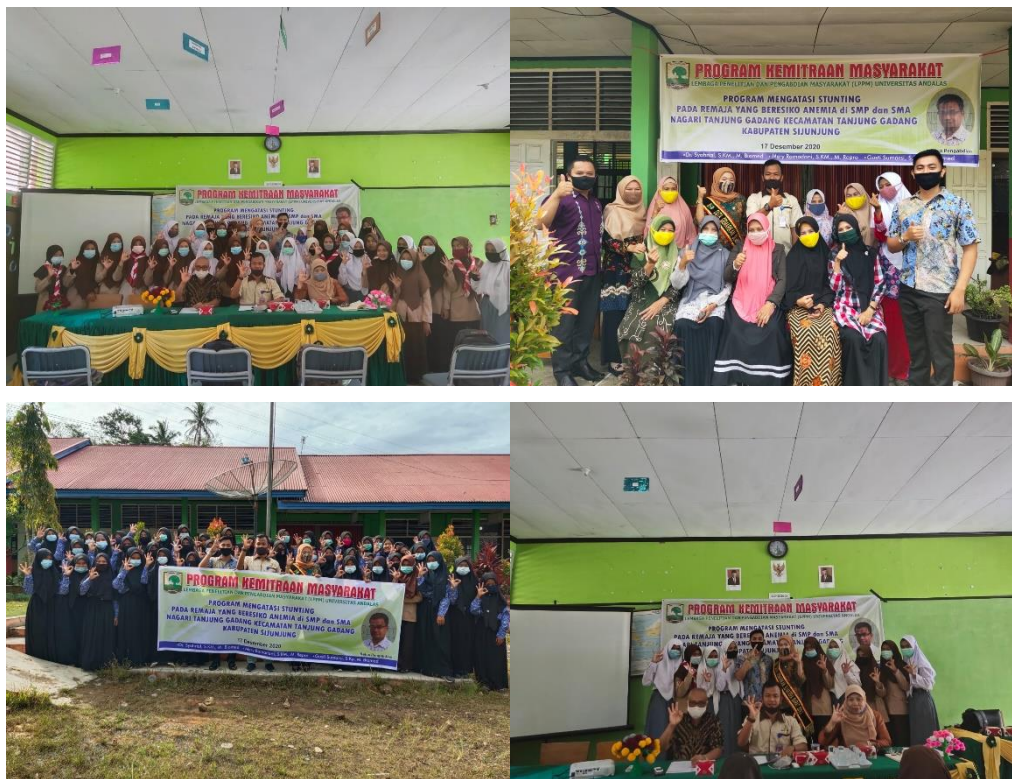
Gambar 9. Foto Bersama Peserta Penyuluhan di SMPN 5 Sijunjung dan SMAN 3 Sijunjung.

d. Foto bersama dengan peserta penyuluhan.