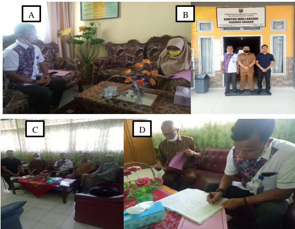
Gambar 2. (A) Bersama Kelapa Sekolah SMPN 5 Sijunjung (B) Bersama Wali Nagari Tanjung Gadang, (C&D) Bersama Kepala Sekolah SMAN 3 Sijunjung