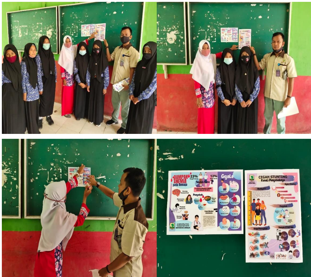
Gambar 8. Penempelan Posten Anemia di Stunting di SMPN 5 dan SMAN 3 Sijunjung