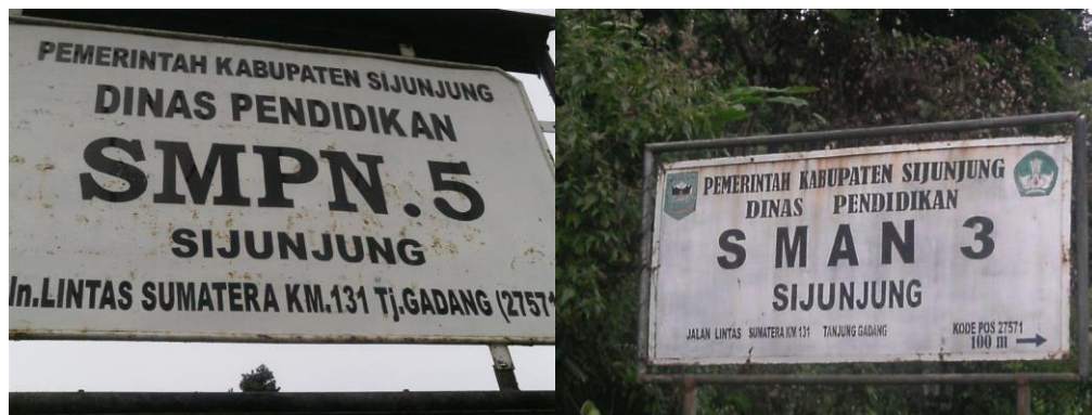
Gambar 1. SMPN 5 Sijunjung dan SMAN 3 Sijunjung

Sekolah kedua yaitu SMA N 3 Sijunjung berada di Jl. Lintas Sumatera KM 131 Tanjung Gadang Kabupaten Sijunjung yang terletak tidak jauh dari SMP N 5 Sijunjung berjarak sekitar \pm 300 m. Siswa SMA N 3 Sijunjung adalah sebanyak 78 siswa laki-laki dan 222 siswa perempuan yang terdiri dari 3 angkatan yaitu Angkatan kelas X, XI, dan XII. Jumlah guru PNS di SMA N 3 Sijunjung adalah sebanyak 21 orang guru. Adapun Nomor pokok sekolah nasional (NPSN) untuk SMAN 3 SIJUNJUNG ini adalah 10302821. Sekolah ini menyediakan berbagai fasilitas penunjang pendidikan bagi anak didiknya. Terdapat guru-guru dengan kualitas terbaik yang kompeten dibidangnya, kegiatan penunjang pembelajaran seperti ekstrakurikuler (ekskul), organisasi siswa, komunitas belajar, tim olahraga, dan perpustakaan sehingga siswa dapat belajar secara maksimal. Proses belajar dibuat seaman mungkin bagi murid dan siswa.