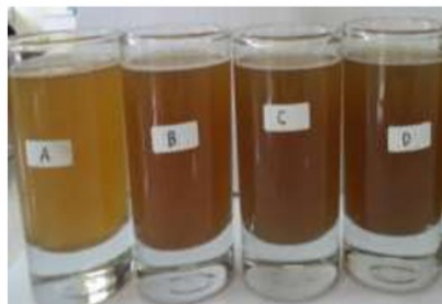
Gambar 2. Seduhan Minuman Serbuk Instan Meniran dengan Penambahan Ekstrak Akar (A), Ekstrak Batang (B), Ekstrak Daun (C), Ekstrak Tumbuhan (D)

Warna yang dihasilkan dari minuman serbuk instan adalah dari warna kuning pucat hingga kuning kecoklatan (Gambar 2), hal ini disebabkan oleh bahan baku yaitu ekstrak meniran berwarna hijau kekuningan dan juga warna dari ekstrak cassia vera berwarna kuning yang apabila dikombinasikan akan berubah jadi kuning kecoklatan. Kesukaan terhadap warna merupakan penilaian yang akan menentukan kesukaan panelis terhadap suatu produk. Bahan pangan yang kurang menarik akan kurang disukai oleh konsumen (Setyaningsih et al , 2010).