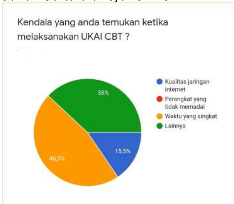
Gambar 3. Kendala Selama Melaksanakan Ujian