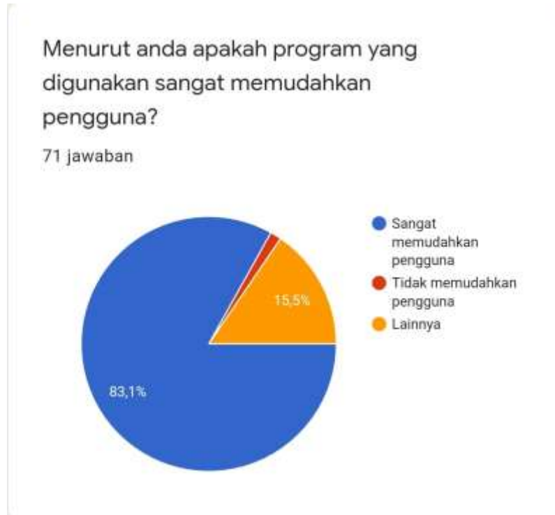
Gambar 4. Program Aplikasi CBT

Pada diagram disamping adalah persepsi mahasiswa terhadap program aplikasi UKAI CBT. Dari data tersebut dapat kita ketahui bahwa mayoritas responden 83,1% menyatakan bahwa program aplikasi UKAI CBT sangat memudahkan pengguna dan kecil dari 2% peserta ujian menyatakan program aplikasi UKAI CBT tidak memudahkan pengguna.