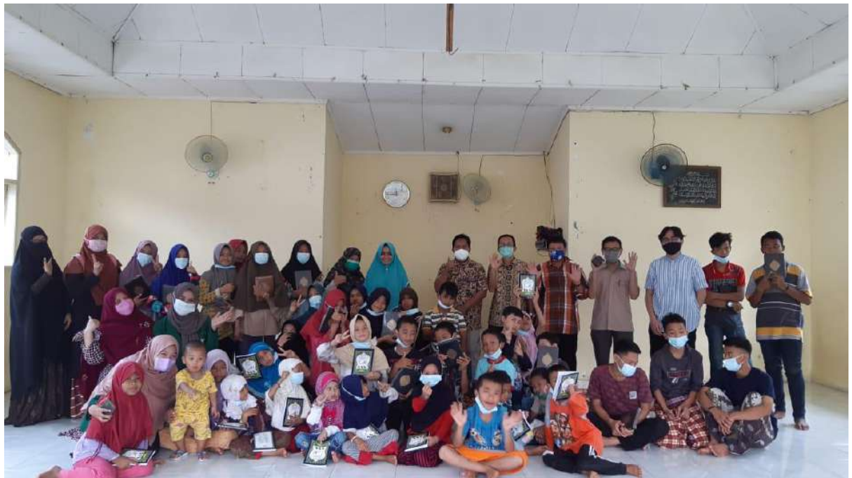
Gambar 4. Foto Bersama Anak Asuh dan Tim Pengabdian