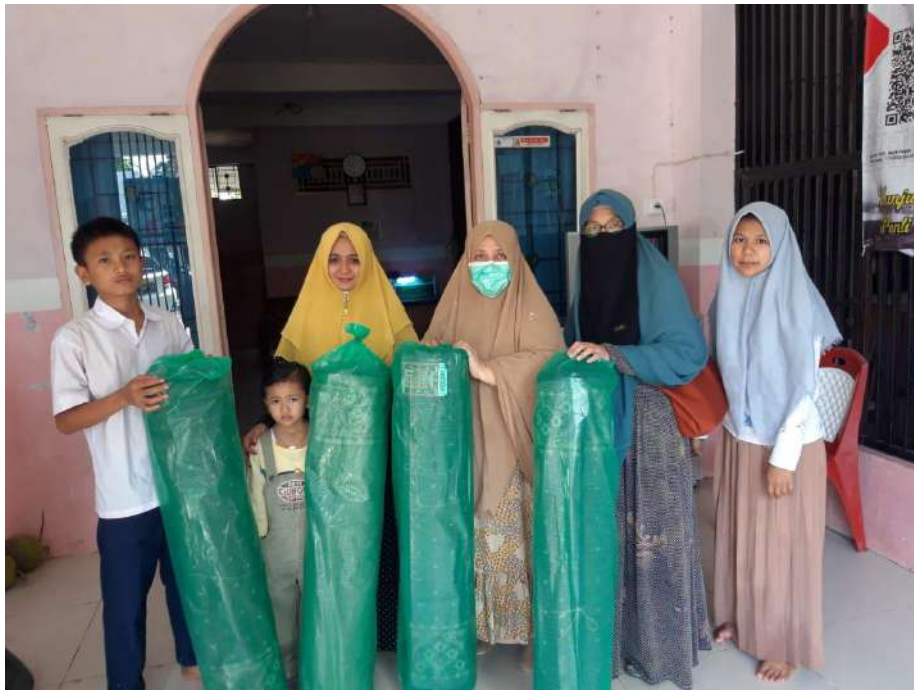
Gambar 3. Pemberian Bantuan Karpet Sholat