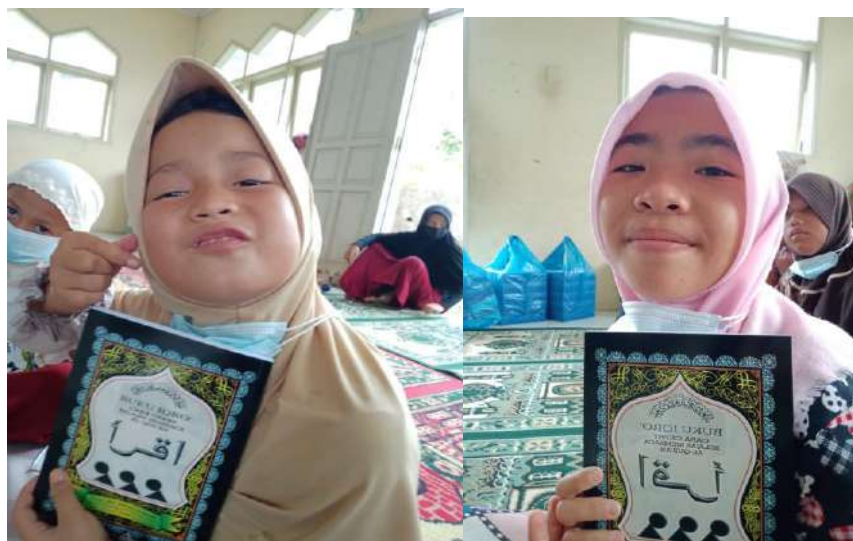
Gambar 2. Pemberian Bantuan Alquran dan Iqra'

Pemberian bantuan ini dimaksudkan untuk menyediakan fasilitas ibadah siswa sehingga siswa lebih bersemangat dalam belajar dan terutama dalam menjalankan ibadah di Bulan Ramadhan.