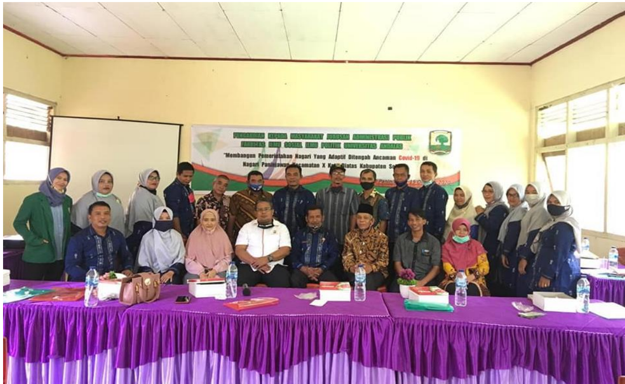
Foto Penyampaian Materi Oleh Tim