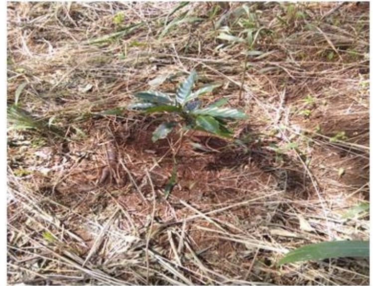
Mengunjungi perkebunan kopi milik BUMNAG