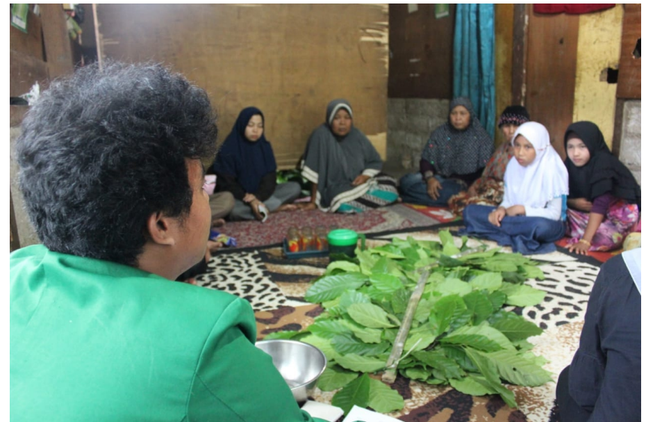
Demonstrasi pembuatan kawa daun