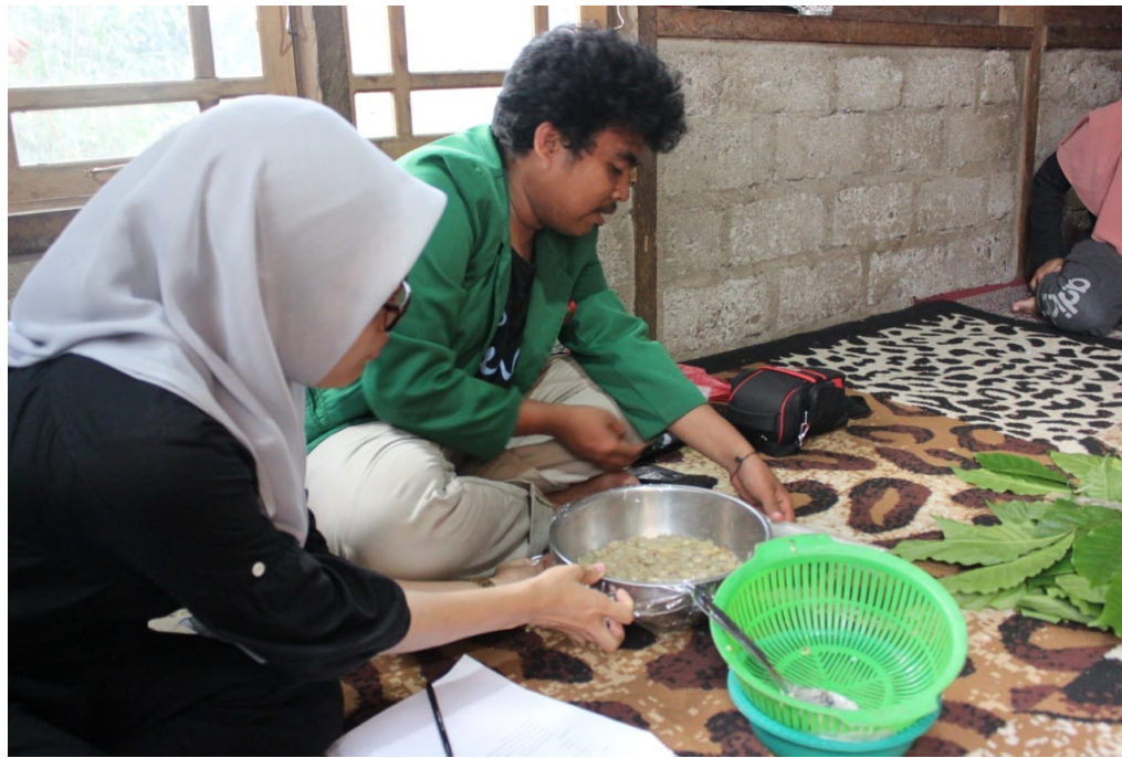
Demonstrasi Pembuatan sirup jahe