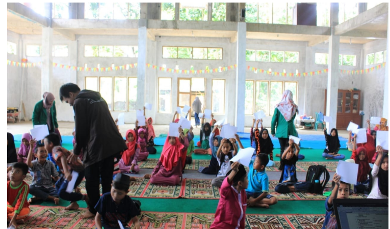
Lomba Rangking I (satu)