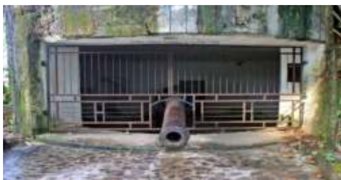
Gambar 7.7. Meriam di Gunung Padang