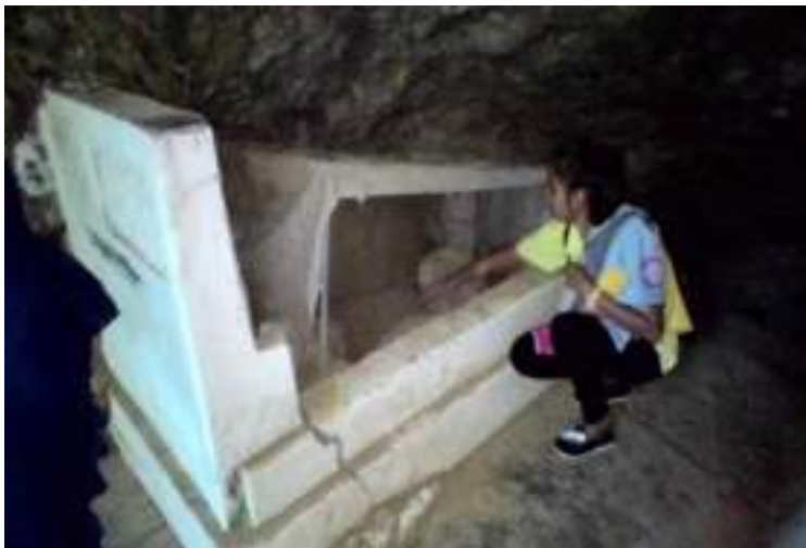
Gambar 2. Kuburan Siti Nurbaya

kering dan berbongkah-bongkah. Pada bagian dalam kuburan terdapat 2 atau 3 kain putih berukuran kecil yang tidak diketahui apa fungsi dari kain tersebut.