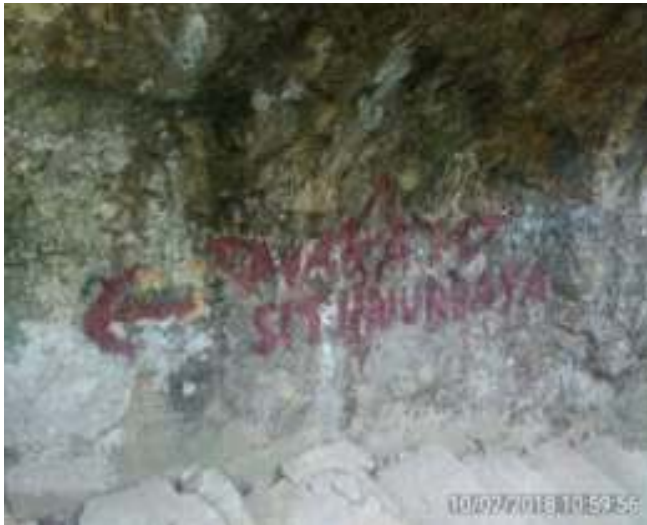
Gambar 4.7. Tanda Petunjuk pada Wisata Sastra Siti Nurbaya

ini hanyalah sebuah gundukan batu biasa menuju Taman Siti Nurbaya. Beberapa orang pengunjung mengatakan mereka tidak mengetahui lokasi Kuburan Siti Nurbaya. Sebenarnya, tanda penunjuk lokasi telah diberikan, mungkin oleh warga setempat atau pengunjung, namun tulisan tidak dibuat dengan menggunakan papan sebagai media tulis atau memberikan warna yang cerah sehingga mudah terlihat oleh para pengunjung.