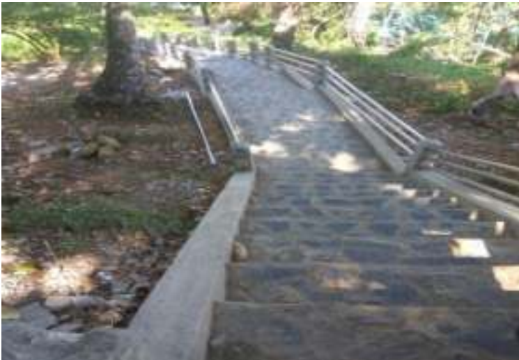
Gambar 5.3. Tangga Menuju Taman Siti Nurbaya

Taman ini sepertinya memerlukan penentuan visi misi yang jelas supaya bisa dikembangkan dengan tepat. Kalau taman ini ditujukan untuk menjadi taman buatan, pengelola perlu penataan lebih jauh disamping keberadaan alamnya. Untuk hal ini, taman ini membutuhkan penataan struktur taman termasuk penyediaan bunga. Walaupun sejuk dan pengunjung bisa memandang ke arah pantai Padang dan pantai Air Manis, taman ini memerlukan nuansa yang asri dan indah bagi para pengunjung untuk bisa selfi moment .