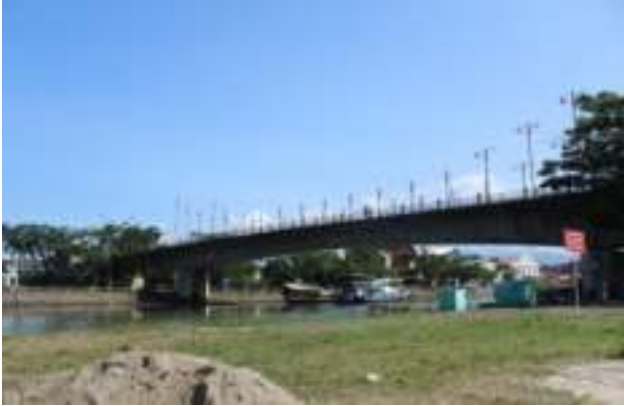
Gambar 9.1. Jembatan Siti Nurbaya