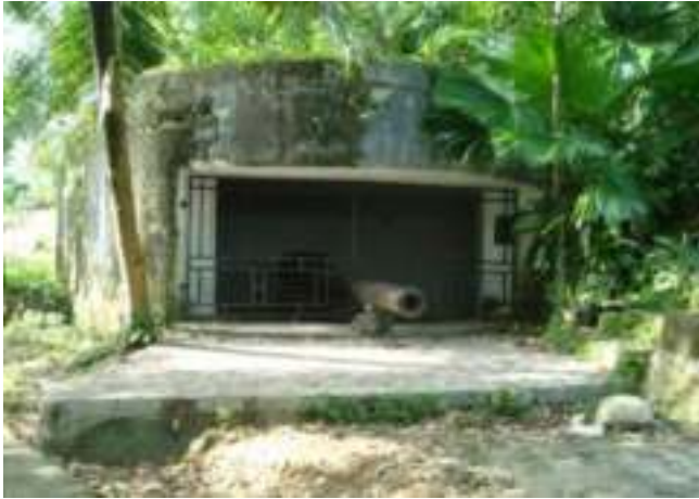
Gambar 4.5. Meriam Pertahanan Perang

Bukit atau Gunung Padang ini merupakan basis pertahanan tentara Jepang yang mengawasi datangnya musuh dari arah Barat. Meriam serta bunker khas tentara Jepang dapat ditemukan di sini.