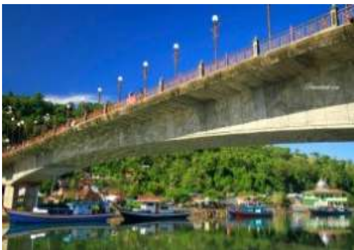
Gambar 6.1. Jembatan Siti Nurbaya

kawasan Kota Tua Padang di Berok Nipah dengan kaki Gunung Padang di seberangnya. Gunung Padang sendiri menurut novel Sitti Nurbaya , merupakan bukit di tepi pantai dimana Sitti Nurbaya pertama kali bertemu dengan kekasihnya Samsulbahri, disitu juga mereka dimakamkan.