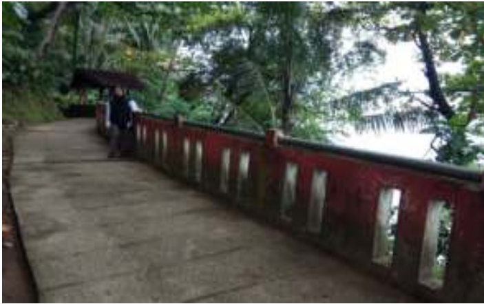
Gambar 7.2. Jalan menuju Taman Siti Nurbaya

Aksesibilitas merupakan faktor-faktor yang mendukung dan mempermudah wisatawan untuk menuju ke objek wisata yang terdiri dari: