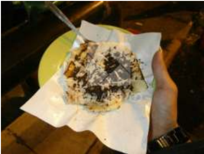
Gambar 10.3. Kuliner Pisang Bakar

Banyak yang menjadikan tempat ini sebagai tempat lari pagi karena lalu lintas yang cukup sepi dan memungkinkan untuk beraktifitas yang berhubungan dengan olahraga.