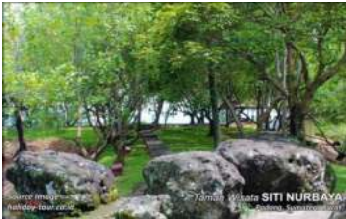
Gambar 3. Taman Siti Nurbaya