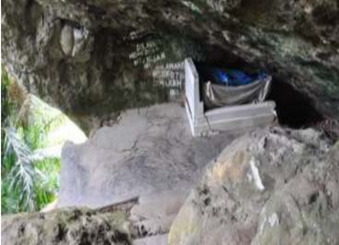
Gambar 8.7. Makam Siti Nurbaya

Diakhir perjalanan di puncak Gunung Padang, kita akan menemukan pemandangan kota Padang yang dihiasi pohon-pohon rindang sehingga meski cuaca panas sekalipun bisa membuat pengunjung untuk bersantai dan menikmati pemandangan kota padang yang indah. Di sebelah utara dan timur, terhampar pemandangan Kota Padang dan Jembatan Siti Nurbaya dari kejauhan. Bergerak sedikit ke selatan, kita akan melihat hamparan Pantai Air Manis beserta Pulau Pisang Kecil dan Pulau Pisang Besar. Sementara, di sisi barat, terhampar bentangan luas dan birunya Samudera Hindia yang akan terlihat indah ketika hari menjelang senja.