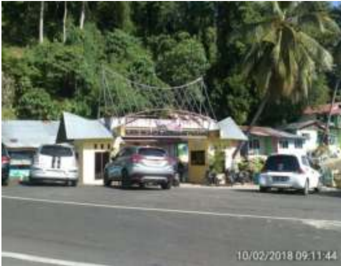
Gambar 10. Gerbang Objek Taman Siti Nurbaya