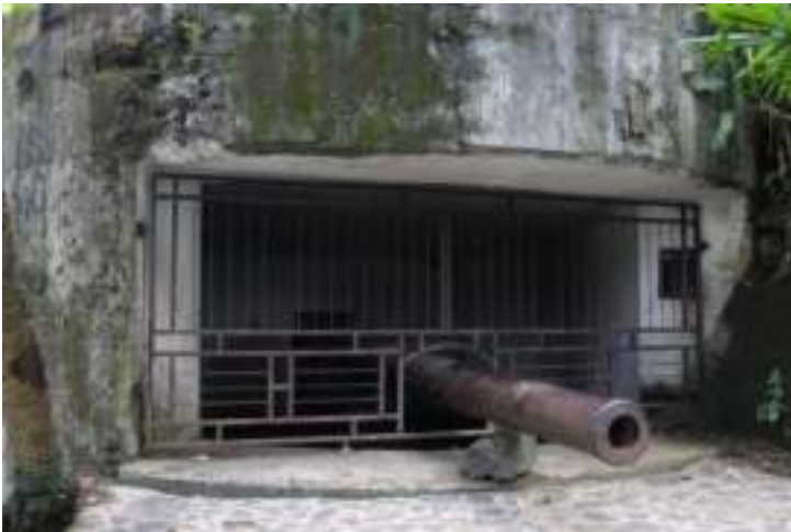
Gambar 8.6. Meriam di Gunung Padang

Dari gerbang, kita akan menyusuri jalan setapak menanjak hingga ke puncak, kurang lebih bisa memakan waktu 15-30 menit perjalanan. Disepanjang jalan sebelah kiri, kita bisa menemukan bunker-bunker dan meriam sisa-sisa peninggalan masa pendudukan Jepang. Sebelum menuju puncak, kita akan menemukan disebelah kanan sebuah lorong dan terdapat makam yang dipercayai itu adalah Makam Siti Nurbaya.