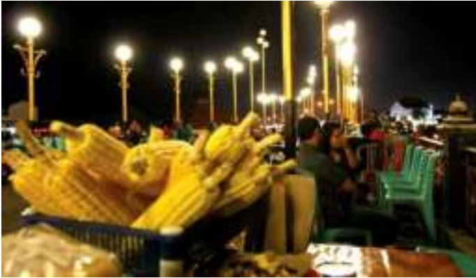
Gambar 8.2. Kuliner dan Pengunjung di Jembatan Siti Nurbaya