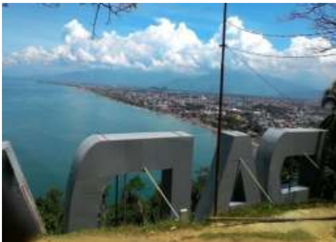
Gambar 3.4. Ikon Kota Padang dari Gunung Padang