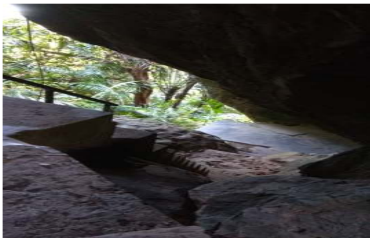
Gambar 11.1. Tangga Menuju Kuburan Siti Nurbaya

besar yang menyerupai goa kecil. Untuk memasuki ke areal tersebut, wisatawan hendaknya menuruni anak tangga dengan hati-hati karena areal tersebut sangat curam yang hanya bisa dilalui oleh satu orang saja.