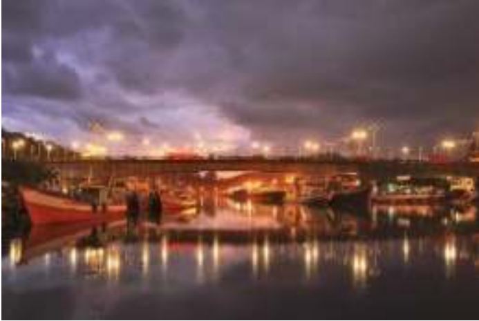
Gambar 6.4 Jembatan Sitti Nurbaya

Oleh karena itu pemerintahan Kota Padang pada dahulunya membangun jembatan dengan nama Jembatan Siti Nurbaya. dan jembatan itu langsung terkenal dimana diseborang jembatan merupakan areal perbukittan dan banyak yang membangun rumah dan warung di areal ini. Jembatan Siti Nurbaya ini merupakan pengingat akan cerita Sitti Nurbaya yang melegenda. Jembatan Siti Nurbaya ini terlihat sangat indah terutama ketika melihat pemandangan matahari terbenam. Saat dimana para pedagang kaki lima biasanya akan memenuhi area tersebut dengan barang dagangannya sampai malam hari. Pesona lampu-lampu yang indah terlihat dijembatan ini dan begitu juga Kota Padang yang kelap-kelip. Area di sekitar jembatan akan dipenuhi oleh para penjual makanan yang menawarkan kuliner khas Padang dengan harga yang cukup bersahabat. Pengunjung dapat mencicipi sate Padang, pisang bakar, jagung bakar dan berbagai minuman khas sesuai selera.