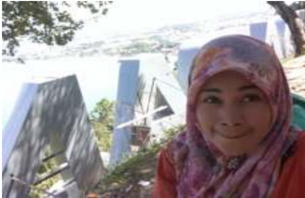
Gambar 5.4. Nama Kota Padang dari Taman Siti Nurbaya