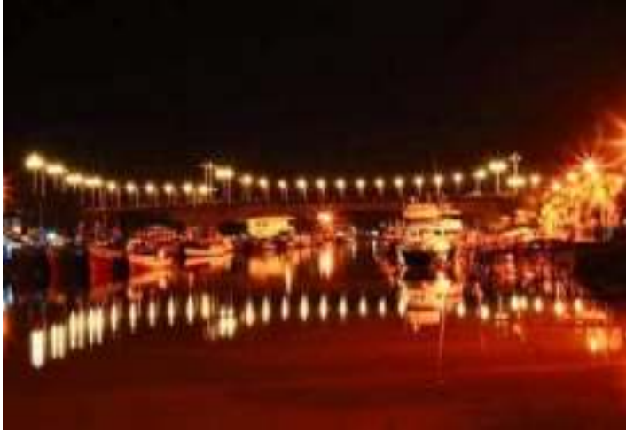
Gambar 2.2. Jembatan Siti Nurbaya pada Malam Hari