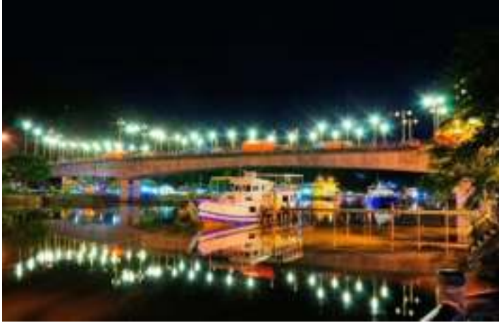
Gambar 8.1. Jembatan Siti Nurbaya Malam Hari

Jembatan ini berfungsi sebagai penghubung menuju Taman Siti Nurbaya. Jembatan ini dilengkapi lampu-lampu yang indah di malam hari, sehingga memiliki pemandangan yang cantik dan dijadikan salah satu tempat kuliner yang menjajakan jagung bakar dan sering didatangi muda-muda dan keluarga untuk sekedar duduk-duduk bersantai menikmati waktu. Data dari kuisioner yang diberikan kepada pengunjung memperlihatkan bahwa pengunjung yang datang disana tidak semuanya tahu bagaimana cerita lengkap Sitti Nurbaya , yang mereka tahu hanyalah cerita dari mulut ke mulut yang beredar dan banyak yang tidak membaca langsung karya sastra nya Sitti Nurbaya oleh Marah Rusli.