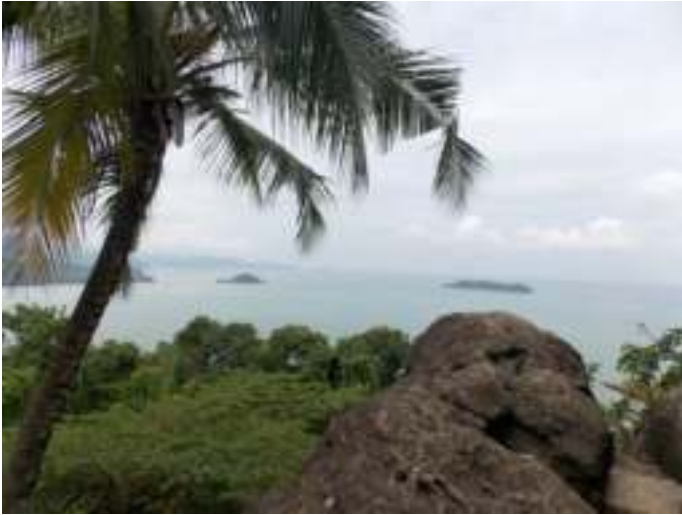
Gambar 8.8. Pemandangan dari Gunung Padang

Menurut sejumlah pengunjung, pemandangan gunung yang bisa dinikmati pengunjung saat sampai dipuncaknya menjadi alasan nomor satu. Tanggapan wisatawan menunjukkan bahwa representasi Sitti Nurbaya di Gunung Padang mulai pudar. Hal ini terjadi barangkali karena berubahnya alasan orang-orang untuk berkunjung. Sitti Nurbaya di Gunung Padang terkesan hanya sebatas legenda yang dikenal, bahkan pengunjung datang kesini juga bermotif untuk berolahraga karena banyak akses untuk menuju puncak cukup mudah dituju. Banyak keluarga dan muda-mudi menjadikan tempat ini sebagai tujuan berakhir pekan atau sore hari dengan menggunakan pakaian olah raga. Juga, kebanyakan pengunjung yang datang belum pernah membaca cerita Sitti Nurbaya karya Marah Roesli, apalagi muda-mudi saat ini. Motif