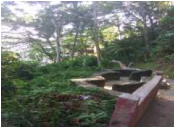
Gambar 5.9. Tempat Duduk Sebelum Taman Siti Nurbaya