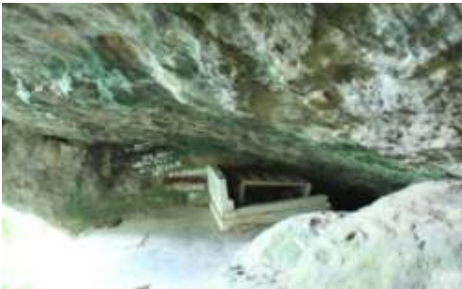
Gambar 9.3. Kuburan Siti Nurbaya

Para wisatawan mengunjungi Gunung Padang dengan beberapa alasan, ada diantara mereka yang ingin maraton, menikmati pemandangan. Namun yang lebih banyak dari pengunjung itu ingin menyaksikan Kuburan Siti Nurbaya. 4