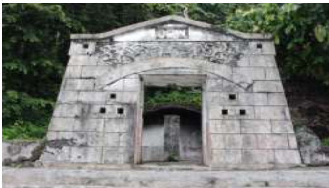
Gambar 7.6. Benteng di Gunung Padang