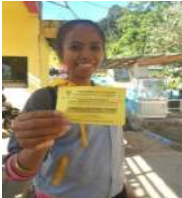
Gambar 5.1. Karcis Masuk ke Gunung Padang

tidak dikelola dengan baik. Pengunjung membayar biaya parkir ketika akan meninggalkan lokasi. Pada akhir pekan, khususnya pagi hari, pengunjung seringkali susah mendapatkan tempat untuk parkir karena terbatasnya lahan dan tidak adanya petugas yang benar-benar mengatur perparkiran.