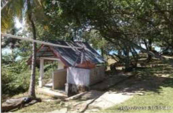
Gambar 12. Toilet di Taman Siti Nurbaya

Kini wisata sastra Siti Nurbaya menjadi salah satu tujuan di Kota Padang. Begitu juga dengan jembatan, Kuburan dan Taman Siti Nurbaya, yang kerap dikunjungi wisatawan yang ingin memahami cerita fiksi yang melegenda tersebut secara langsung pada latarnya. Dengan animo yang besar ini, masih banyak pekerjaan rumah bagi pengelola terhadap destinasi wisata ini seperti fasilitas umum, fasilitas penunjang, sarana dan prasarana, keamanan, dan tentunya tanda penunjukan arah dan informasi.