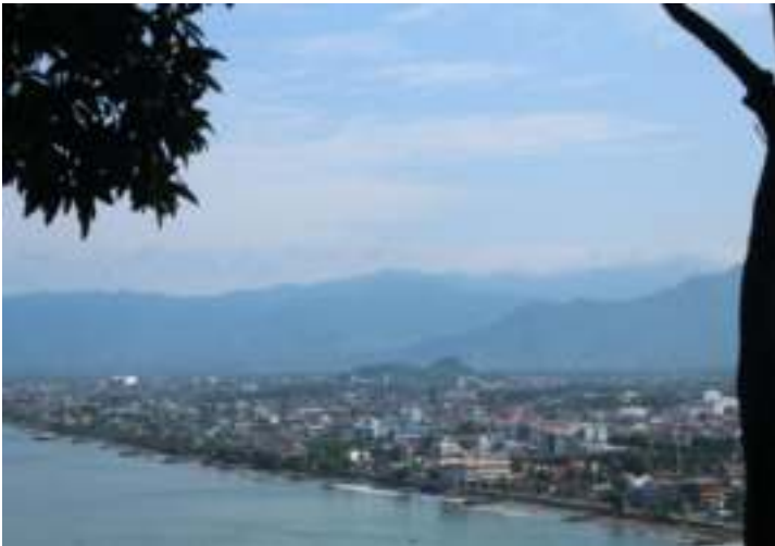
Gambar 9.6. Kota Padang