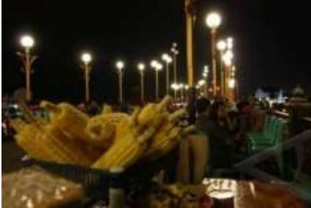
Gambar 6.5. Kuliner Jagung di Malam Hari

Selain Jembatan Siti Nurbaya, pesona kota Padang yang lainnya adalah bangunan-bangunan tua zaman Belanda di sekitar jembatan. Mulai dari jalan Pondok, Niaga, Kelenteng hingga jalan Batang Arau di dekat jembatan merupakan kawasan kota tua Padang. Kaum pendatang seperti Tionghoa, Nias, Mentawai dan Batak banyak bermukim disini.