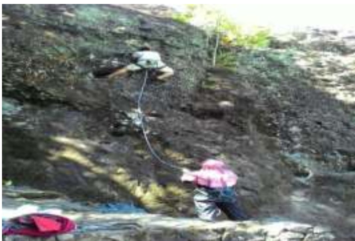
Gambar 3.3. Panjat Tebing di Gunung Padang

Tepat di atas batu yang menaungi Kuburan Siti Nurbaya kita juga bisa melakukan kegiatan seperti Rock Climbing . Ini tentu hanya dimanfaatkan bagi orang-orang yang menyukai tantangan saja. Sebab cukup berbahaya jika dilakukan oleh orang-orang awam yang tidak punya pengalaman. Salah-salah kita akan terjun bebas ke jurang.