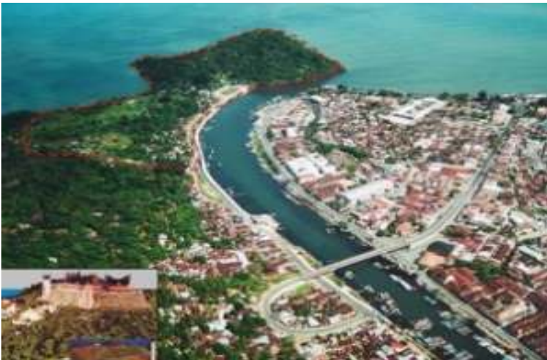
Gambar 2.1. Jembatan Siti Nurbaya dari Udara

Berdasarkan cerita Sitti Nurbaya , Padang mempunyai warisan yang bisa ditawarkan kepada penikmat cerita ini dalam bentuk atraksi yang kalau dikembangkan akan bisa menjadi ikon kota ini. Setidaknya Padang bisa menawarkan beberapa atraksi: Jembatan Siti Nurbaya (gambar 1 dan 2), Taman Siti Nurbaya (gambar 3) and Makam Siti Nurbaya (gambar 4).