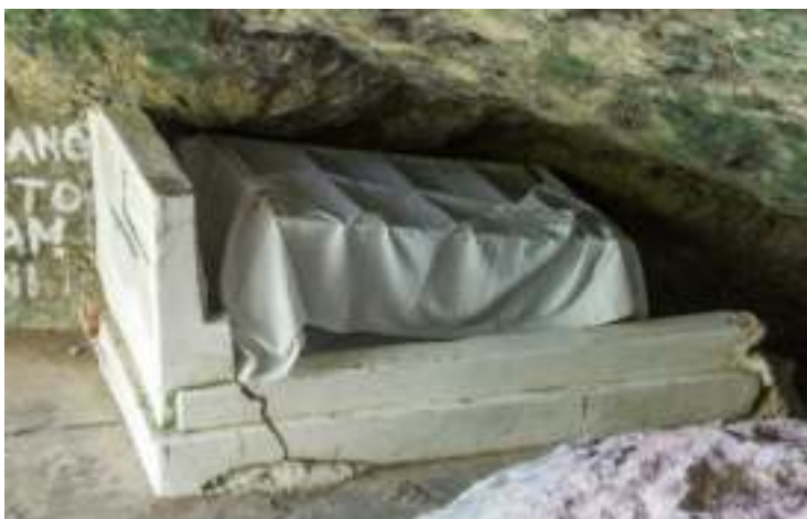
Gambar 7.5. Kuburan Siti Nurbaya

Sitti Nurbaya dipercayai bermakam di Gunung Padang dan banyak wisatawan berkunjung ke makam tersebut. Suasana di lokasi makam ini sedikit agak gelap karena kurangnya cahaya matahari yang masuk. Disamping makam ini, ada lagi cerita yang berkembang di masyarakat yaitu adanya makam lain yang di beri nama kuburan keramat kecil. Siapa yang di kuburkan disana masih anonim, ada yang mengatakan kuburan Syekh tetapi masyarakat meyakini makam tersebut memiliki kisah mistis. Tetapi hal tersebut tidak mempengaruhi para wisatawan, yang pasti mereka kesana untuk menikmati wisatanya. Kuburan ini terletak dekat