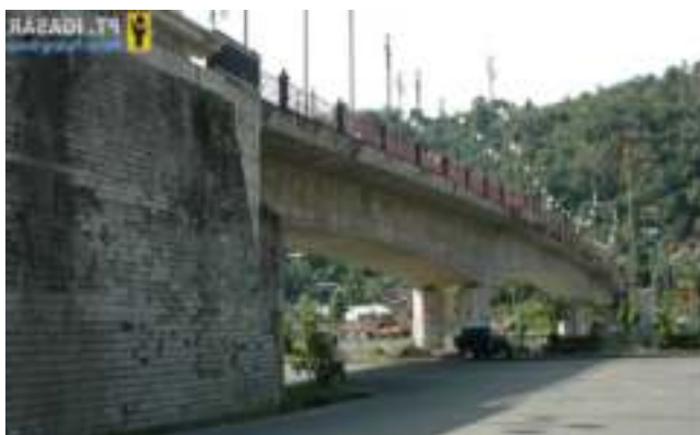
Gambar 7.8. Jembatan Siti Nurbaya