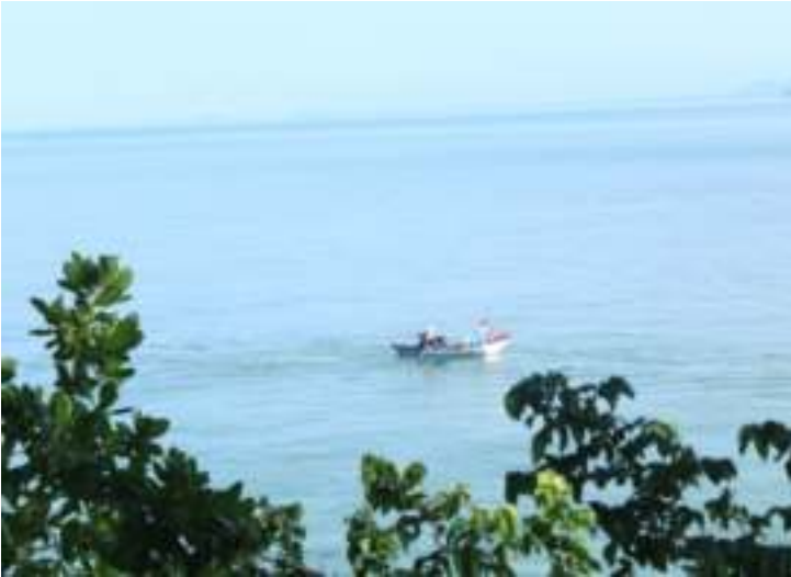
Gambar 9.5. Samudra Indonesia