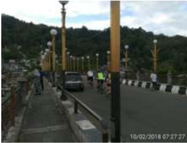
Gambar 5.8. Jembatan Siti Nurbaya

mereka melanjutkan perjalanan menuju Taman Siti Nurbaya. Disamping itu, pedagang yang berjualan di jembatan ini, menurut pengunjung, perlu menawarkan kuliner khas Padang.