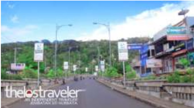
Gambar 8.4. Suasana Jembatan di Pagi Hari

Berubahnya tujuan pengunjung untuk datang ke Jembatan Siti Nurbaya menjadi salah satu faktor mulai tergerusnya Sitti Nurbaya di zaman modern saat ini. Masyarakat kebanyakan mendatangi jembatan ini untuk menikmati suasana malam hari disana, bukan semata-mata tertarik terhadap kisah yang melegenda ini. Sitti Nurbaya yang memiliki pamor yang luar biasa karena ditulis pengarang Balai Pustaka menjadi daya tarik yang tidak terelakan dari lokasi wisata ini. Sitti Nurbaya bagi jembatan ini hanya terkesan sebagai alat untuk menciptakan ikon wisata kota Padang. Penggaungan kisah roman Sitti Nurbaya dengan jembatan ini sepertinya tidak memiliki kekuatan lagi. Sitti Nurbaya tetap di ceritakan sesuai legenda yang melegenda, tapi sayangnya Sitti Nurbaya hanya menjadi nama di jembatan ini dimana pengunjung tidak tahu bagaimana kisah Sitti Nurbaya secara utuh. Sitti Nurbaya zaman modern ini tinggal nama tergerus oleh zaman, pudar oleh waktu sehingga Sitti Nurbaya hanya tinggal kisah yang melegenda.