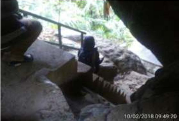
Gambar 5.7. Tangga Menuju Kuburan Siti Nurbaya