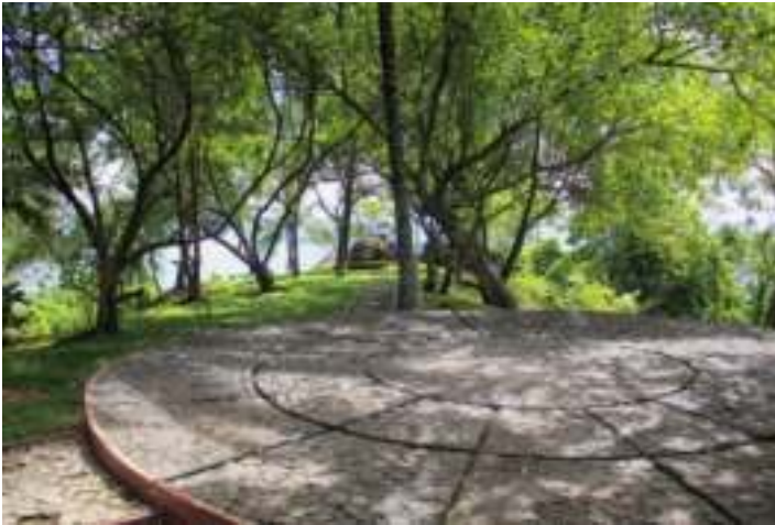
Gambar 4.10. Pentas Terbuka Taman Siti Nurbaya

Marah Rusli. Sama halnya dengan objek sebelumnya, ditempat ini juga tidak terdapat tanda penunjuk arah dan informasi tentang taman tersebut.