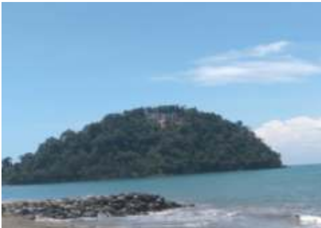
Gambar 5.5. Gunung Padang