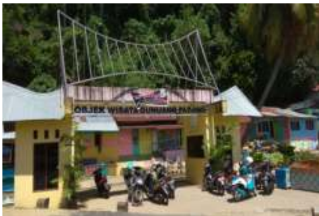
Gambar 3.2. Gerbang Masuk Taman Siti Nurbaya

Berbeda dengan jembatan, Gunung Padang yang memang terdapat dalam novel Sitti Nurbaya , tempat dimana Sitti Nurbaya dan Samsulbahri serta kedua temannya pernah berekreasi ke tempat itu menawarkan keasrian serta keindahan yang berbeda. Menuju ke sana kita tak perlu mengeluarkan kocek yang banyak. Cukup dengan membeli tiket seharga lima ribu perorang di gerbang, lalu berjalan sekitar dua puluh lima menit hingga ke taman di atasnya.