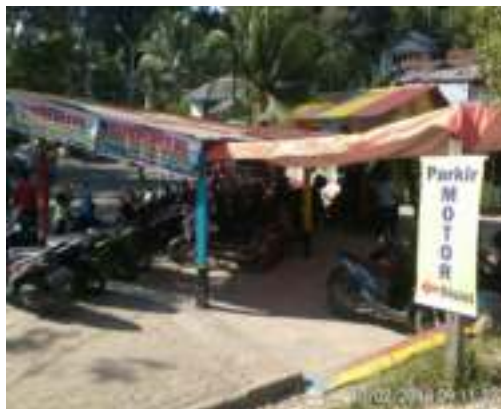
Gambar 5.2. Tempat Parkir