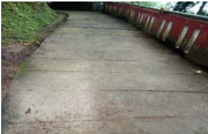
Gambar 7.3. Jalan Menuju Taman Siti Nurbaya