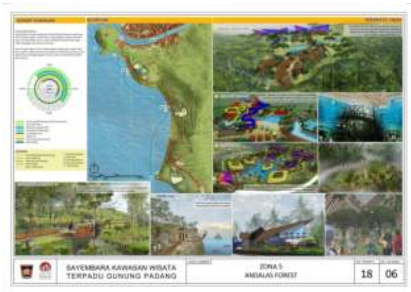
Gambar 7.10. Konsep Kawasan Wisata Terpadu Gunung Padang (Sumber: Foto Dokumentasi dari Dinas Pariwisata dan Kebudayaan Kotamadya Padang -Peta Konsep Perencanaan Pengembangan Kawasan Wisata Terpadu Gunung Padang).

bala; dan 7. Festival kuliner, ekonomi kreatif, seni budaya. Dana untuk pengembangan konsep wisata ini meliputi hotel, resort, dan sarana pendukung kegiatan pariwisata. Ditambahkan lagi bahwa potensi investasi di Kawasan Wisata Terpadu Gunung Padang, kemudian pengembangan wisata di 19 pulau kecil, pembangunan jalan Teluk Kabung, Padang-Mandeh, dan pengembangan pelabuhan Bungus dan Bukit Putus.