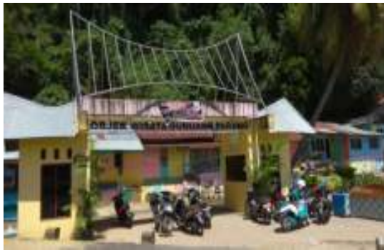
Gambar 8.5. Gerbang Objek Wisata Gunung Padang

Letaknya berada di seberang selatan dari muara Sungai Batang Arau dan termasuk dalam wilayah Kecamatan Padang Selatan. Sebuah bukit kecil dengan ketinggian puncak sekitar 80 meter di atas permukaan laut. Masyarakat Kota Padang menamainya Gunung Padang karena bukit ini bisa dikatakan tempat tertinggi di sekitar pusat kota yang terkenal dengan kuliner rendang sebagai andalannya ini. Gunung Padang menyimpan kombinasi antara panorama yang indah, legenda cinta, dan sepenggal sejarah masa pendudukan Jepang.