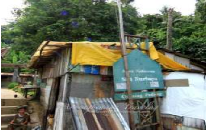
Gambar 4.3. Tanda Petunjuk Tentang Kuburan Siti Nurbaya

Hal ini menunjukkan bahwa Gunung Padang difungsikan sebagai destinasi wisata alam dimana pengunjung bisa mendaki bukit ini untuk berolahraga dan menikmati pemandangan dari atas serta bergembira ria disana. Pengelolaan destinasi ini belum mengindikasikan bahwa disamping wisata alam, tempat ini juga memiliki potensi wisata sastra. Pengunjung yang sudah membaca cerita Sitti Nurbaya belum bisa memenuhi keingintahuan mereka dengan latar cerita tersebut di Gunung Padang secara informatif.