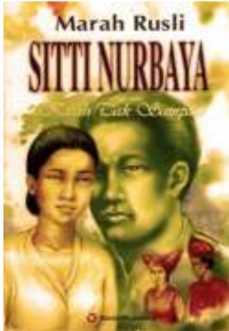
Gambar 1.1. Novel Sitti Nurbaya karya Marah Rusli (Sumber: Wattpad)

Sampai setidaknya tahun 1930, Sitti Nurbaya merupakan salah satu karya yang diterbitkan oleh Balai Pustaka yang paling populer dan sering dipinjam dari perpustakaan. Setelah kemerdekaan Indonesia , Sitti Nurbaya diajarkan sebagai salah satu karya sastra Indonesia klasik. Novel yang disambut baik pada saat penerbitan pertamanya ini sampai sekarang masih dipelajari di sekolah-senusatara. Sampai tahun 2008, buku ini sudah dicetak ulang 44 kali. Sitti Nurbaya sering dianggap salah satu karya sastra Indonesia yang paling penting, dengan cerita cintanya dibandingkan dengan Romeo and Juliet karya William Shakespeare dan legenda Cina Sampek Engtay . Meskipun begitu, keluarga Marah Rusli tidak menerima novel Sitti Nurbaya dengan baik. Dalam sepucuk surat, ayahnya telah mengutuk Marah Rusli, sehingga dia tidak pernah kembali ke Padang (Foulcher, 2002).