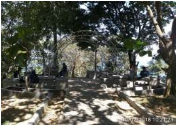
Gambar 4.9. Gerbang Taman Siti Nurbaya

mendaki melalui jalur-jalur tangga yang telah tersedia sejauh 1 km. Para pengunjung tidak perlu khawatir akan panas yang menyengat karena di sisi-sisi bukit ini masih banyak ditumbuhi oleh pohon-pohon rindang. Sehingga, akan membuat perjalanan ke atas bukit menjadi nyaman. Kemudian, di puncak Gunung Padang, ada tanah lapang, yang disulap menjadi taman bermain, seolah tempat Siti Nurbaya sempat memadu kasih dengan Samsulbahri.