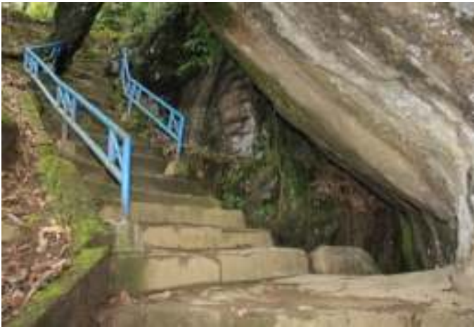
Gambar 4.6. Tempat Masuk Kuburan Siti Nurbaya

Cerita Sitti Nurbaya merupakan kisah yang sangat dikenal oleh warga Padang. Saking fenomenalnya cerita roman itu, hingga hari ini masyarakat sekitar Gunung Padang, Kota Padang, Sumatera Barat, mempercayai kisah fiktif atau rekaan itu sungguh-sungguh terjadi dan nyata. Konon, di Gunung Padang itu diyakini ada kuburan tokoh malang Sitti Nurbaya, yang tewas diracun oleh orang suruhan Datuk Meringgih, berada di puncak bukit itu. Sama seperti objek wisata sastra Siti Nurbaya sebelumnya, tidak terdapat tanda petunjuk di lokasi ini.