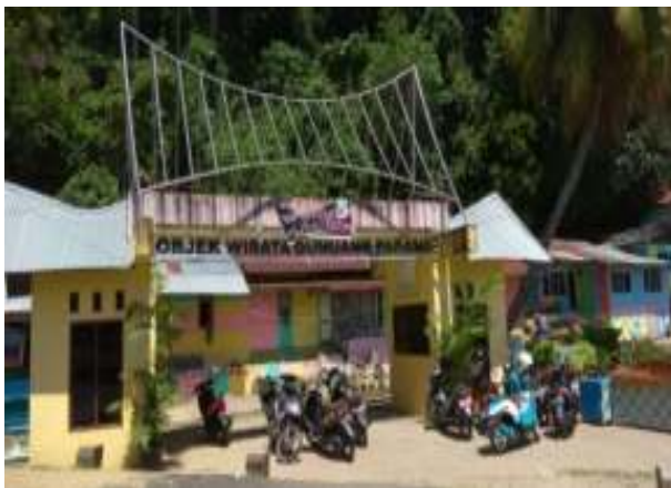
Gambar 4.2. Gerbang Masuk Objek Wisata Gunung Padang

Gunung Padang menurut novel Sitti Nurbaya , merupakan bukit di tepi pantai dimana Sitti Nurbaya memadu cinta dengan kekasihnya Samsulbahri dan disitu jugalah mereka dikuburkan. Di gerbang menuju lokasi wisata Kuburan dan Taman Siti Nurbaya, pengunjung belum mendapatkan informasi yang jelas dan berhubungan dengan novel Sitti Nurbaya , seperti tanda penunjuk tempat, tanda penunjuk tentang informasi sastra pada lokasi tersebut, tanda penunjuk fasilitas lokasi wisata, dan tanda penunjuk destinasi wisata sastra Siti Nurbaya berikutnya.