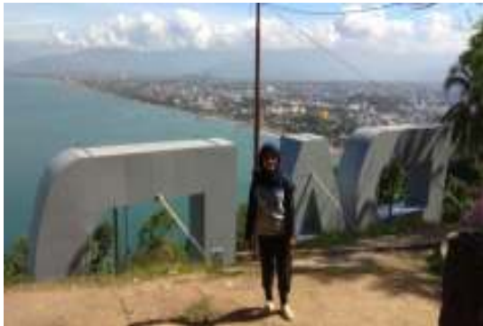
Gambar 8.9. Pemandangan kota Padang dari Gunung Padang

untuk mendatangi objek wisata Gunung Padang bukan lagi karena legenda Sitti Nurbaya tapi hanya karena pemandangan yang disajikan sangat indah dan tempat yang pas untuk berolahraga dan juga menjadi tempat tujuan untuk berfoto.