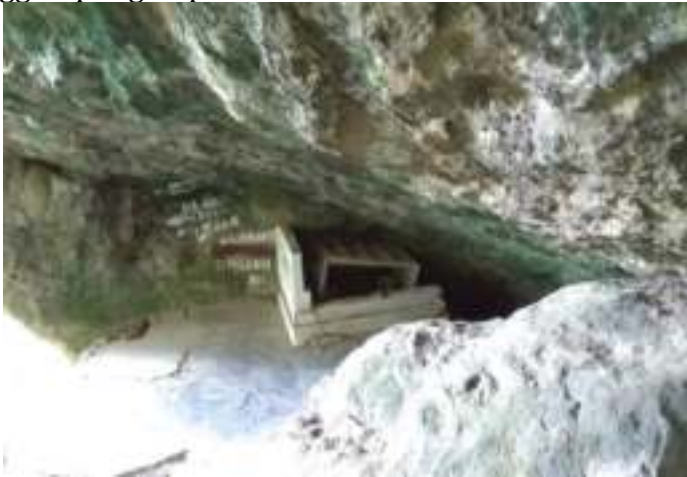
Gambar 3.1. Kuburan Siti Nurbaya

Perbedaan lain yang sangat berbeda dan mencolok adalah fakta mengenai Kuburan Siti Nurbaya. Kuburan Siti Nurbaya terletak di puncak Gunung Padang. Kuburan itu terdapat di dalam gua batu yang diberi tanda di pintu guanya. Tanda tersebut bertuliskan “Makam Siti Nurbaya” lalu diberi tanda panah. Setelah masuk melalui mulut gua dan menuruni beberapa anak tangga yang cukup terjal kita akan melihat kuburan yang diselimuti kain putih dan tanah yang sudah menggumpal-gumpal di atas kuburan tersebut.