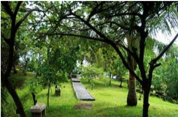
Gambar 7.4. Taman Siti Nurbaya