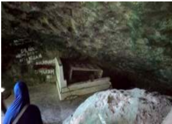
Gambar 4.8. Kuburan Siti Nurbaya

Kuburan yang disebut sebagai Kuburan Siti Nurbaya, berupa batu nisan yang ukurannya sedikit lebih panjang dari kuburan kebanyakan. Batu kuburan berwarna putih. Suasana di dalam remang-remang karena minim cahaya matahari yang masuk dari celah batu. Beberapa coretan di dinding kuburan, bertuliskan, dilarang untuk memotret di dalam kuburan. Anehnya, di kuburan tersebut, tak ada batu nisan yang bertuliskan nama, tanggal lahir dan tanggal wafat seperti layaknya kuburan yang lain. Menjelang sampai ke puncak Gunung Padang, pengunjung bisa melihat Kuburan Siti Nurbaya. Kondisi kuburan itu sedikit memprihatinkan dengan adanya coretan pada kiri kanan dindingnya.