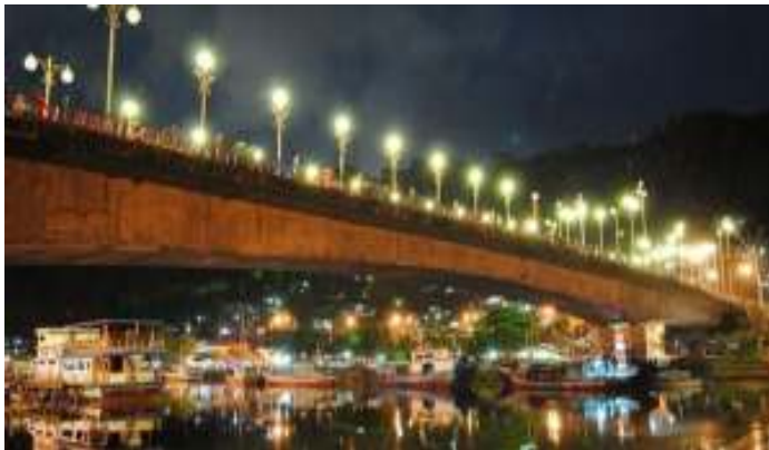
Gambar 7.1. Jembatan Siti Nurbaya di Malam Hari

identitas arsitektur Minangkabau. Dulu sebelum adanya jembatan ini, masyarakat menggunakan sampan sebagai alat transportasi untuk menyeberang menuju pusat kota. Setelah dibangunnya jembatan ini segalanya jauh lebih mudah. Dengan tujuan untuk meningkatkan sarana dan prasarana transportasi regional melalui Kota Padang kearah Teluk Bayur serta pembangunan Kawasan Wisata Gunung Padang. Jembatan Siti Nurbaya di rancang dan di bangun dengan kontruksi modern menggunakan sistem Beton Pratekan Tipe Gelagar Box. Tidak ada bentuk kekakuan dalam gaya bangunannya, karena di kerjakan dengan sistem sabuk geser atau yang biasa di kenal dengan paraweb (Devy dan Soemanto, 2017).