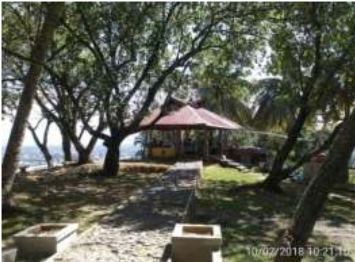
Gambar11. Warung dan Spot Selfie di Taman Siti Nurbaya

Tempat ini merupakan lokasi wisata sastra yang sangat bagus sebagai destinasi di Kota Padang. Perhatian pemerintah dan pengelola terhadap objek pariwisata ini, terutama pada tanda penunjuk informasi dan lokasi masih diharapkan.