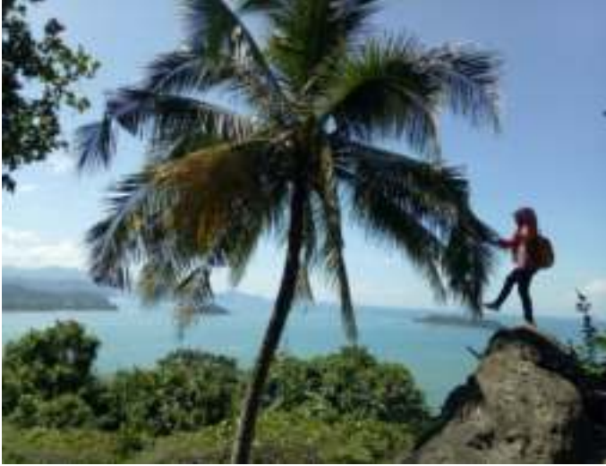
Gambar 5.6: Di Puncak Gunung Padang