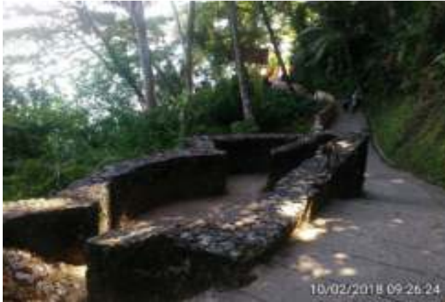
Gambar 4. Tempat Sitti Nurbaya dan Samsulbahri Bertemu

Dalam novel Sitti Nurbaya yang menggunakan pantun dalam beberapa penceritaan, terdapat pantun yang menceritakan media tentang perasaan Sitti Nurbaya dan Samsulbahri, seperti di bawah ini: