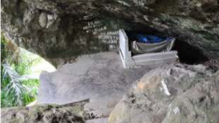
Gambar 4. Makam Siti Nurbaya

Ketiga atraksi ini sudah ada namun belum memperlihatkan perkembangan yang membanggakan. Sayangnya, destinasi ini belum berhasil menarik perhatian turis dalam jumlah besar baik domestik apalagi mancanegara.