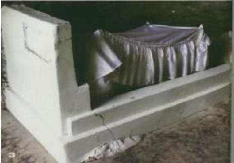
Gambar 6.3. Makam Sitti Nurbaya

makam. Perjalanan tidak terlalu menyulitkan karena anak tangga untuk menuju ke lokasi telah dibangun dengan baik dan mengutamakan keamanan para wisatawan. Bukit tempat disemayamkannya Sitti Nurbaya ini memiliki nama yang sama dengan Jembatan Siti Nurbaya, yaitu “Bukit Siti Nurbaya.”