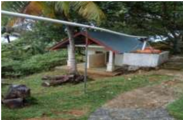
Gambar 7.9. Toilet di Taman Siti Nurbaya

Taman Siti Nurbaya sudah dilengkapi dengan toilet / kamar kecil yang disediakan di puncak Gunung Padang. Walaupun sarana vital ini sudah ada, keberadaannya masih belum memadai baik dari segi kebersihan ataupun kecukupan air.