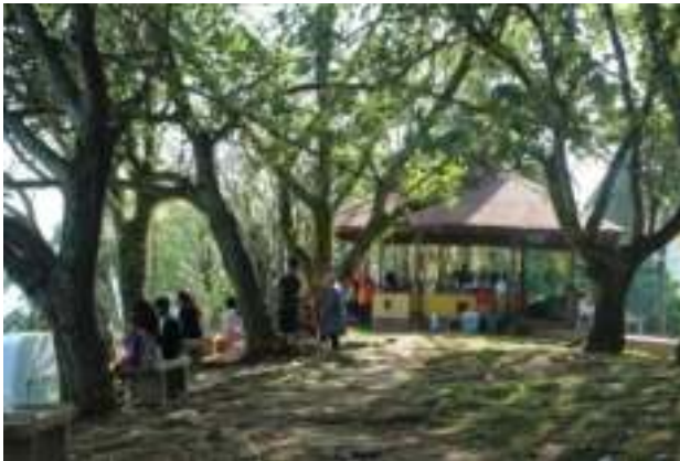
Gambar 9.2. Taman Siti Nurbaya

Jembatan Siti Nurbaya membentang dari Padang Kota Tua ke kawasan Muaro. Menghubungkan dua kawasan, sekaligus memperlancar arus lalu-lintas masyarakat lereng Gunung Padang dan masyarakat Kota Padang khususnya, terutama masyarakat Padang Kota Tua. Jembatan ini juga mempermudah para wisatawan menuju Gunung Padang.