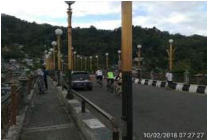
Gambar 4.1. Jembatan Siti Nurbaya

wisata Siti Nurbaya, namun tidak terdapat penunjuk arah yang akan mengarahkan pengunjung ke Kuburan dan Taman Siti Nurbaya sebagai tujuan berikutnya. Sejumlah pengunjung juga mengungkapkan bahwa mereka tidak mengetahui tentang fasilitas serta sarana dan prasarana yang ada di lokasi wisata sastra Siti Nurbaya. Mereka menyarankan pengembangan dengan memberikan tanda penunjuk arah.