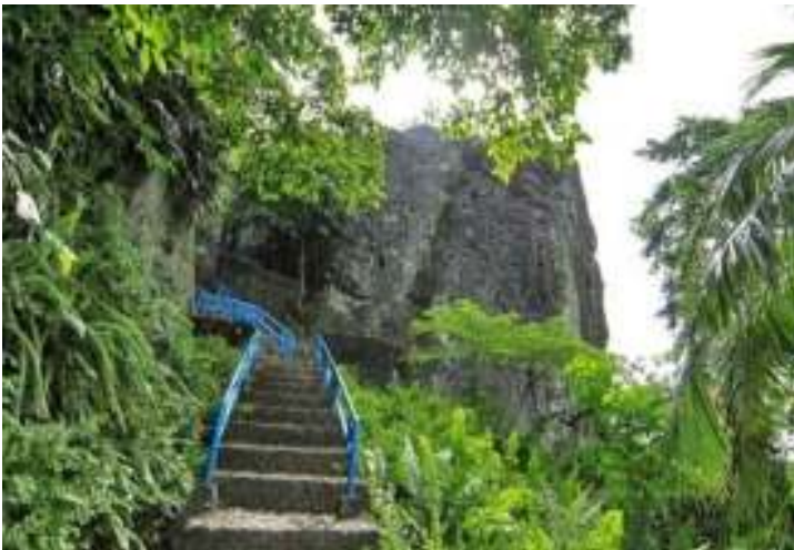
Gambar 6.2. Jalan Menuju Makam Siti Nurbaya

Sebelum sampai ke Taman dan Makam Siti Nurbaya, wisatawan dapat melewati Jembatan Siti Nurbaya yang mempesona mata pegunjung selain bersejarah tentunya. Pemerintah membangun jembatan yang menghubungkan Gunung Padang dan kota Padang kemudian menamainya sesuai judul roman yang legendaris itu, yaitu Jembatan Siti Nurbaya, sebagai bentuk penghargaan kepada penulisnya. Jembatan Siti Nurbaya ini banyak dikunjungi wisatawan. Jika berkunjung ke Padang rasanya tidak lengkap jika tidak menikmati keindahan kota Padang tanpa mengunjungi Jembatan Siti Nurbaya