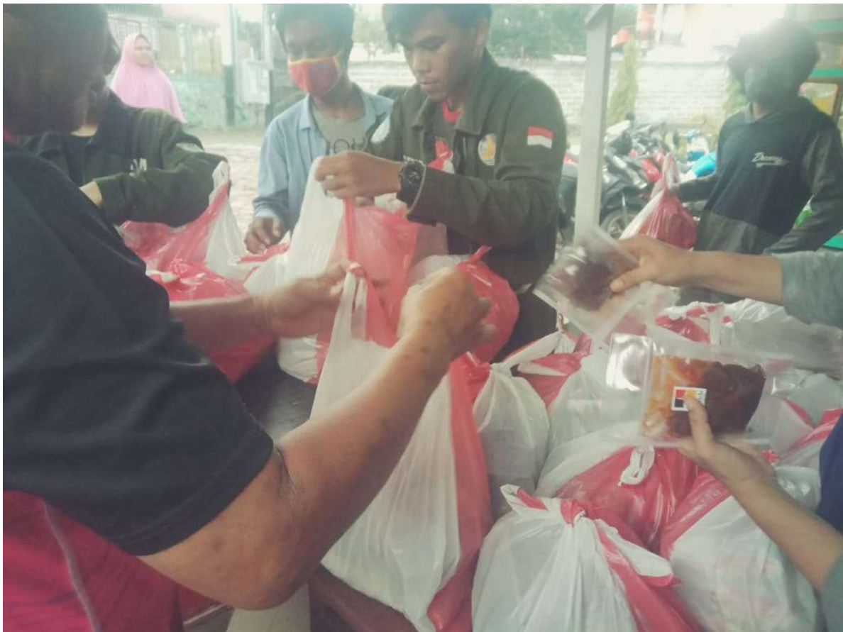
Relawan mahasiswa menyiapkan packing sembako