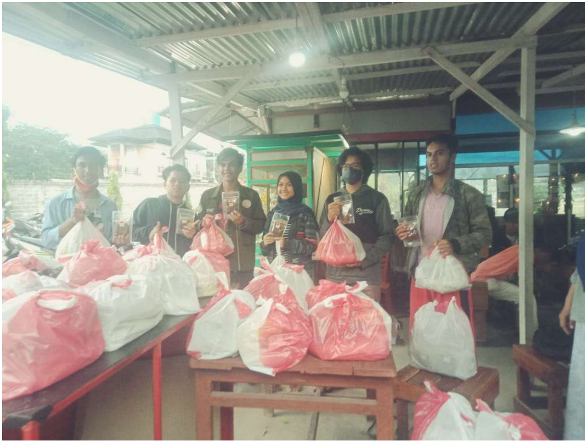
Distribusi bahan sembako kepada mahasiswa