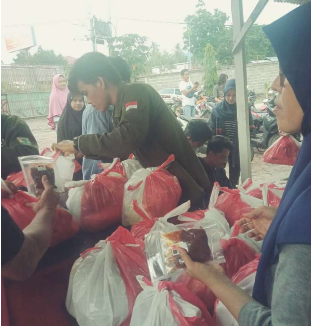
Relawan mahasiswa checking bahan sembako