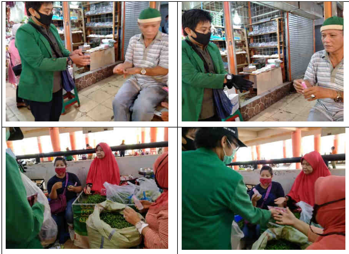
Gambar 1, Dokumentasi edukasi pedagang Pasar Raya Padang

Pada Gambar 1 disajikan beberapa dokumentasi kegiatan edukasi yang diberikan mahasiswa kepada pedagang pasar raya berupa cara mencuci tangan yang baik dan benar serta pentingnya memakai masker. Dapat dilihat bahwa sebagian pedagang sudah memiliki kesadaran untuk memakai masker, namun masih cukup banyak yang belum menggunakan masker. Kemudian untuk hand sanitizer dapat dikatakan bahwa mayoritas pedagang belum mempunyai hand sanitizer . Hal ini dapat disebabkan langkanya hand sanitizer di pasaran dan juga harganya yang relatif tinggi bagi para pedagang. Padahal dengan kondisi aktivitas pedagang yang sering bertransaksi memegang uang tentunya akan menjadi salah satu wadah penularan covid 19. Di samping itu ketika itu juga belum tersedia sarana mencuci tangan pakai sabun bagi para pedagang. Dengan demikian pengadaan hand sanitizer ini diharapkan mampu menjaga tangan para pedagang dari ancaman virus. Jika pedagang menjaga tangannya agar selalu steril dari virus, para pembeli pun tentunya akan terlindungi, sehingga diharapkan transaksi jual beli dapat berlangsung aman.