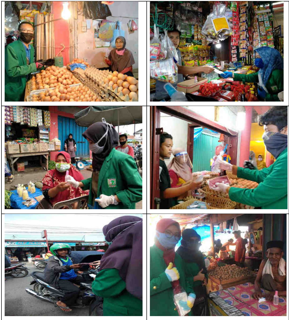
Gambar 3. Dokumentasi pembagian hand sanitizer dan masker bagi pedagang dan tukang ojek di Pasar Siteba

Pada tahap dua dibagikan 100 paket hand sanitizer dan masker kepada para pedagang Pasar Siteba dan juga pada tukang ojek yang mangkal di sekitar Pasar Siteba. Pada Gambar 3 disajikan dokumentasi kegiatan pembagian hand sanitizer dan masker bagi pedagang dan tukang ojek di Pasar Siteba. Pada kegiatan ini dibagikan 100 paket hand sanitizer dan masker. Kegiatan dilaksanakan pada tanggal 19 Mei 2020.