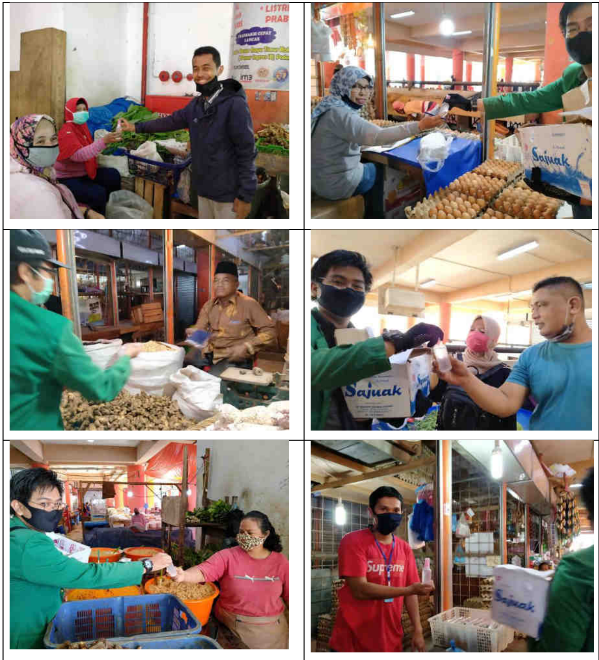
Gambar 2. Dokumentasi kegiatan pembagian hand sanitizer dan masker kepada pedagang Pasar Raya Padang

Pada awalnya kegiatan pembagian hand sanitizer dan masker hanya direncanakan di Pasar Raya Padang. Namun mengingat dan menimbang semakin maraknya kasus terkonfirmasi yang ditemukan di Pasar raya sehingga dikhawatirkan akan beresiko juga bagi mahasiswa yang akan membagikan hand sanitizer dan masker ini, maka kegiatan tahap 2 dialihkan ke Pasar Siteba.