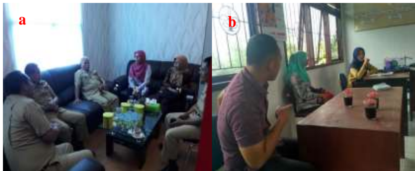
Gambar 6. Sosialisasi kegiatan pengabdian masyarakat, a) Sosialisasi dengan dinas pertanian Kabupaten Dharmasraya, b) Sosialisasi dengan UPTD BPP Pulau Punjung

Kegiatan pengabdian kepada masyarakat disosialisasikan kepada kelompok tani mitra, perangkat Nagari Sungai Dareh, Dinas Pertanian Kab. Dharmasraya, UPTD BPP Kec. Pulau Punjung, dan Penyuluh Petani Lapangan (PPL). Sosialisasi kepada mitra bertujuan untuk menjelaskan tahapan pelaksanaan kegiatan, yang terdiri dari persiapan kegiatan penyuluhan dan pelatihan, persiapan lahan untuk demplot. Bersamaan dengan itu dilakukan sosialisasi dengan perangkat Nagari Sungai Dareh untuk menyampaikan kepada warga tentang kegiatan IbDM yang akan dilaksanakan di Nagari tersebut. Sosialisasi dengan Dinas Pertanian Kab. Dharmasraya dilakukan di kantor Dinas Pertanian Dharmasraya bersama dengan Kepala Dinas, Sekretaris Kadis, Kepala Bagian Perkebunan dan Pembibitan. Sosialisasi juga dilakukan ke UPTD BPP Kec. Pulau Punjung dan Penyuluh Petani Lapangan (PPL).