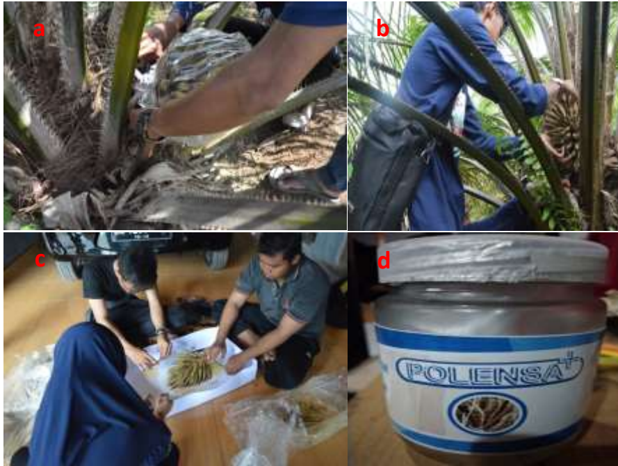
Gambar 11. Pengumpulan serbuk sari, a) Pembungkusan bunga jantan anthesis , b) Pemotongan tandan bunga jantan yang telah mekar sempurna, c) pemisahan serbuk sari dari spikelet, d) Penyimpanan serbuk sari

proses penyerbukan menggunakan botol semprot ke tubuh serangga E. kamerunikus . Selain itu juga untuk menjaga daya tahan serbuk sari. Serbuk sari disimpan dalam bentuk murni didalam freezer atau vacuum .