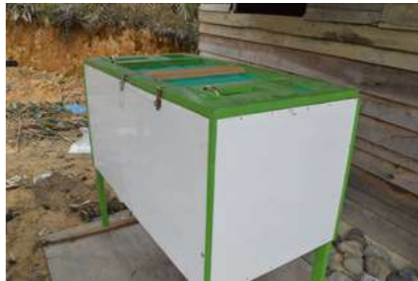
Gambar 10. Kotak hatch & carry .

Penangkaran E. kamerunikus dilakukan menggunakan kotak dengan ukuran 60 cm x 60 cm x 120 cm. Kotak terbuat dari kayu triplek dengan bagian atas berupa kain kasa yang bisa dibuka dan ditutup untuk memasukkan dan mengeluarkan E. kamerunikus . Masing-masing kotak memiliki atap dapat terbuat dari seng, asbes, atau atap rumbia untuk menghindari penyinaran langsung oleh matahari atau terkena tetesan air hujan.