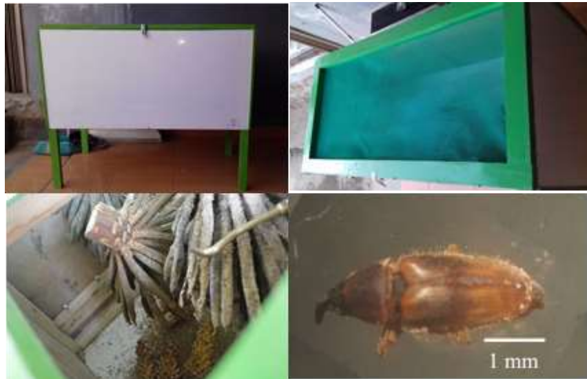
Gambar 4. Teknologi hatch & carry , a) Kotak hatch & carry tampak depan, b) Kotak hatch & carry tampak atas, c) Kotak hatch & carry bagian dalam, d) Serangga penyerbuk E. kamerunikus .

pestisida menyebabkan kematian terhadap E. kamerunikus . Untuk mengoptimalkan peran E. kamerunikus dirakit teknologi yang dikenal dengan metode hatch & carry serangga penyerbuk E.kamerunikus .