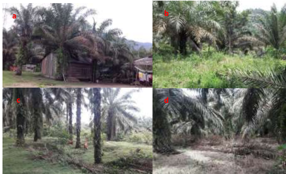
Gambar 1. Gambaran umum perkebunan kelapa sawit rakyat, a) Kelapa sawit dipekarangan, b) Kebun kelapa sawit dipenuhi gulma, c) kebun tidak produktif, d) Pelepah sisa panen berserahkan di lahan.

Pulau Punjung adalah kecamatan dengan areal perkebunan kelapa sawit terluas di Kabupaten Dharmasraya. Sebagian besar kelapa sawit yang terdapat di Kec. Pulau Punjung berbentuk perkebunan rakyat. Secara umum budidaya kelapa sawit pada perkebunan rakyat tidak dikelola secara optimal. Hal ini tidak terlepas dari minimnya pengetahuan dan keterampilan yang dimiliki petani tentang budidaya kelapa sawit. Luas perkebunan kelapa sawit yang dimiliki petani juga tergolong kecil yakni 0,7-1 ha. Bahkan budidaya kelapa sawit dilakukan pada lahan pekarangan, pinggir sawah atau kolam, disepanjang jalan dan aliran irigasi, bahkan diintegrasikan dengan kakao atau karet. Pengusahaan kelapa sawit dengan skala kecil membuat petani tidak terlalu memperhatikan standar agronomis budidaya kelapa sawit. Hal ini terlihat dari penggunaan bibit sapuan atau illegitime , pemupukan dilakukan hanya satu kali dalam satu tahun. Bahkan kegiatan pemeliharaan seperti kastrasi, pruning, dan pengendalian gulma tidak dilakukan petani.