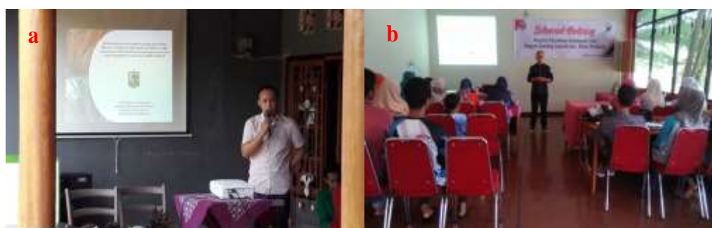
Gambar 7. Penyuluhan teknologi hatch & carry , a) Kelompok tani mitra, b) Kelompok tani non mitra

terdapat di Nagari Gunung Selasi dan masih pada kecamatan yang sama dengan kelompok tani mitra. Partisipasi beberapa kelompok tani di Nagari Gunung Selasi merupakan rangkaian pemberdayaan masyarakat melalui alokasi dana desa tahun 2018. Pada kegiatan pelatihan tersebut terdapat beberapa kesempatan untuk memberikan materi tentang teknologi teknologi hatch & carry . Kegiatan penyuluhan dilakukan sebanyak satu kali, untuk pelaksanaan dilakukan disalah satu rumah warga anggota kelompok tani mitra. Kegiatan pelatihan dengan beberapa kelompok tani non mitra dilakukan di ruang serba guna hotel Sekato Jaya.