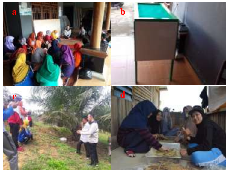
Gambar 8. Pelatihan teknologi hatch & carry , a) persiapan ke lapangan, b) pelatihan penentuan lokasi pemasangan kota hatch and carry, c) pelatihan pembuatan kotak hatch and carry, dan d) Pelatihan pengumpulan serbuk sari

Pelaksanaan pelatihan terdiri dari beberapa tahapan yakni 1) pelatihan penerapan teknologi hatch & carry serangga penyerbuk E. kamerunicus , 2) Pelatihan pembuatan pembuatan kotak hatch & carry dan bangunan pelindung kotak saat diaplikasikan di lapangan, 3) Pelatihan cara mengumpulkan dan menyimpan serbuk sari, 4) Pelatihan uji viabilitas serbuk sari, 5) pelatihan pelaksanaan penyerbukan buatan ( assistend pollination ). Kegiatan pelatihan tersebut dilakukan satu hari dan dilakukan di kebun kelapa sawit milik kelompok tani mitra. Sebelum dilakukan pelatihan di lapangan, pagi hari peserta diberikan penjelasan tentang kegiatan pelatihan yang akan dilakukan. Hal ini diharapkan dapat mempermudah pelaksanaan kegiatan di lapangan.