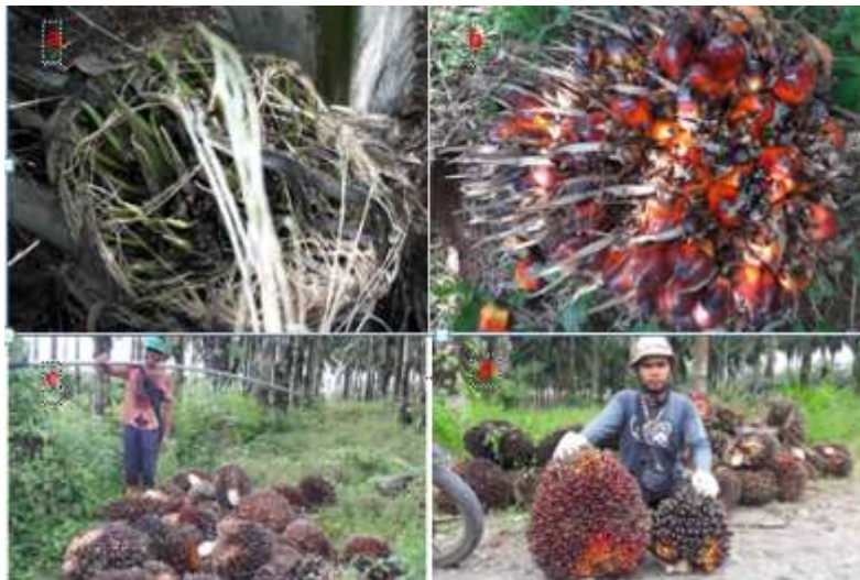
Gambar 2. a) Bunga abortus , b) Buah landak, c) Hasil panen yang terdiri dari buah landak, d) Perbandingan ukuran tandan buah normal dengan buah landak atau partenokarpi .

Pada tahun 2015 ditemukan permasalahan baru pada perkebunan kelapa sawit rakyat di Kec. Pulau Punjung. Permasalahan tersebut tidak berhubungan dengan aspek agronomis akan tetapi mengakibatkan anjloknya produksi kelapa sawit. Dimana sebagian besar tandan bunga betina tidak berkembang menjadi buah ( abortus ), sehingga persentase bunga yang menjadi buah rendah. Sebagian bunga yang berkembang menghasilkan susunan buah yang jarang dan terdapat banyak duri pada tandan tersebut. Hal ini disebabkan malformasi pada spirakel yang memanjang seperti duri karena sebagian kuncup bunga tidak berkembang menjadi buah, sehingga tandan kelapa sawit seperti hewan landak. Istilah “ buah landak ” menjadi fenomena baru di kalangan perkebunan kelapa sawit rakyat. Tandan kelapa sawit tersebut memiliki bobot yang ringan dengan kandungan rendemen yang rendah. Akibatnya TBS tersebut tidak laku dijual ke pabrik. Berdasarkan penelitian yang sudah dilakukan sejak tahun 2016 di Kec. Pulau Punjung diketahui penyebab turunnya produksi di perkebunan kelapa sawit rakyat adalah proses penyerbukan tidak optimal.