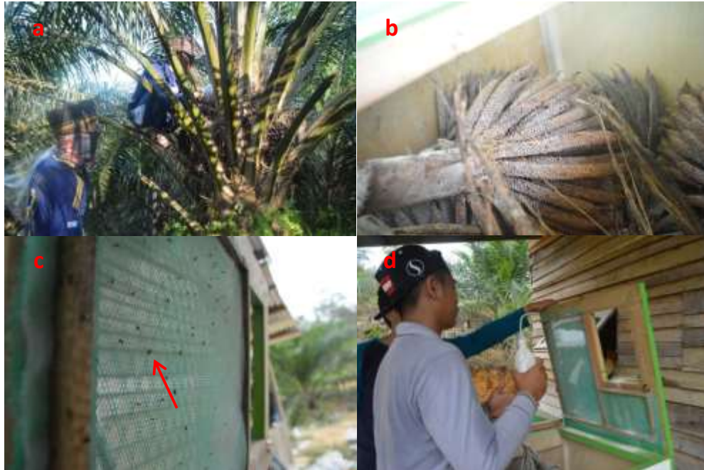
Gambar 12. Aplikasi teknologi hatch & carry , a) Pengumpulan bunga jantan lewat anthesis , b) Penempatan tandan bunga jantan dalam kotak hatch & carry , c) E. kamerunikus yang baru menetas, d) Penyemprotan serbuk sari ke E. kamerunikus sebelum pelepasan.

Kode A, B, C, D, dan E dan seterusnya merupakan kode semu setiap ruangan di dalam kotak Hatch & Carry . Kode A pada ruangan pertama, dan kode B pada ruangan kedua. Kode A akan digantikan oleh kode C, demikian juga kode B akan diganti oleh kode D, dan seterusnya.