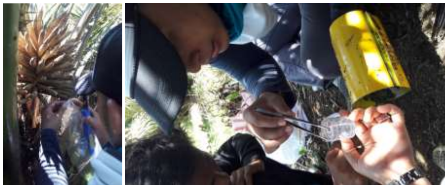
Gambar 3. Survei kelimpahan populasi Elaeidobius kamerunikus pada beberapa kecamatan di Kab. Dharmasraya.

menjadi partenokarpi (tidak terbentuk biji atau kernel) (Gambar 2.b). Rata-rata produksi kelapa sawit rakyat pada saat ini yakni \pm 1,83 ton/ha atau 21,96 ton/ha/tahun, padahal potensi produksi adalah 2,5 ton/ha atau 30 ton/ha/tahun. Buah partenokarpi cenderung muncul pada perkebunan kelapa sawit rakyat yang ditanam pada areal bukaan baru dan menggunakan bahan tanaman tertentu dengan potensi produktivitas kelapa sawit yang tinggi diawal menghasilkan. Bahan tanaman kelapa sawit seperti ini akan menghasilkan sex ratio bunga betina yang lebih tinggi, hampir meniadakan bunga jantan. Kondisi ini akan mengakibatkan ketersediaan serbuk sari tidak mencukupi untuk kebutuhan penyerbukan bunga kelapa sawit. Kondisi ini diperparah dengan ketiadaan agens penyerbuk pada ekosistem perkebunan kelapa sawit rakyat di Kec. Pulau Punjung. Salah satu agens penyerbuk kelapa sawit adalah Elaeidobius kamerunikus Faust.