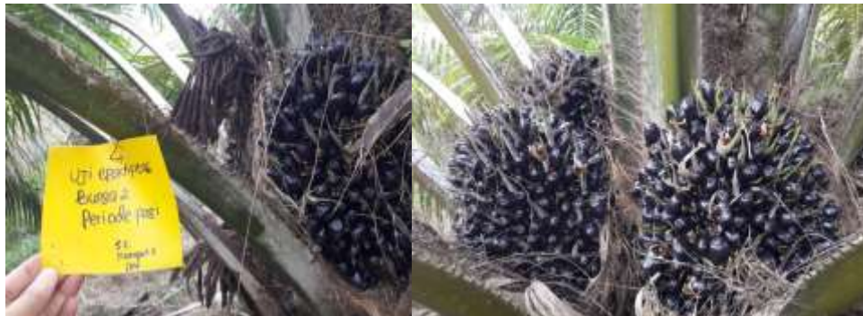
Gambar 5. Hasil uji efektifitas E. kamerunikus terlihat ukuran tandan yang besar dan kompak hasil penyerbukan yang optimal (Penelitian BOPTN tahun 2017)

Sebelum kotak hatch & carry dibuka agar serangga E. kamerunikus menyebar pada ekosistem perkebunan kelapa sawit, maka pada tubuh E. kamerunikus disemprotkan polen atau serbuk sari murni pada tubuh serangga tersebut. Pada saat kotak hatch & carry dibuka maka serangga E. kamerunikus yang sudah mengandung polen akan terbang dan mengunjungi bunga betina yang sedang reseptif. Secara alami bunga betina kelapa sawit yang sedang reseptif akan menghasilkan bau seperti adas ( Foeniculum vulgare ), sehingga E. kamerunikus tertarik untuk mendatangnya. Ketika proses interaksi antara E. kamerunikus dan bunga betina reseptif terjadi, maka akan terjadi proses polinasi atau penyerbukan karena pada tubuh kumbang tersebut sudah terdapat polen. Serangga E. kamerunikus yang sudah dilepaskan pada ekosistem perkebunan rakyat akan ekstablis dan berkembang secara alami.