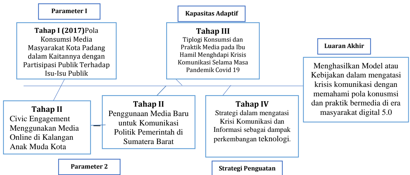
Gambar 3-1 Diagram Fishbone Penelitian

Dalam bab ini akan terlihat uraian tahapan penelitian dengan diagram fishbone sesuai dengan roadmap penelitian yang telah disusun beserta luaran tahap akhirnya. Berikut gambaran tahapan penelitian tersebut: