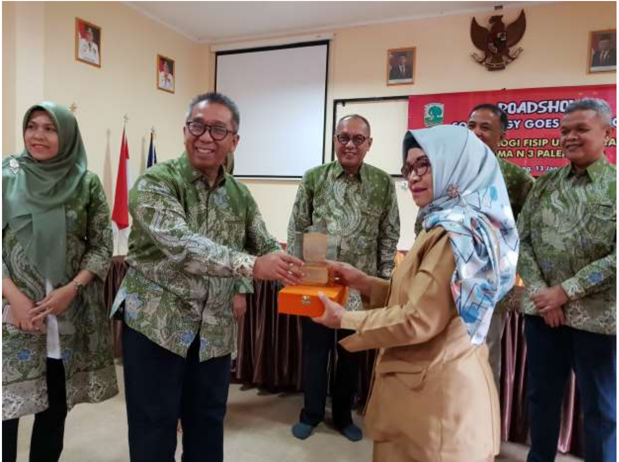
Foto: Penyerahan Kenangan-Kenangan