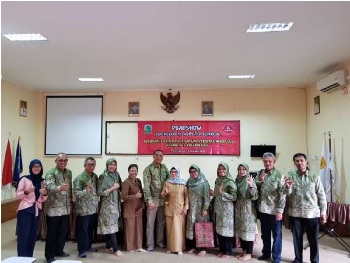
Foto: Tim Bersama dengan Guru