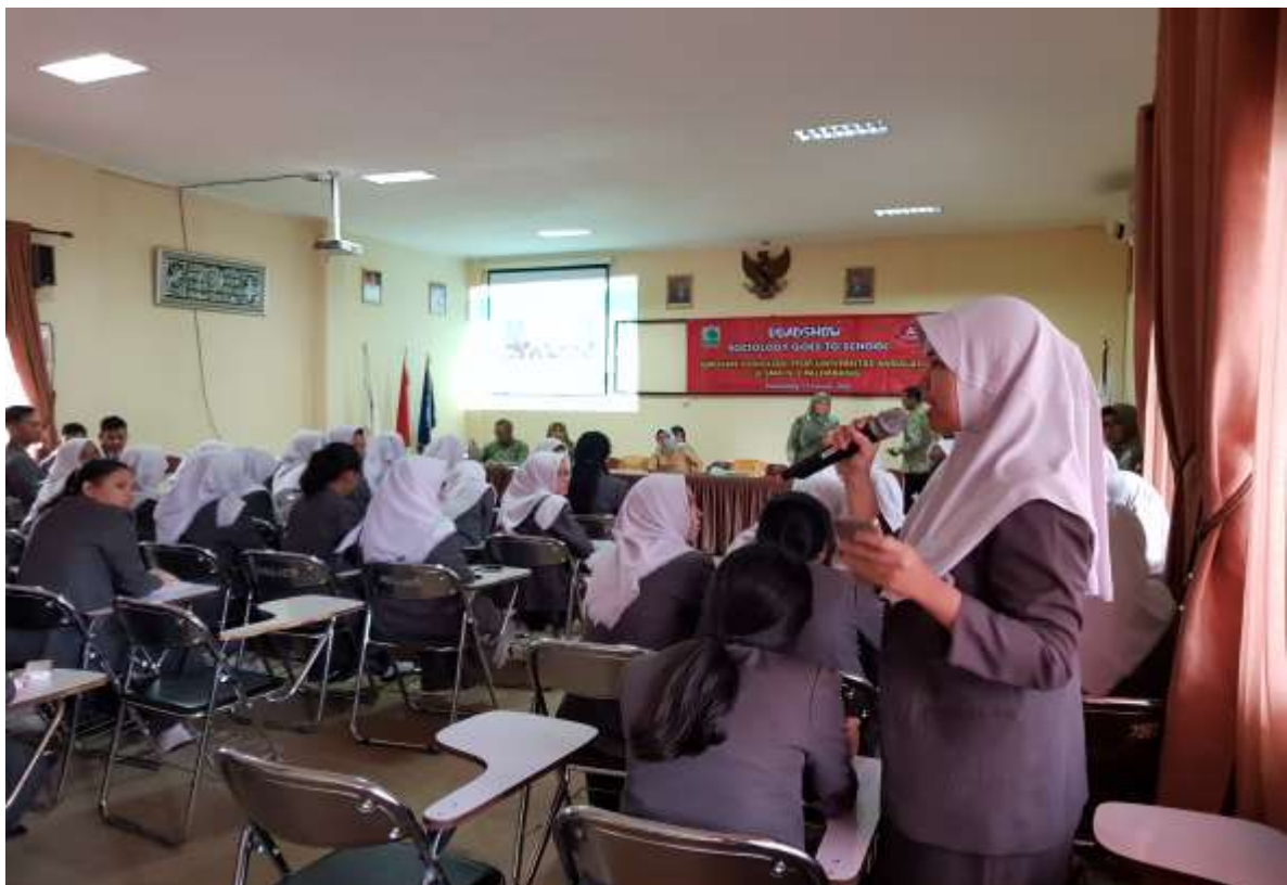
Foto: Siswa Bertanya