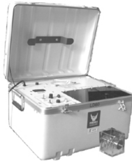
Gambar 1 Perangkat pengukuran tegangan tembus Liquid Dielectric Test Set , Model LD60

Pengujian tegangan tembus dilakukan dengan menggunakan peralatan Liquid Dielectric Test Set , Model LD60, produksi Phenix Technologies yang tercantum dalam gambar 1. Untuk keperluan pengukuran, dipilih laju kenaikan tegangan 2 kV/s dan jarak antar elektroda 2,5 mm. Input yang digunakan adalah 220 V AC, 50 Hz, 1 fasa, dengan arus sebesar 2,5 A, sedangkan outputnya 0-60 kV AC. Pengetesan dilakukan pada temperatur ruang, 25 °C, 40 °C dan 60 °C.