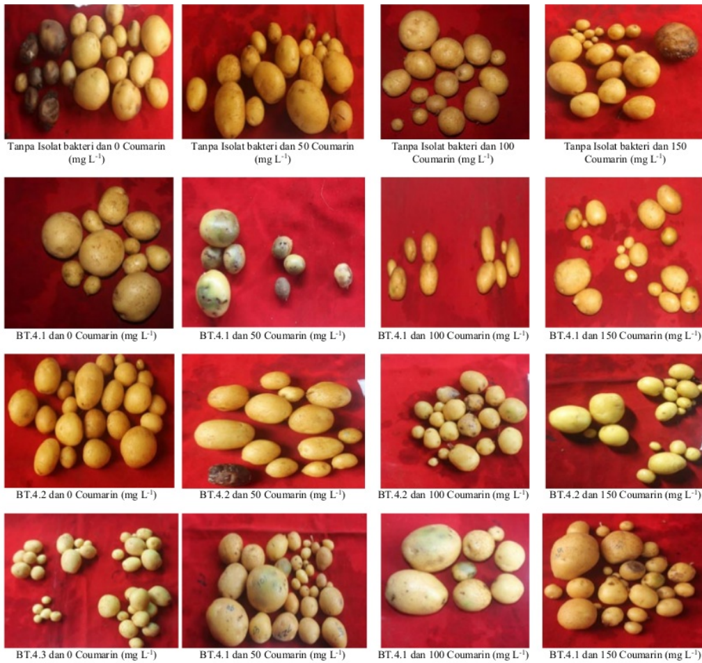
Gambar 2. Umbi kentang Granola setelah panen pada umur 100 HST

Keterangan: *Angka-angka pada arah vertikal yang diikuti huruf kecil yang sama berbeda tidak nyata berdasarkan uji BNJ taraf 5%. **Data yang disajikan adalah data asli, untuk sidik ragam dan BNJ adalah data transformasi \sqrt{X + 1}