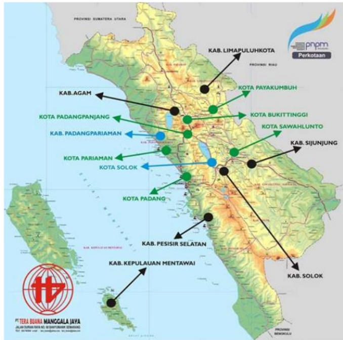
Gambar 1.1 Peta Sumatera Barat

Melihat posisi Kabupaten yang ada di Sumatera Barat berada di daerah daratan dan pesisir pantai, peneliti tertarik untuk melakukan penelitian hanya nagari yang berada pada daerah-daerah tersebut. Penelitian tersebut diharapkan mendapatkan produk unggulan masing-masing nagari tersebut serta didapatkannya rumusan strategi inovasi terhadap produk unggulan masing-masing nagari tersebut.