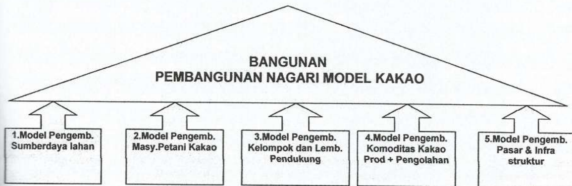
Gambar 3.1. Struktur pembangunan nagari model kakao

Peranan dari unsur-unsur ini dalam membangun NMK dapat digambarkan pada Gambar 3.1 berikut ini.