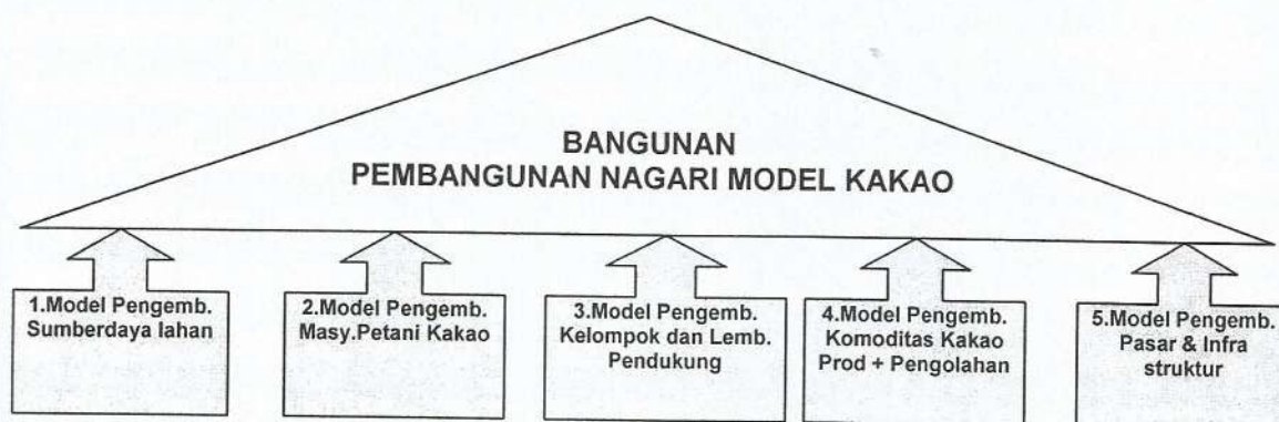
Gambar 3.1. Struktur pembangunan nagari model kakao