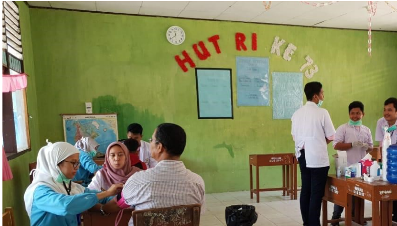
Gambar 5. Tindakan oleh dokter gigi muda Fakultas Kedokteran gigi Unand