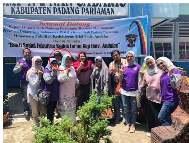
Gambar 2. Tim Fakultas Kedokteran Gigi Unand, PDGI Padang Pariaman beserta Ibu Bupati Padang Pariaman