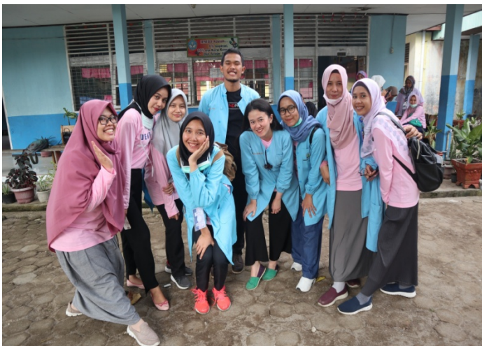
Foto bersama dokter gigi muda