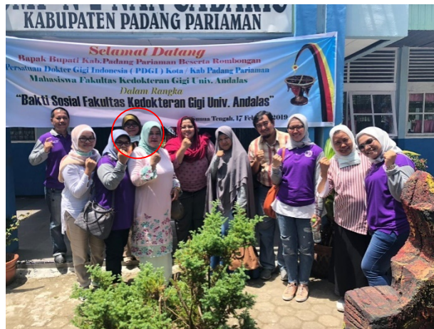
Tim Fakultas Kedokteran Gigi Unand, PDGI Padang Pariaman beserta Ibu Bupati Padang Pariaman