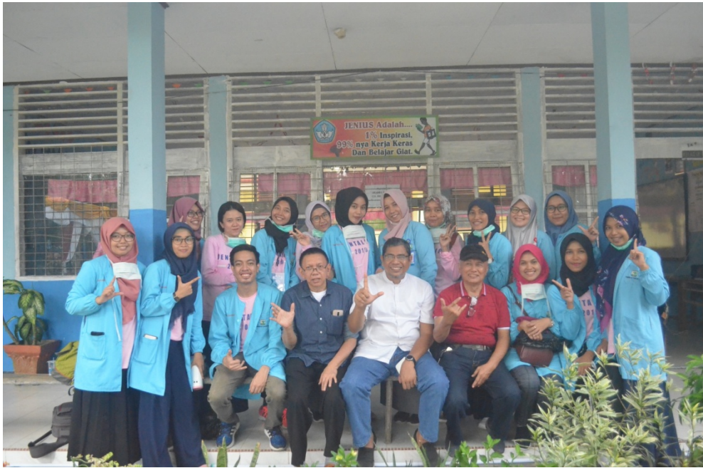
Foto bersama dosen dengan dokter gigi muda