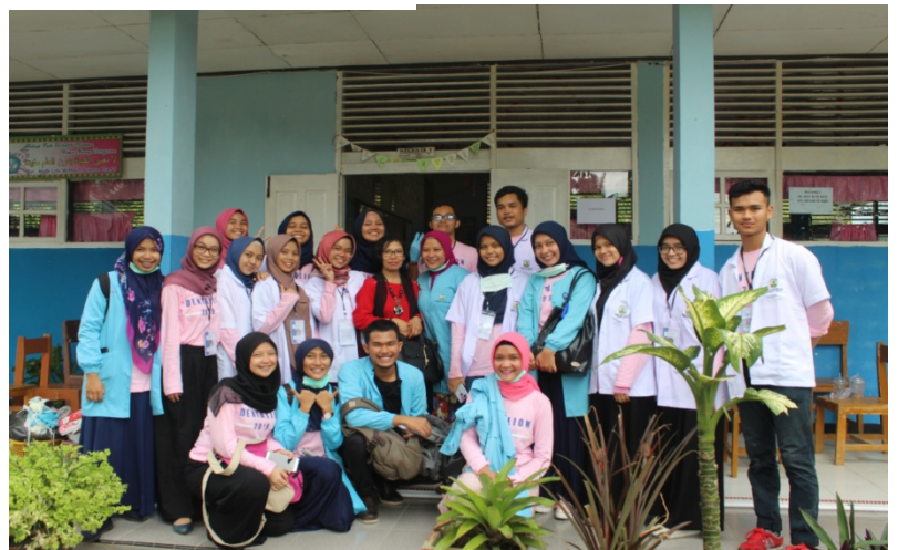
Foto bersama operator dan asisten operator