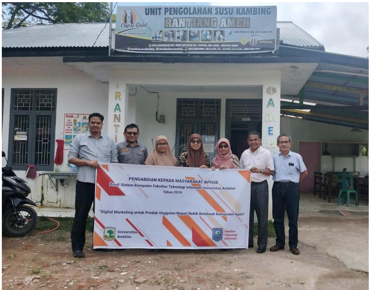
Gambar 4. Kegiatan Survey Umpan Balik

Tahapan terakhir adalah survey umpan balik yang dilaksanakan pada tanggal 12 Desember 2019, untuk mendapatkan respon dan koreksi dari UPS Rantiang Ameh tentang sistem pemasaran digital yang telah diimplementasikan. Survey ini juga untuk mendapatkan input dan saran perbaikan dari UPS rantiang ameh untuk sistem pemasaran