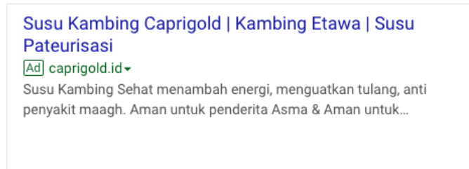
Gambar 8. Tampilan Iklan Susu Caprigold di mesin pencari Google.

Untuk menarik calon pembeli baru iklan pada mesin pencari google juga diterapkan sehingga pembeli yang tertarik dengan produk susu kambing atau khasiat yang ditawarkan oleh susu kambing dapat diarahkan ke alamat website susu Caprigold ( http://caprigold.id ). Tampilan iklan yang dijalankan pada mesin pencari google dapat dilihat pada Gambar 8 berikut ini.