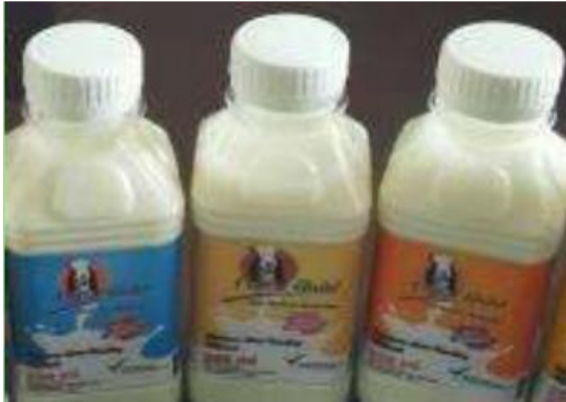
Gambar 1. Susu Kambing UPS Rantiang Ameh