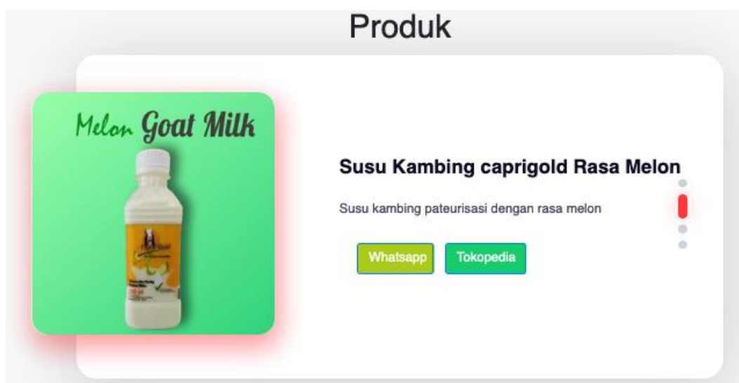
Gambar 7. Tampilan website yang mengarahkan calon pembeli ke marketplace

Website juga akan mengarahkan pembeli kepada alamat marketplace yang dimiliki oleh UPS rantiang ameh pada Tokopedia yang dapat ditunjukkan pada Gambar 7 berikut. Pada bagian ini calon pembeli juga dapat mengontak UPS rantiang ameh melalui whatsapp.