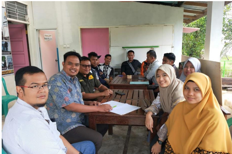
Gambar 2. Kegiatan Survey Lapangan

Kegiatan pengabdian ini dibagi menjadi 3 tahapan eksekusi. yaitu survey lapangan, implementasi system pemasaran digital dan umpan balik.