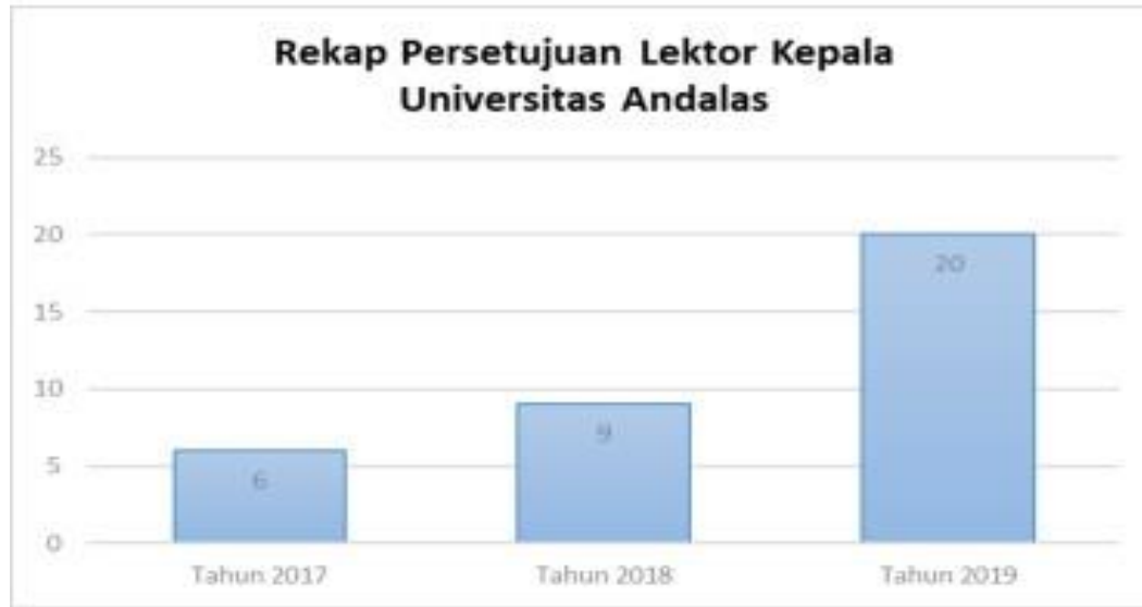
Gambar 1: Jumlah Persetujuan Dosen Menjadi Lektor Kepala dan Guru Besar, Tahun 2019