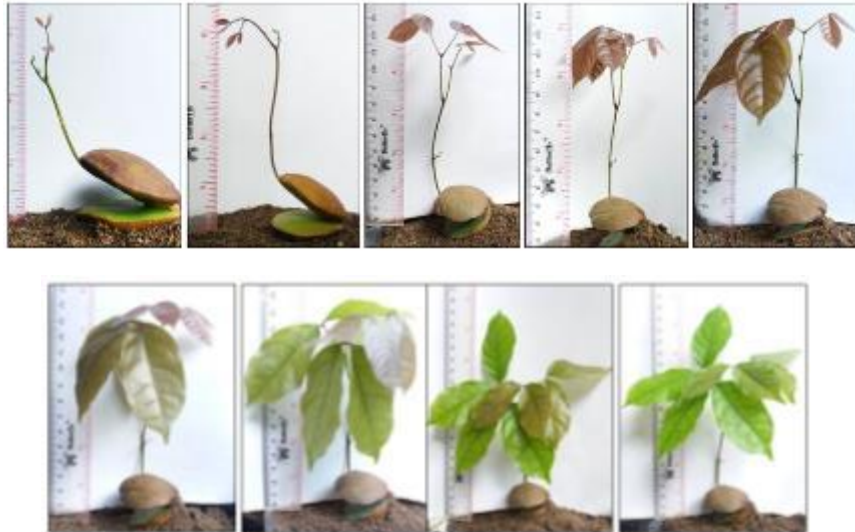
Gambar 6. Munculnya daun pertama jengkol pada hari ke 29, membukanya daun pertama pada hari ke 31, daun pertama berwarna merah pekat pada hari ke 34, daun pertama berwarna coklat pekat pada hari ke 37, daun pertama berwarna coklat pada hari ke 40, daun pertama berwarna coklat muda pada hari ke 42, daun berwarna hijau kecoklatan pada hari ke 44, daun pertama berwarna hijau pada hari ke 46, terbentuk bibit jengkol pada hari ke 48

Daun pertama muncul dalam keadaan tertutup di ujung epikotil, munculnya pada hari ke 29 dan membuka sempurna dua hari kemudian yaitu pada hari ke 31. Daun jengkol mengalami perubahan warna mulai dari terbukanya daun sampai menjadi bibit. Mulanya saat membukanya daun pertama berwarna merah, berwarna merah pekat pada hari ke 34, berwarna coklat pekat pada hari ke 37, berwarna coklat pada hari ke 40, berwarna coklat muda pada hari ke 42, berwarna hijau kecoklatan pada hari ke 44, mulai berwarna hijau pada hari ke 46. Jengkol yang sudah memiliki daun berwarna hijau seluruhnya pada hari ke 48 ini dapat dikatakan sebagai bibit jengkol.