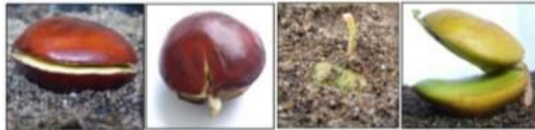
Gambar 2. Merekahnya benih pada hari ke 4, munculnya radikula pada hari ke 5 dan epikotil pada hari ke 18, melepasnya seedcoat pada hari ke 25.

muncul satu hari setelah benih mekah, yaitu hari ke 5 dengan warna putih dan tumbuh terus-menerus menjadi akar pokok sehingga membentuk sistem akar tunggang. Munculnya epikotil, yakni ruas antara kotiledon dengan titik tumbuh daun pertama pada hari ke 18, tahapan ini terjadi selama 12 hari. Pertumbuhan epikotil mulai dari munculnya epikotil sampai munculnya daun pertama. Tahap pertumbuhan epikotil berlangsung selama 12 hari. Mulai dari hari ke 18 sampai hari ke 26, jengkol mengalami penambahan panjang yang hampir sama yaitu kurang dari 1 cm setiap hari. Pada hari ke 27, 28, dan 29 epikotil jengkol mengalami peningkatan penambahan panjang yaitu lebih dari 1 cm setiap hari. Penyerapan air menyebabkan melunaknya seedcoat sehingga seedcoat terlepas dari benih, umumnya seedcoat terlepas dari benih pada hari ke 25 (gambar 2).