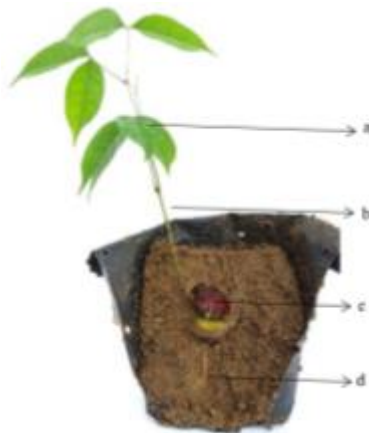
Gambar 5. Tipe perkecambahan benih jengkol.

Menurut Wulff (1986), ukuran benih berkorelasi positif dengan luas area dan berat kotiledon. Sejalan dengan penelitian yang dilakukan oleh Zhang (1993) pada Cakile edentula dan oleh Stamp (1990) pada Erodium brachycarpum bahwa benih kecil berkecambah lebih cepat dibandingkan benih besar. Stamp (1990) mengemukakan bahwa benih berukuran kecil yang berkecambah lebih awal berhubungan dengan akses terhadap air yang lebih besar karena memiliki rasio perbandingan luas bidang serap per volume yang lebih tinggi sehingga benih berukuran kecil menyerap air lebih cepat. Namun tidak selalu benih berukuran kecil akan lebih cepat berkecambah daripada benih berukuran besar. Rayan dan Cahyono (2011) menyatakan bahwa rata-rata daya kecambah benih Shorea leprosula menunjukkan kecenderungan semakin besar sejalan dengan semakin meningkatnya ukuran benih. Benih yang memiliki ukuran besar berindikasi memiliki lebih banyak cadangan makanan dibanding dengan benih ukuran sedang dan kecil. Dengan cadangan makanan yang lebih banyak maka benih berukuran besar mempunyai daya kecambah dan kecepatan berkecambah yang lebih besar dan cepat dibanding dengan ukuran benih yang lebih kecil.