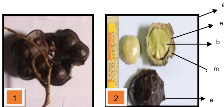
Gambar 1. Tandan buah (1) dan struktur biji jengkol (2)

Waktu perkecambahan sering menjadi prediktor apakah penggunaan benih tersebut dalam upaya perbaikan kualitas bibit akan berhasil. Forbis (2010) menyatakan bahwa fenologi perkecambahan merupakan komponen penting pada potensi keberhasilan dalam sebuah perbaikan penyemaian. Fenologi yang dilaporkan adalah tahapan perkecambahan benih sampai stadia bibit. Benih yang digunakan adalah tipe bareh jumlah buah pertandan 4-9 buah dan terdapat organ eksokarp, mesokarp, endokarp, embrio, biji (Gambar 1).