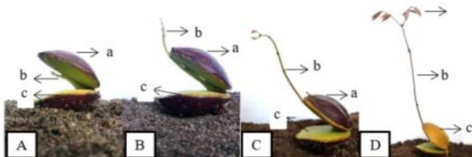
Gambar 4. Warna epikotil jengkol. (A) epikotil berwarna putih kekuningan; (B) epikotil berwarna kuning kehijauan; (C) Epikotil berwarna hijau kecoklatan; (D) Epikotil berwarna coklat muda; (a) seedcoat ; (b) epikotil; (c) kotiledon; (d) daun pertama.

Pertumbuhan epikotil ditandai dengan penambahan panjang yang berlangsung selama 12 hari, mulai hari ke 18 sampai hari ke 26, pertambahan panjangnya merata yaitu kurang 1 cm setiap hari. Hari ke 27, 28, dan 29 epikotil jengkol bareh mengalami penambahan panjang lebih 1 cm setiap hari (gambar 3). Pada tahapan ini disertai dengan perubahan warna epikotil mulai dari putih kekuningan, kuning kehijauan, hijau kecoklatan, dan coklat muda (gambar 4).