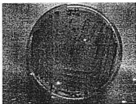
Gambar 1: Isolat Vibrio parahaemolyticus hasil isolasi pada media CHROMagar Vibrio

ini mengandung senyawa kromogenik yang dapat membedakan beberapa spesies dalam genus Vibrio (Hara-Kudo et al. , 2001).