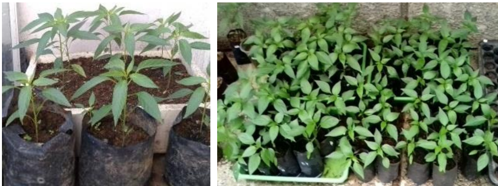
Gambar 3. Pertumbuhan bibit cabai setelah perlakuan perendaman benih cabai dengan suspensi cendawan B.bassiana pada usia 5 MST