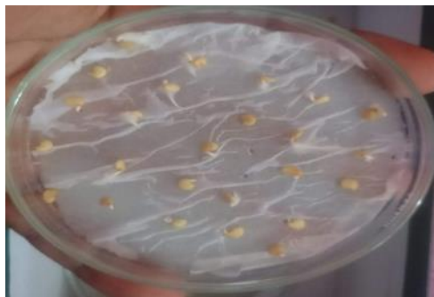
Gambar 1. Uji perendaman benih cabai dengan suspensi cendawan B.bassiana di laboratorium

waktu perendaman benih dengan suspensi B.bassiana , isolat gandum merupakan isolat yang paling tinggi pengaruhnya terhadap perkecambahan benih cabai, dengan data ini dapat dianjurkan untuk memicu perkecambahan benih dapat mengaplikasikannya dengan suspensi B.bassiana isolat gandum. Data pengaruh cendawan endofit terhadap perkecambahan benih cabai dapat dilihat pada Tabel 1 dan Gambar 2. Inokulasi cendawan endofyt pada benih dapat meningkatkan persentase perkecambahan. Menurut Dearnaley dan Brocque (2006), kolonisasi cendawan endofyt memiliki peran penting pada saat perkecambahan. Pada saat benih berkecambah, benih hanya memiliki sedikit kandungan nutrisi esensial. Pada saat benih berkecambah, hifa cendawan endofyt mengkolonisasi jaringan tanaman dan membentuk struktur yang disebut pelotons. Struktur tersebut digunakan cendawan endofyt untuk melakukan pertukaran nutrisi, sedangkan benih mendapatkan suplai gula substansi anorganik (nitrogen dan fosfor) yang berguna bagi pertumbuhan tanaman muda. Beberapa cendawan endofyt memproduksi fitohormon seperti auksin, sitokinin dan etilen (Bacon et al, 2001; Tan and Zou, 2001).