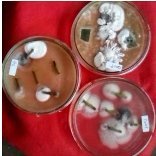
Gambar 4. Kolonisasi cendawan endofyt pada tanaman cabai berumur 7 mst pada perlakuan berbagai waktu perendaman benih cabai dengan suspensi B. bassiana