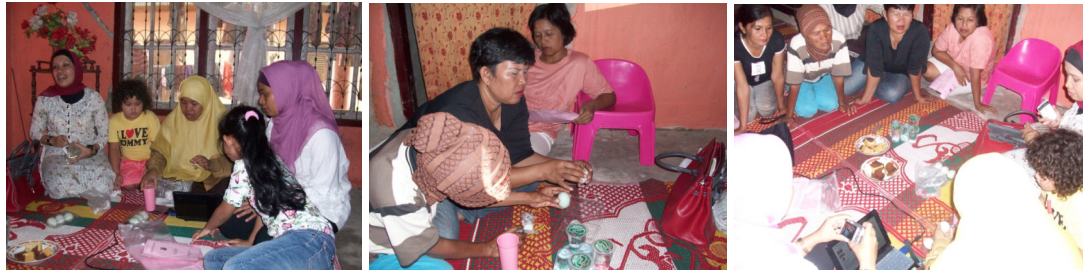
Gambar 4. Dokumentasi Pengabdian (dari kiri ke kanan : demonstrasi, pelatihan, dan antusiasme pengusaha)

Telur asin rebus sicincin mempunyai daya tahan simpan yang pendek, hanya tahan 2 hari. Hal inilah yang menyebabkan pemasaran telur asin tidak dapat terlalu jauh atau perlu penanganan yang ekstra untuk memasarkannya ke daerah yang lebih jauh. Penyuluhan telur asin tentang nilai gizi dan pengawetannya mendapat sambutan hangat oleh kelompok usaha telur asin sicincin.