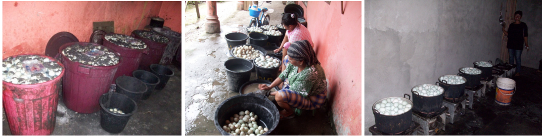
Gambar 3. Proses Produksi Telur Asin Sicincin (dari kiri kekanan : pengasinan, pencucian, perebusan)