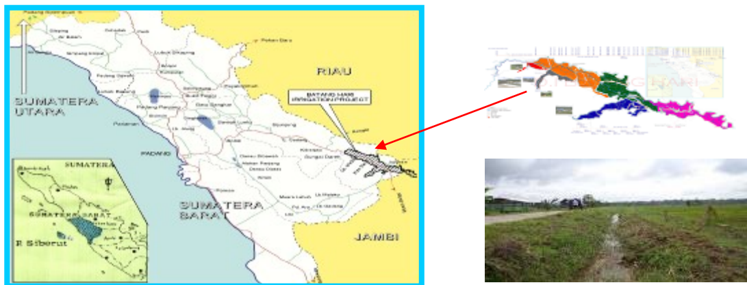
Gambar 1. Lokasi Penelitian: Kabupaten Dharmasraya, Provinsi Sumatera Barat

Irigasi Batang Hari dibangun di Kabupaten Dharmasraya pada tahun 1997 dan selesai pada tahun 2009. Pengoperasian dan pemeliharaan Jaringan Irigasi ini di perlukan untuk tercapainya hasil panen padi dalam rangka pemenuhan kebutuhan pangan bagi masyarakat, dan juga sangat berpengaruh pada perkembangan wilayah. Termasuk peran serta petani pemakai air (P3A) dilapangan. Merujuk pada penelitian yang dilakukan Nasrul sebelumnya yaitu lebih focus/ditekankan pada pendistribusian air di saluran Induk dan Sekunder (th 2015). Kuesioner dilapangan dengan wawancara langsung ke pengurus dan petani anggota P3A yang merujuk pada penelitian Bustanul yang terdahulu (2016), Yaitu dengan menentukan jumlah dan ukuran sampel menggunakan teknik Solvin (Siregar, 2003) serta perhitungan korelasi dengan perangkat lunak SPSS versi15. Adapun perumusan masalah dalam penelitian ini adalah tentang ketersediaan air untuk sawah-sawah dan kelengkapan Petugas untuk operasional dan pemeliharaan infrastruktur jaringan irigasi termasuk peran serta petani pemakai air (P3A) ditingkat tersier yang di terapkan pada Daerah Irigasi Batang Hari di Kabupaten Dharmasraya, dengan lokasi penelitian dapat dilihat pada gambar 1 di bawah ini.