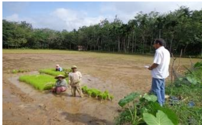
Gambar 4. Wawancara langsung dengan petani

Merujuk pada penelitian Bustanul terdahulu, disini peneliti juga melakukan penelitian peran serta P3A DI Batang Hari dalam O&P jaringan tersier dengan wawancara langsung dengan pengurus dan petani dilapangan melalui kuesioner, seperti gamba 4 dibawah ini.