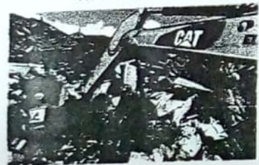
In Picture: Proses Evakuasi Korban Gempa Palu di Perumnas Balaroa