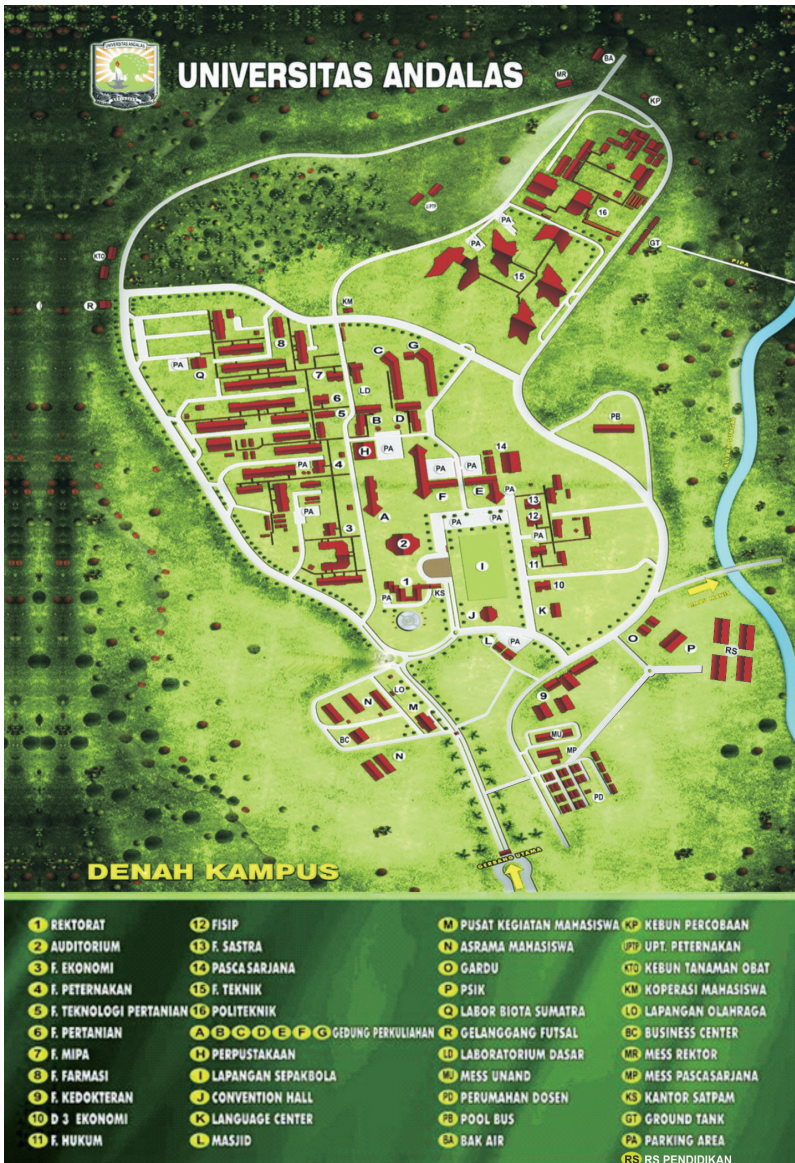
Gambar 1. Denah Lokasi Kegiatan PKKMB Tingkat Fakultas