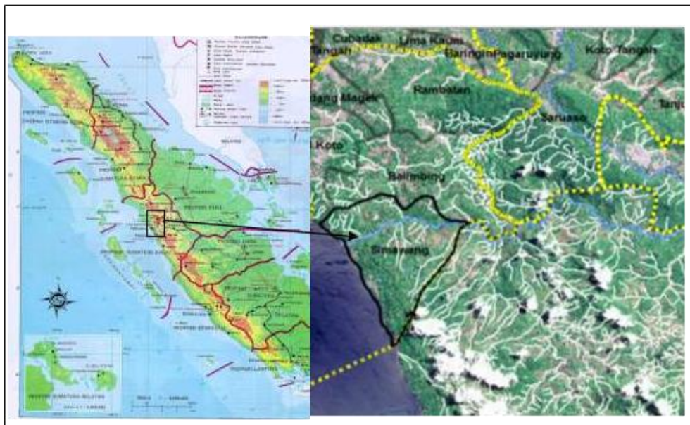
Gambar 3. Peta Nagari Simawang

Secara administratif Nagari Simawang merupakan bagian dari Kecamatan Rambatan, Kabupaten Tanah Datar Sumatera Barat. Nagari ini memiliki jumlah penduduk 9.000 jiwa yang terdiri dari 1.952 KK. Mayoritas masyarakat nagari Simawang bekerja di sektor pertanian dengan profesi utama sebagai petani. Berdasarkan data penerima Raskin tahun 2015, diketahui bahwa seperempat dari total KK di Nagari Simawang terdaftar sebagai penerima raskin. Jadi berdasarkan data ini dapat disimpulkan bahwa jumlah rumah tangga miskin di Nagari Simawang cukup banyak.