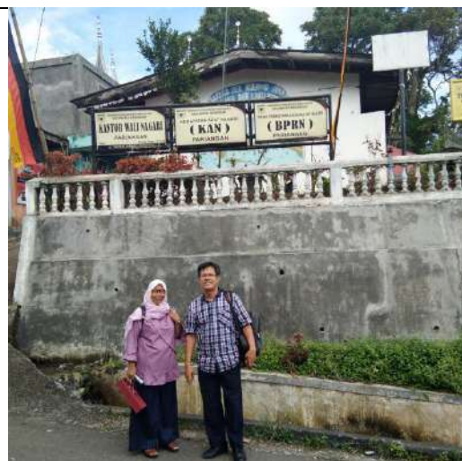
Usai workshop, anggota tim