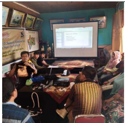
Demonstrasi baju kaus bertema Bukittinggi di hadapan peserta workshop. Pariangan, 21 Nove,ber 2018.