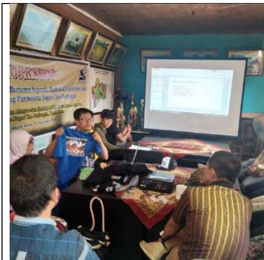
Demonstrasi baju kaus bertema Pariangan di hadapan peserta workshop. Pariangan, 21 Nove,ber 2018.

Sebagai pembanding, tim juga memperagakan souvenir produk Pariangan khususnya yang dihasilkan souvenir produk Pusat Kreatifitas Anak Nagari (PKAN) Pariangan.