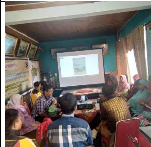
Diskusi dan tanya jawab dengan anggota Komunitas Nagari Tuo Pariangan.