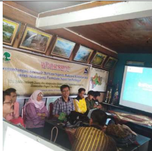
Tanya jawab dan diskusi dengan peserta Workshop.