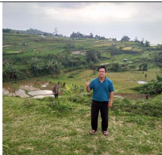
Gambar 2: Panorama sawah yang berjenjang di nagari Pariangan (Foto Israr 12-08-18).

Namun denyut pariwisata di Pariangan masih parsial. Popularitas Pariangan yang berdampak ke tren kenaikan jumlah kunjungan wisatawan ke nagari tuo ini belum diiringi ketersediaan dan kelengkapan sarana dan prasarana yang diperlukan dan dibutuhkan para turis. Salah satunya adalah souvenir, merchandise , gift atau cenderamata yang akan dibawa atau sekedar oleh-oleh wisatawan sekembali ke tempat asalnya.