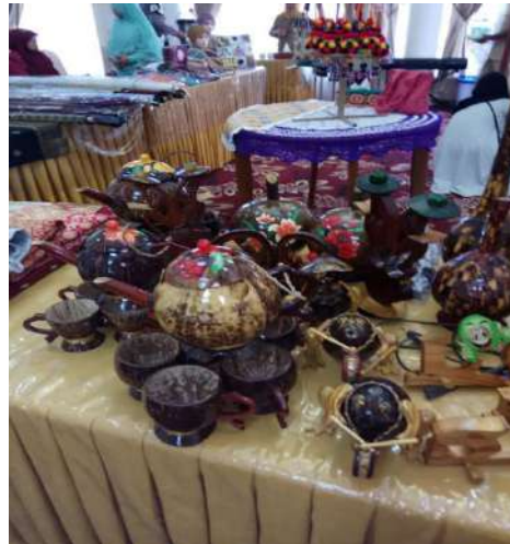
Gambar 4: Beberapa kerajinan karya masarakat Pariangan yang diwadahi Komunitas Nagari Tuo Pariangan.