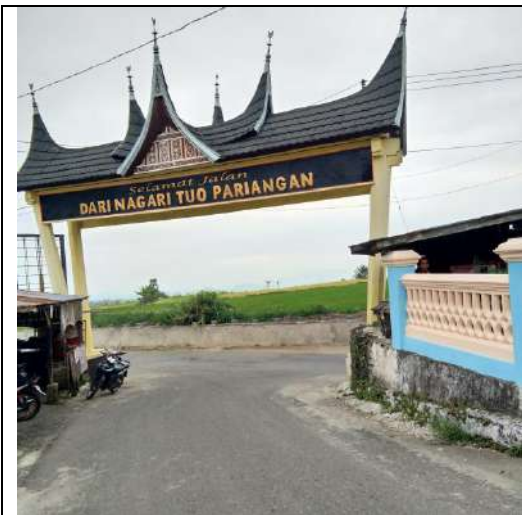
Gambar 1: Pintu gerbang Nagari Tuo Pariangan

Sejak dirilis majalah pariwisata Amerika Travel Budget sebagai salah satu desa terindah di dunia, nagari Pariangan, Tanah Datar, Sumatera Barat tak hanya mendadak menjadi terkenal, tetapi secara perlahan juga mulai merasakan dampak ekonomi dari sektor pariwisata. Kahadiran sejumlah home stay dan warung-warung baru yang menjual keperluan dan kebutuhan wisatawan menunjukkan adanya pengaruh pariwisata terhadap kegiatan ekonomi nagari.