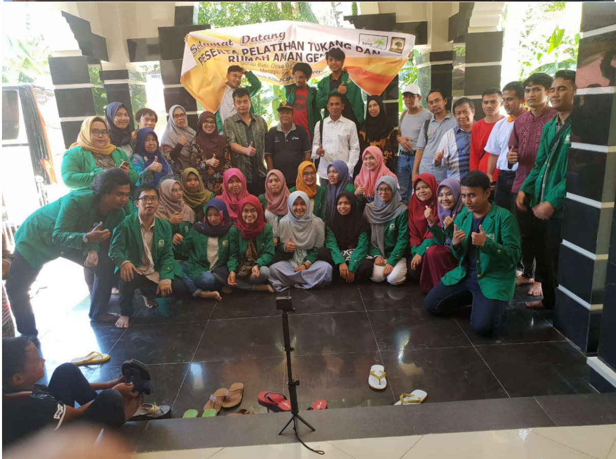
Foto 1-2. Foto Bersama di depan Surau Batu Desa Batang Tajongkek. Dosen Teknik Sipil Unand, bersama Kepala Desa beserta perangkatnya, mahasiswa KKN dan Masyarakat.