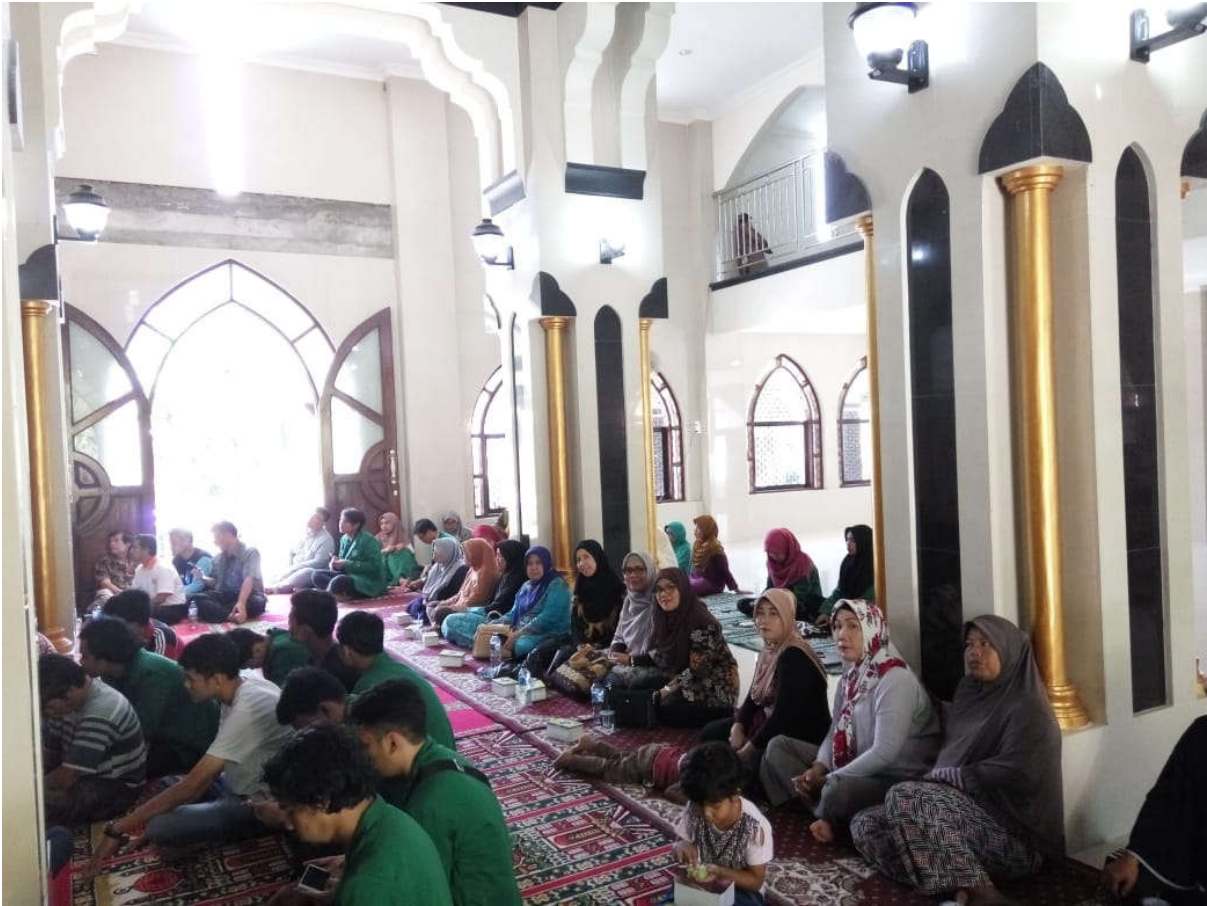
Foto 7. Peserta Pelatihan Materi Rumah Aman Gempa, yang terdiri dari Para Tukang, Perangkat Desa, Masyarakat sekitar dan Mahasiswa KKN Tematik Kebencanaan Universitas Andalas.