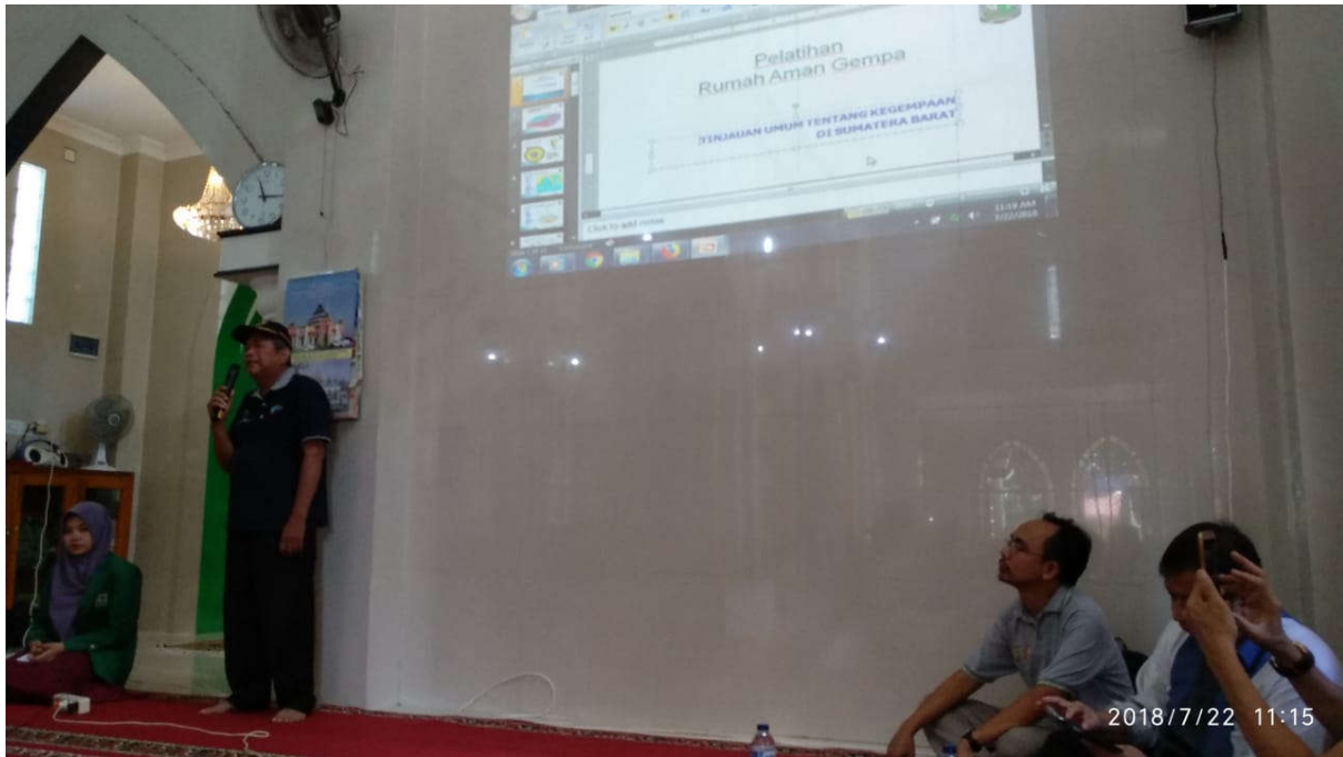
Foto 3. Sambutan oleh Kepala Desa Batang Tajongkek, Kec. Pariaman Selatan.