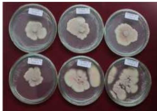
Gambar 3. Jamur Paecilomyces pada media PDA pada umur 14 hari

Jamur Paecilomyces yang dipakai adalah hasil penelitian tahun ke 1. Untuk menjaga patogenisitas jamur untuk tetap tinggi dilakukan peremajaan pada kelompok telur nematoda Meloidogyne spp. , kemudian diperbanyak pada media PDA.