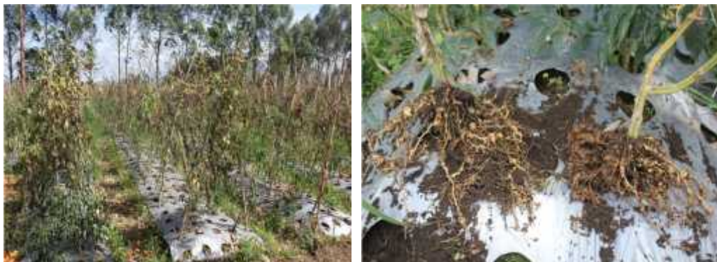
Gambar 5. Pertanaman tomat yang terserang nematoda bengkak akar (a), dan gejala bengkak akar pada tanaman tomat (b)

Lokasi demplot dipilih bekas pertanaman tomat yang terserang nematoda bengkak akar di daerah Batu Bagirik, Alahan Panjang, kabupaten Solok.