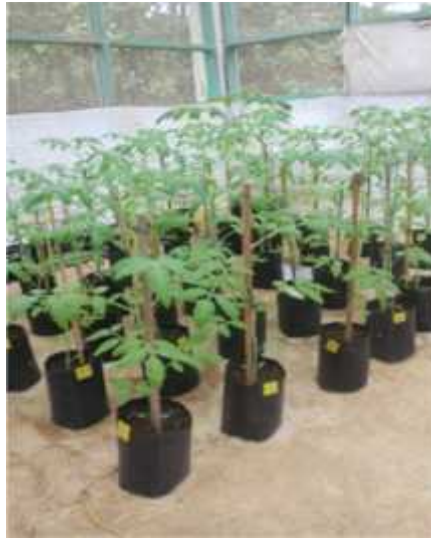
Gambar 4. Tanaman tomat di rumah kaca sebagai tanaman indikator pada pengujian bahan organik.

Hasil pengamatan rata-rata jumlah koloni jamur Paecilomyces yang terbentuk pada tanah rizosfer tanaman tomat ditampilkan pada Tabel 1.