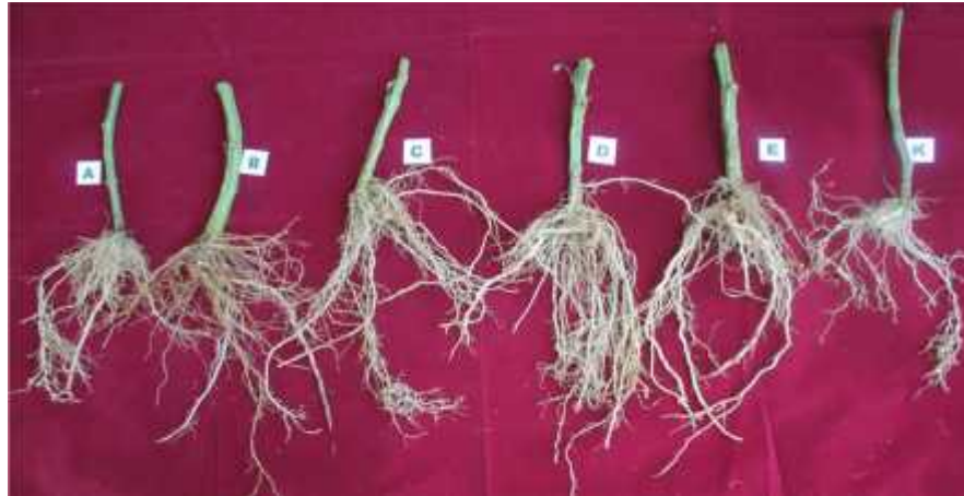
Gambar 8. Pertumbuhan akar tomat pada umur 110 hari setelah penanaman. A (perlakuan 20 hari sebelum tanam), B (perlakuan 15 hari sebelum tanam), C (perlakuan 10 hari sebelum tanam), D (perlakuan 5 hari sebelum tanam), E (perlakuan saat tanam), dan E (kontrol).