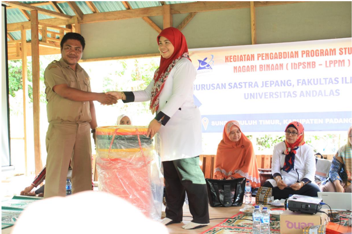
(Gambar 10 Penyerahan Tempat Sampah untuk pemilahan sampah oleh Ketua Jurusan Sastra Jepang)