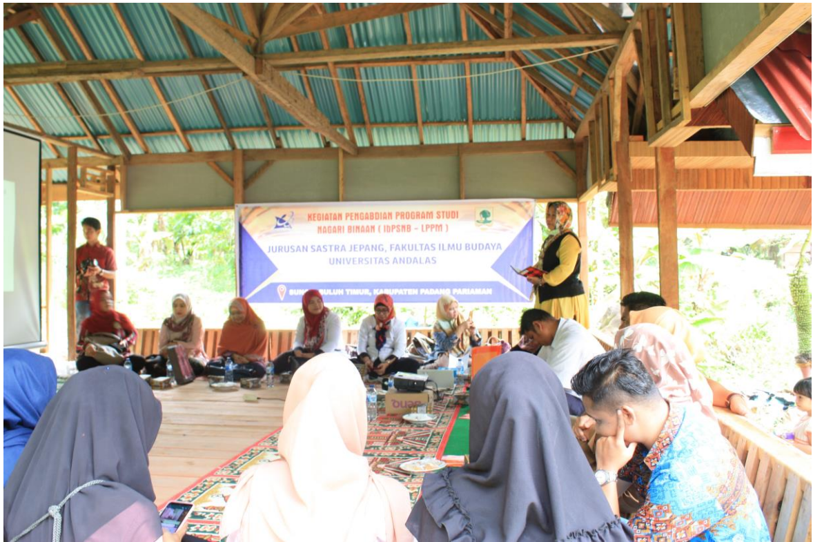
(Gambar 4 Pembukaan Sosialisasi Pengelolaan Sampah)