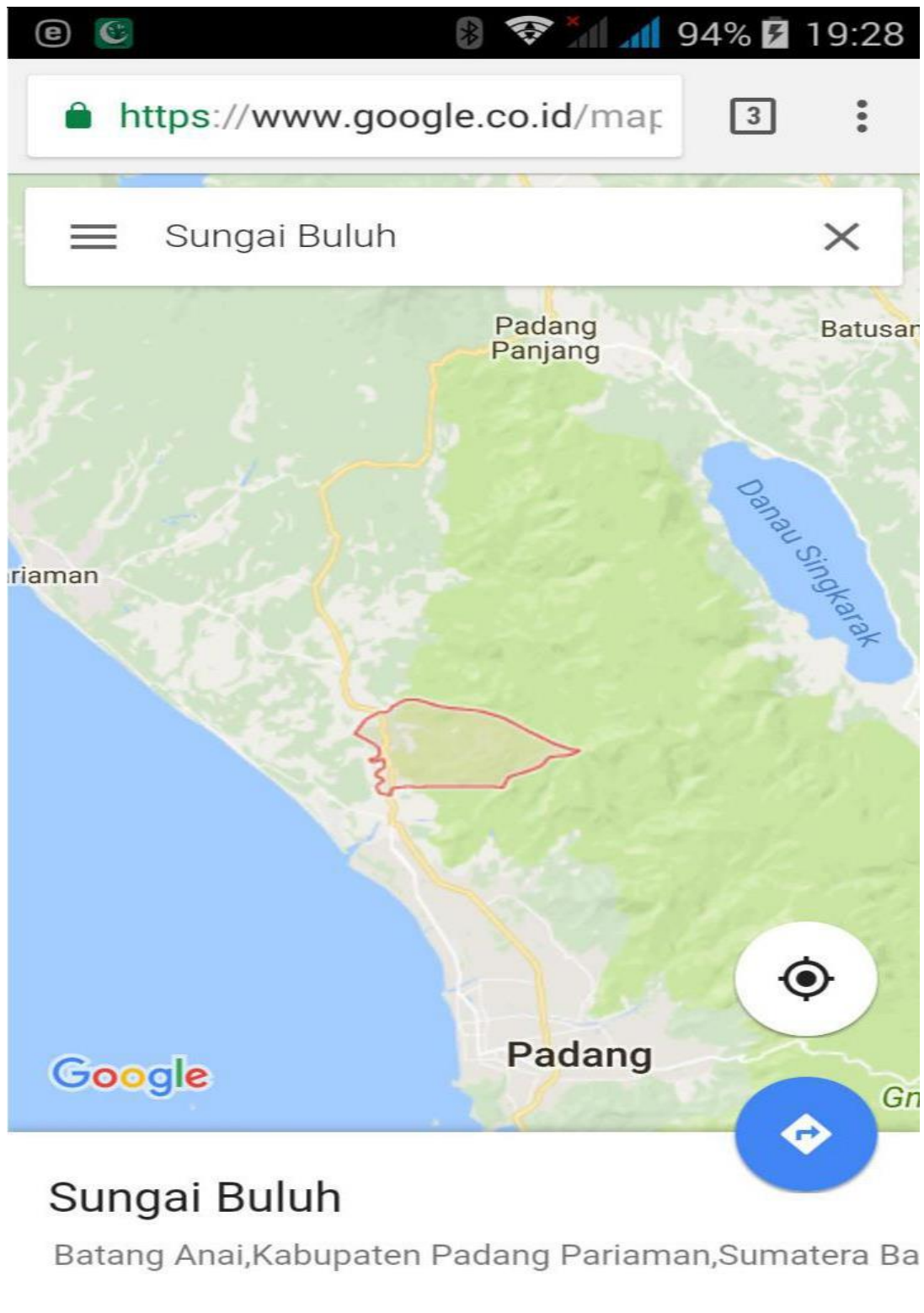
Lampiran 2. Peta Lokasi Wilayah yang menunjukkan jarak PT Pengusul dan PT Mitra dengan lokasi wilayah sasaran.