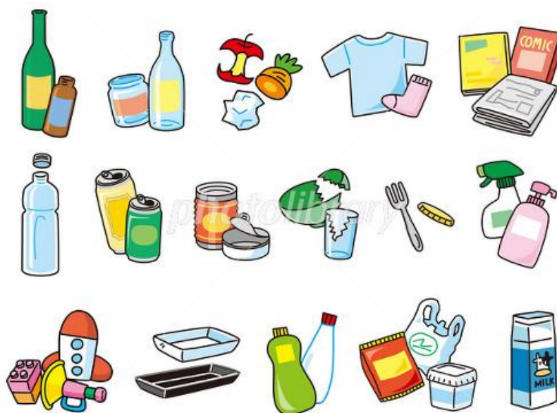
(Gambar 11 Variasi Sampah di Jepang)

Jepang salah satu negara maju yang terkenal dengan kebersihannya meskipun jumlah penduduknya sangat banyak. Hal ini tentunya disebabkan oleh sudah adanya kesadaran akan pentingnya pengelolaan sampah. Pengelolaan sampah di Jepang dikenal dengan sebutan Gomi Bunbetsu (ゴミ分別) yaitu memilah-milah sampah berdasarkan jenisnya. Secara garis besar jenis-jenis sampah di Jepang diklasifikasikan atas sampah yang bisa dibakar, sampah yang tidak bisa dibakar dan sampah untuk di daur ulang.