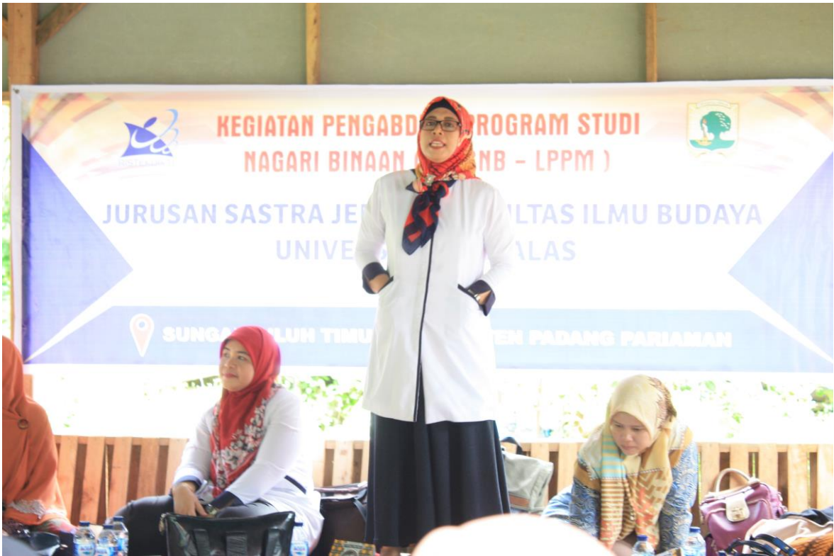
(Gambar 6 Penyampaian Profil FIB oleh Wakil Dekan III)