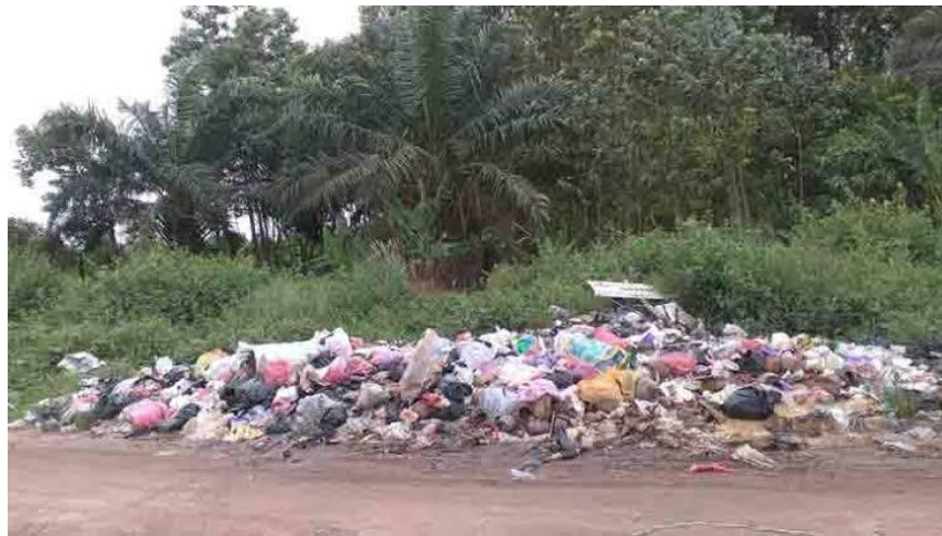
(Gambar 3. Sampah dibuang di tanah kosong)

Kesan kumuh yang disebabkan oleh pengelolaan sampah yang tidak benar menyebabkan perlunya pengelolaan sampah yang baik disosialisasikan kepada masyarakat Sungai Buluh Timur perlu sehingga lingkungan menjadi bersih dan dapat bernilai ekonomi. Pada kesempatan pengabdian masyarakat ini Jurusan Sastra Jepang Fakultas Ilmu Budaya Universitas Andalas akan memberikan Penyuluhan Pengelolaan Sampah Ala Jepang bagi Masyarakat di Nagari Sungai Buluh Timur Padang Pariaman.