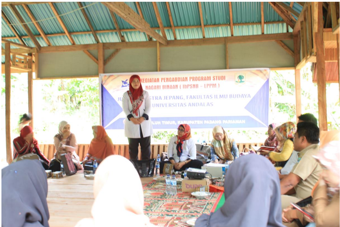
(Gambar 5 Kata Sambutan yang disampaikan oleh Ketua Jurusan Sastra Jepang)