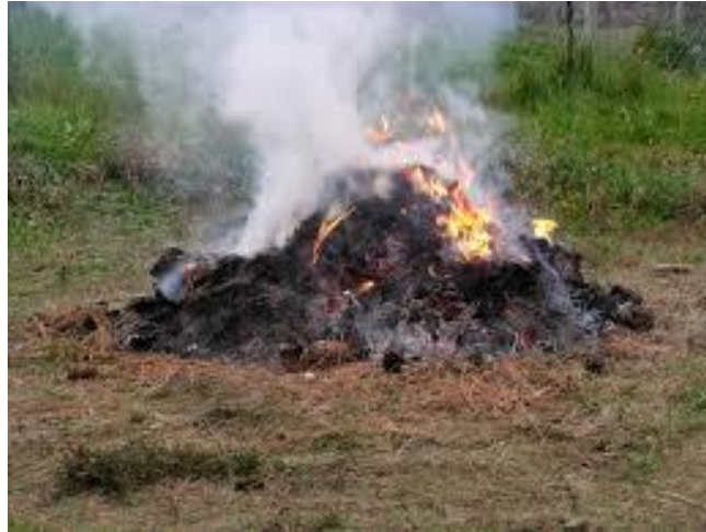
(Gambar 2. Sampah dibakar)