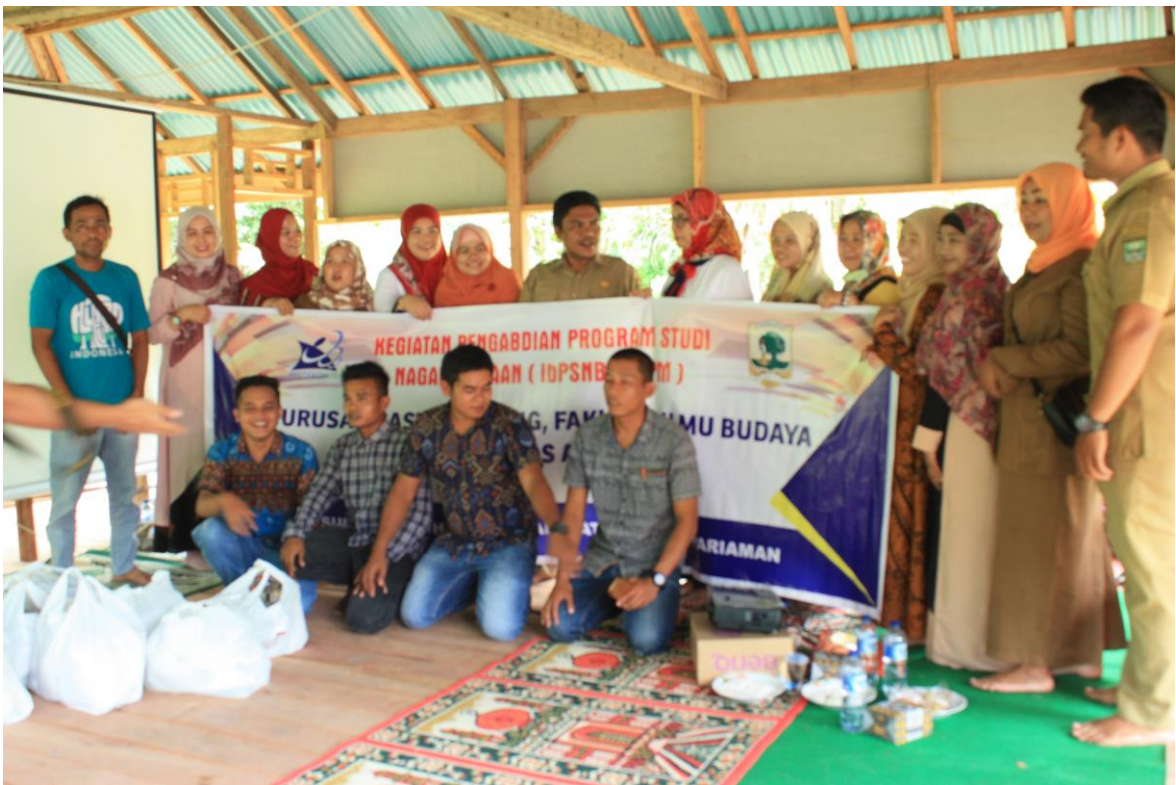
(Gambar 9 Tim Pengabdi, Perangkat Nagari dan Peserta )