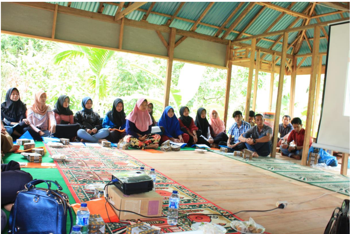
(Gambar 7 Peserta memperhatikan penyampaian materi )