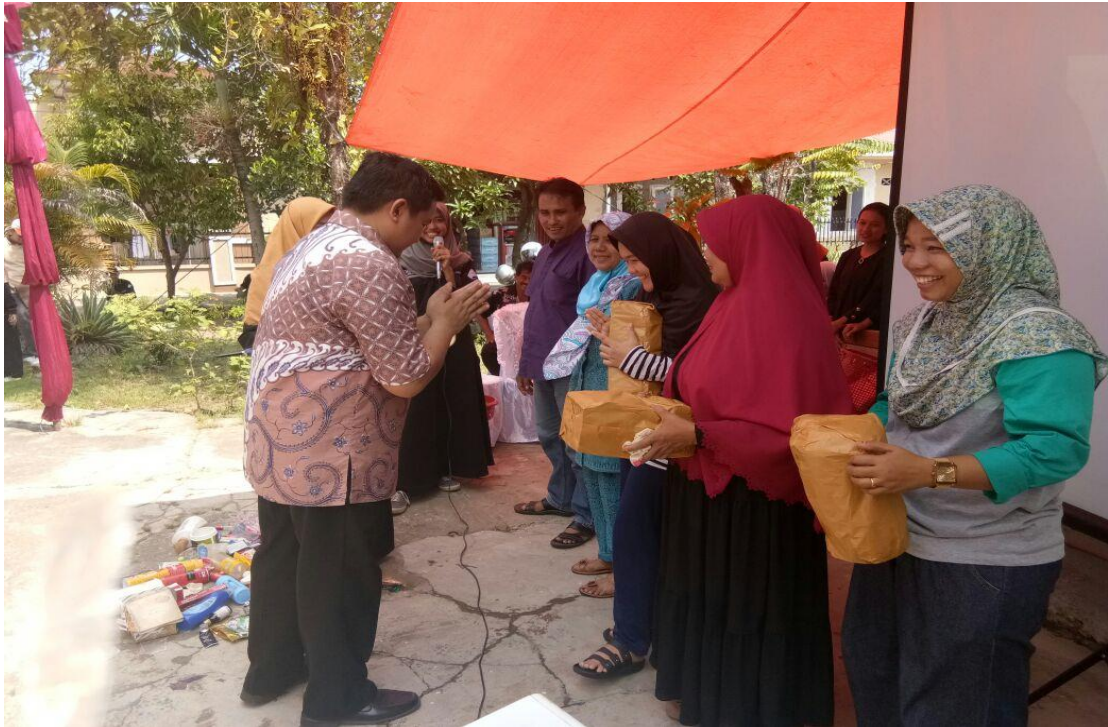
Gambar 5. Penyerahan Hadiah kepada Pemenang

Setelah games dan penyerahan hadiah, sekitar jam 12.30 WIB acara ditutup dengan makan dan foto bersama seluruh panitia dan masyarakat, seperti terlihat pada Gambar 6.