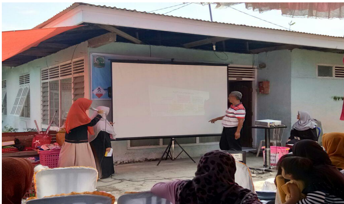
Gambar 4. Games Alur Kerja Sistem bank Sampah