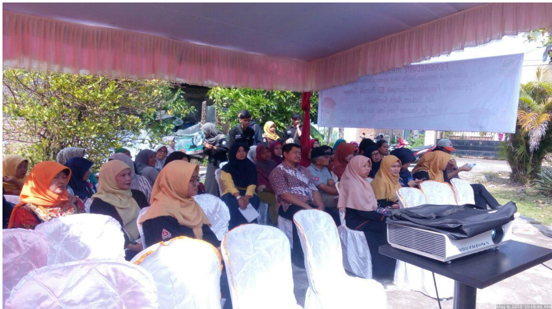
Gambar 2. Peserta Sosialisasi di Kelurahan Jati, Kota Padang

Setelah pemberian materi, acara dilanjutkan dengan games tentang pemilahan SB3-RT dan alur kerja bank sampah. Games dilakukan berkelompok untuk pemilahan SB3-RT. Setiap kelompok diminta untuk memilah SB3RT dari sampah yang disediakan dan memasukkan ke dalam wadah khusus B3. Jumlah SB3-RT terbanyak yang terpilah