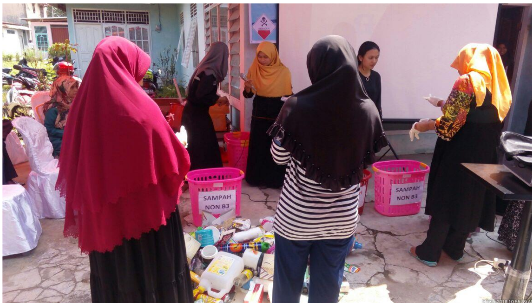
Gambar 3. Games Pemilahan SB3-RT

merupakan pemenang dalam games ini. Untuk games alur kerja bank sampah, masyarakat diminta menyusun kembali puzzle alur kerja yang sudah diacak. Peserta yang menyusun alur kerja yang tepat merupakan pemenang dalam game ini. Kepada masing-masing pemenang diberikan hadiah sebagai bentuk penghargaan. Gambar 3 sampai dengan Gambar 5 menampilkan dokumentasi suasana games dan penyerahan hadiah.