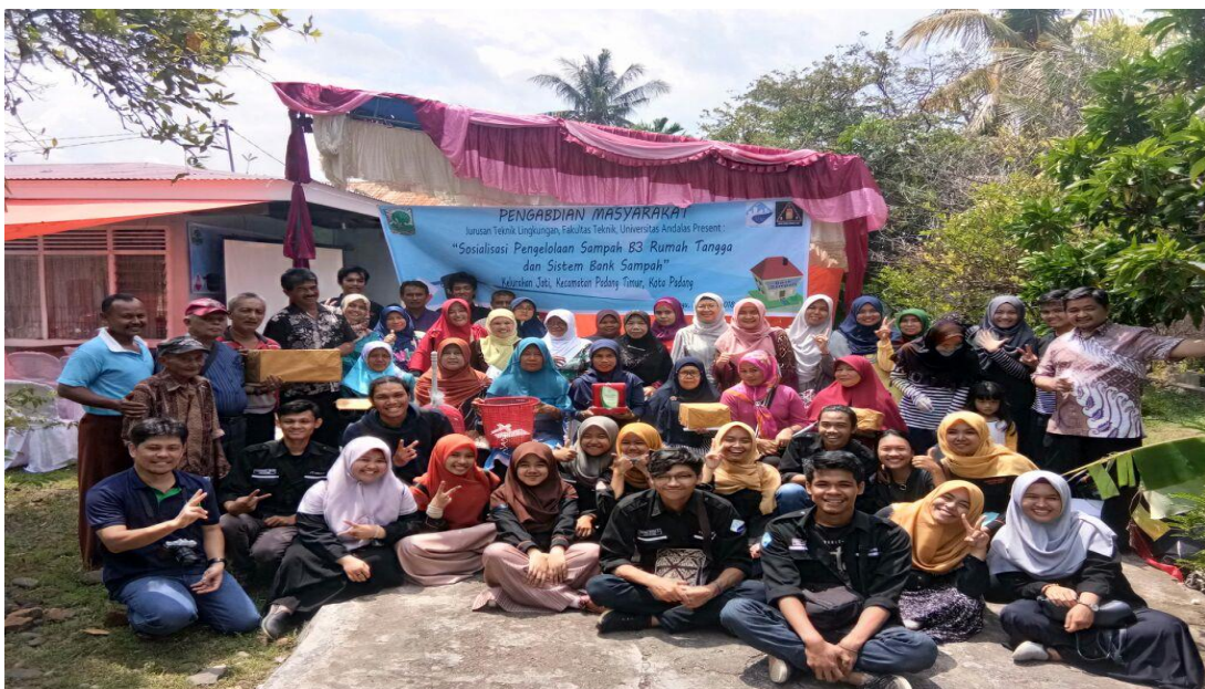
Gambar 6. Foto Bersama Setelah Kegiatan Selesai

Setelah games dan penyerahan hadiah, sekitar jam 12.30 WIB acara ditutup dengan makan dan foto bersama seluruh panitia dan masyarakat, seperti terlihat pada Gambar 6.