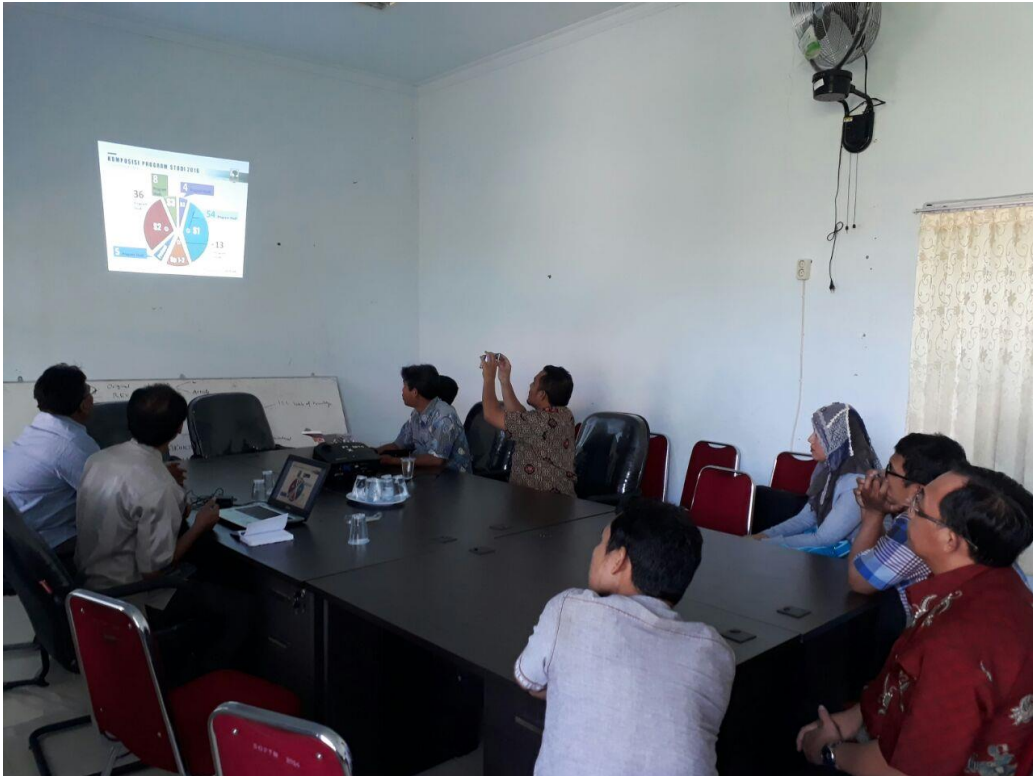
Gambar 11 Sosialisasi Program Studi S3 Teknik Mesin Kepada Dosen-Dosen Universitas Bengkulu