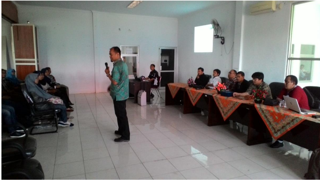
Gambar 7 Sosialisasi Program Studi S2 Teknik Mesin kepada Mahasiswa Universitas Bengkulu