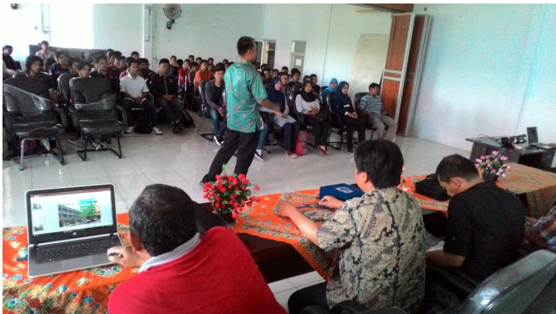
Gambar 8 Mahasiswa Peserta Sosialisasi Program Studi S2 Teknik Mesin di Universitas Bengkulu