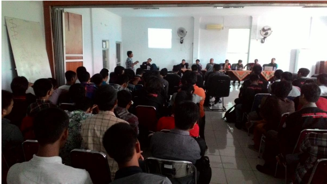
Gambar 9 Tanya Jawab dengan Peserta Sosialisasi