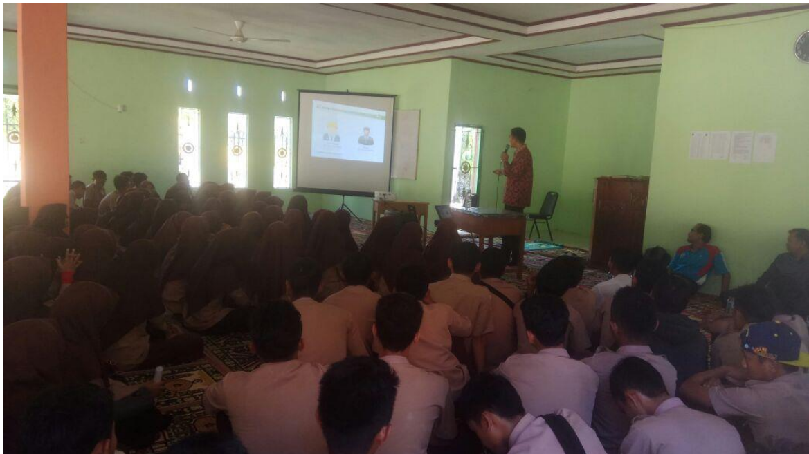
Gambar 4 Sosialisasi Program Studi Teknik Mesin di SMA N 1 Ranah Pesisir