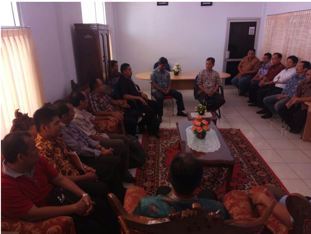
Gambar 6 Diskusi Tim Sosialisasi JTM dengan Dekan Fakultas Teknik Universitas Bengkulu