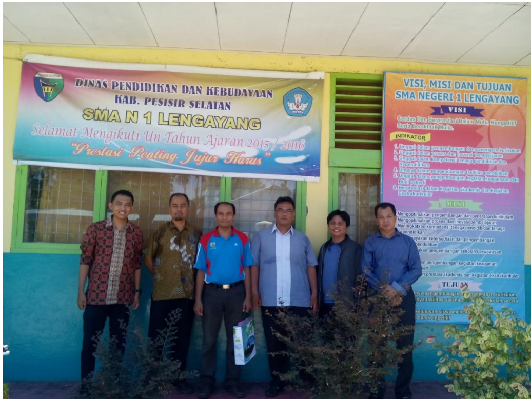
Gambar 1 Tim sosialisasi JTM Unand ke SMA N 1 Lengayang