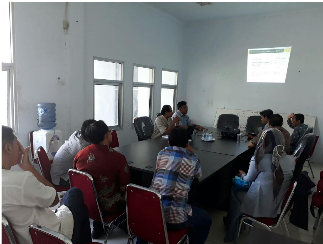
Gambar 10 Sosialisasi Program Studi S3 Teknik Mesin Kepada Dosen-Dosen Universitas Bengkulu