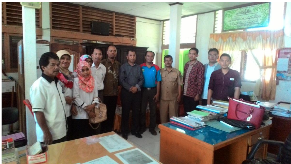
Gambar 2 Tim Sosialisasi dan Majelis Guru SMA N 1 Lengayang