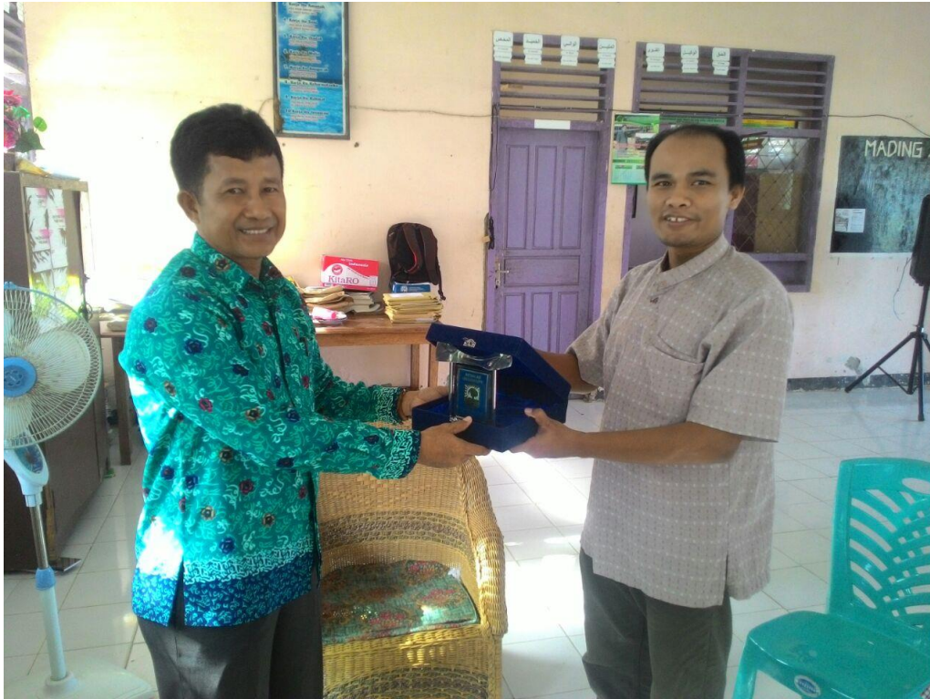
Gambar 5 Pemberian Plakat dari Tim Sosialisasi JTM ke Kepala Sekolah SMA N 1 Muko Muko