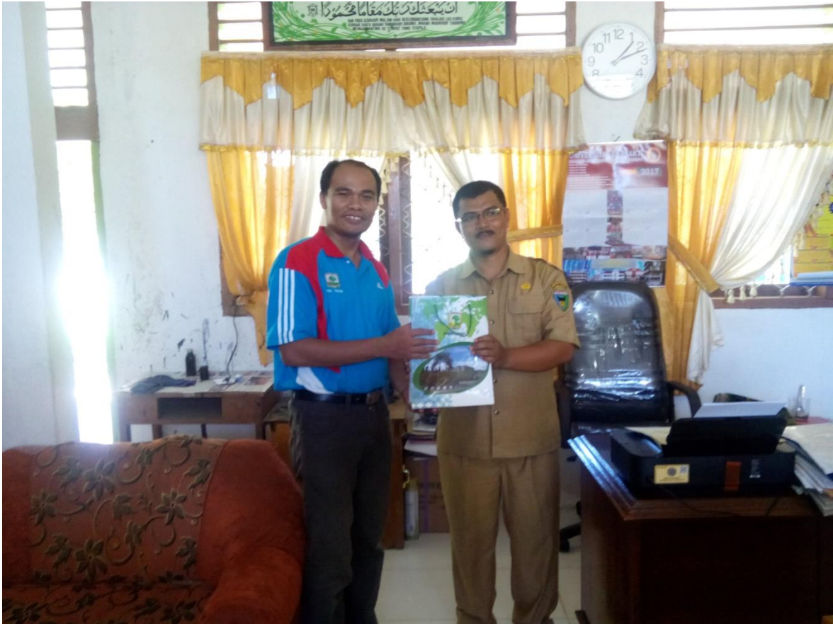
Gambar 3 Penyerahan plakat kenang-kenangan oleh Ketua Tim Sosialisasi ke Wakil Kepala Sekolah SMA N 1 Lengayang