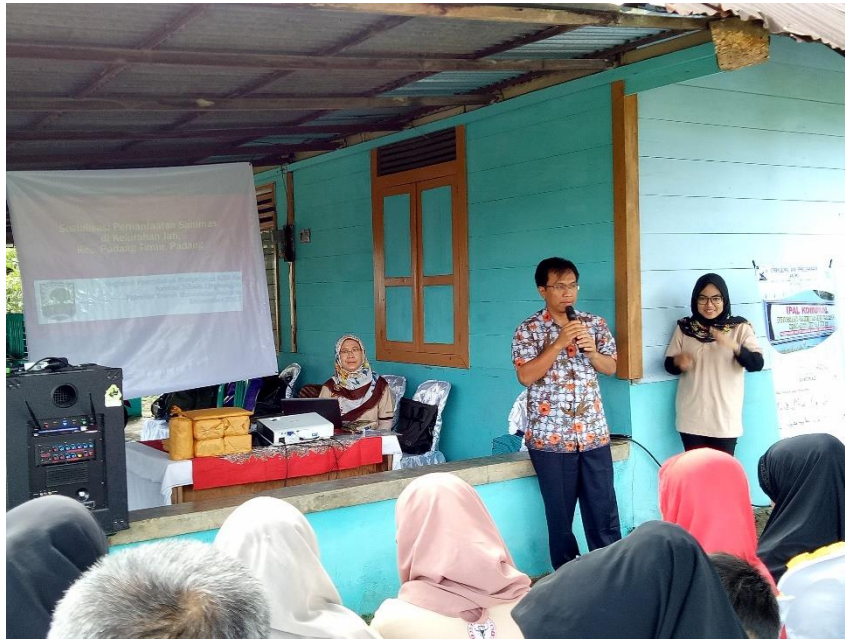
Gambar 3. Pembukaan oleh Ketua Jurusan Teknik Lingkungan