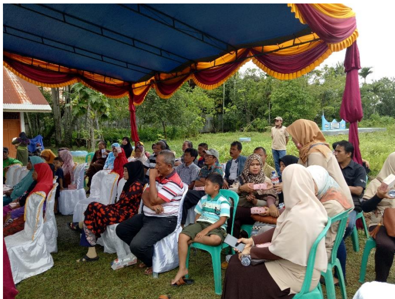
Gambar 7. Suasana Acara