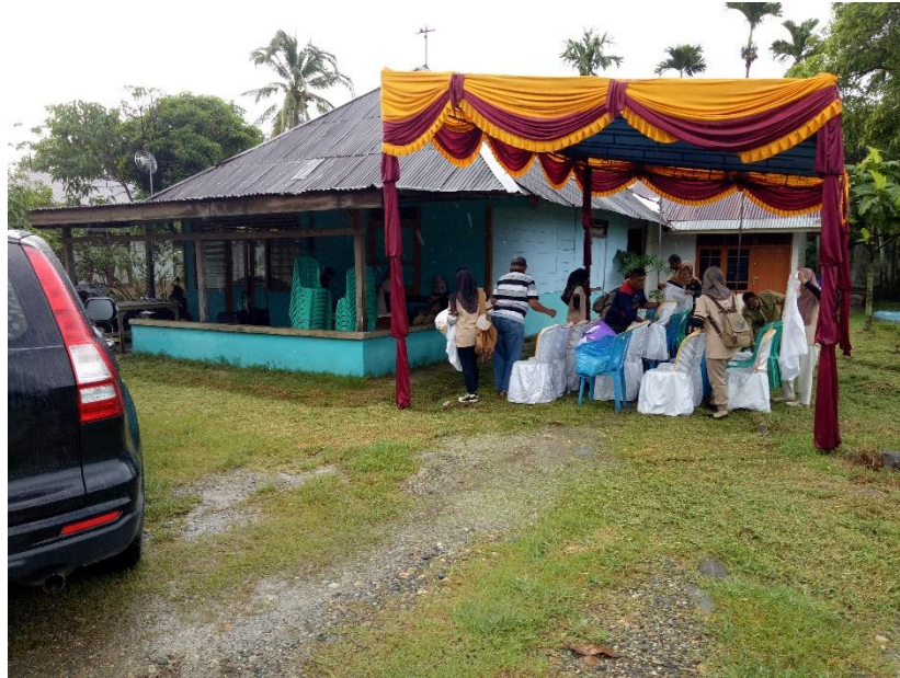
Gambar 1. Persiapan Acara