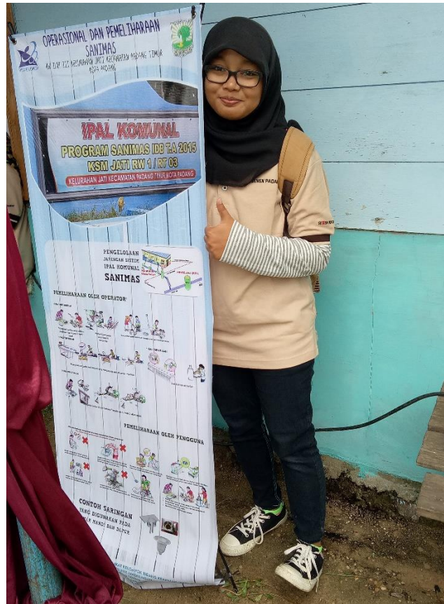
Gambar 8. X-banner