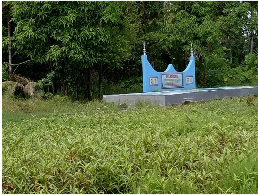
Gambar 5. IPAL Sanimas di Kelurahan Jati RW 01 RT 03

Setelah acara pembukaan, sosialisasi dilanjutkan dengan penyampaian materi oleh dosen Teknik Lingkungan yaitu Dr. Puti Sri Komala. Materi presentasi berupa materi sekilas tentang Sanimas, Anaerobic Biofilter, Pemanfaatan dan Pemeliharaan. Materi ditekankan kepada pemeliharaan yang harus dilakukan masyarakat agar Sanimas berfungsi dengan baik dan bermanfaat sesuai tujuan pembuatannya. Masyarakat Kelurahan Jati terlihat sangat antusias dan aktif selama kegiatan ini, terlihat dari pertanyaan yang disampaikan, begitu juga usul usul yang dilontarkan, dan permintaan agar kegiatan serupa juga diberikan dengan topik lain seperti masalah sampah dan kesehatan lingkungan.