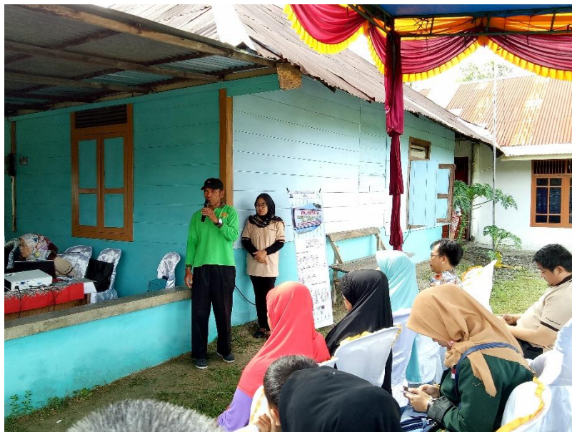
Gambar 4. Kata Sambutan oleh Ketua LPM Jati Mandiri