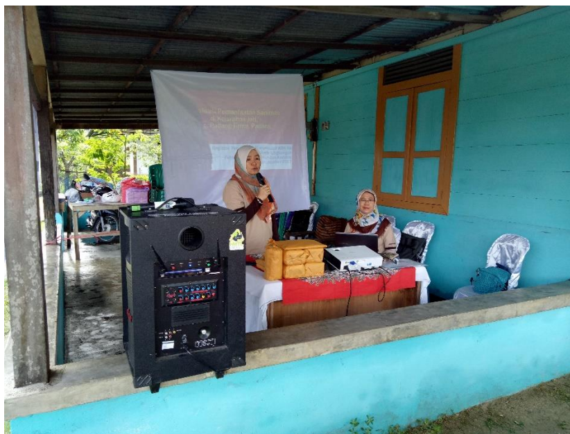
Gambar 2. Kata Sambutan oleh Ketua Acara pengabdian Masyarakat KBK Air Jurusan Teknik Lingkungan Unand