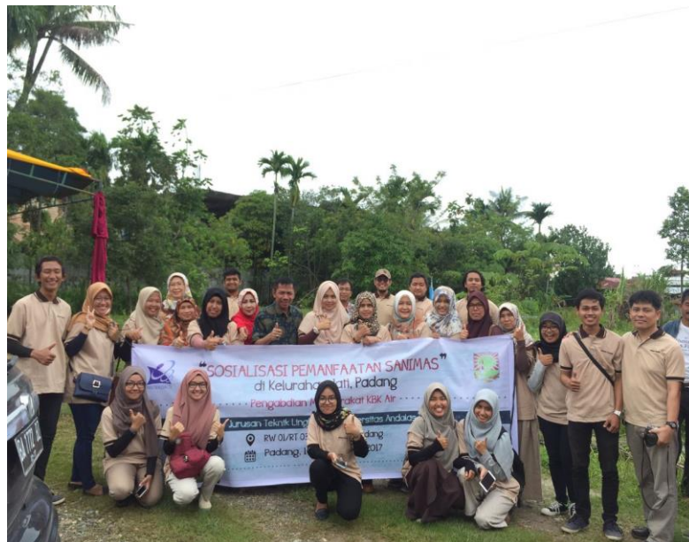
Gambar 9. Foto Bersama